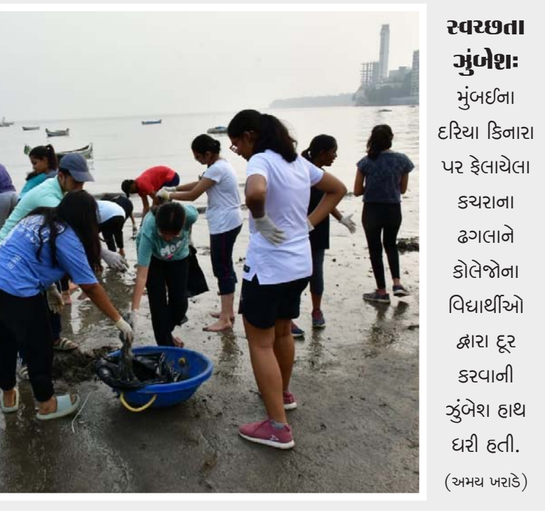
સ્વચ્છતા મુંબઈ: મુંબઈના દરિયા કિનારા પર ફેલાયેલા કચરાના ઢગલાને કોલેજોના વિદ્યાર્થીઓ દ્વારા દૂર કરવાની ઝુંબેશ હાથ ધરી હતી.

વાહનની નોંધણી કરવામાં આવી હતી. આ આંકડાની સાથે મુંબઈમાં વાહનોની કુલ સંખ્યા ૪૫ લાખ પહોંચી ગઈ છે. જેમાં ૨.૬ લાખથી ટુ વ્હીલર, ૧.૪.૪ લાખ ફોર વ્હીલર છે, જ્યારે ૧૧.૬૨ લાખથી વધુ માલવાહક જેમ કે ટ્રક વગેરે વાહનો છે. આ કુલ સંખ્યામાં ૨.૩ લાખથી વધુ રિક્ષા છે અને ૨,૦૬૦ એમ્બ્યુલન્સનો પણ સમાવેશ થાય છે. પાર્કિંગને લીધે ઊભી થતી સમસ્યા અને પ્રસૂનો ઉકેલવા મહાપાલિકા દ્વારા ઓન-સ્ટ્રીટ પાર્કિંગ પ્રોજેક્ટને પાર પાડવા માટે પ્રથમ તબક્કામાં ડી વોર્ડમાં ૧૨૭ વાહનો, જી/દક્ષિણમાં ૮૬ વાહનો, કે/પશ્ચિમમાં ૨૨૦ અને એસ વોર્ડમાં ૧૦૮ વાહન માટે પાર્કિંગના સ્થળો ઊભા કરવામાં આવશે. ■