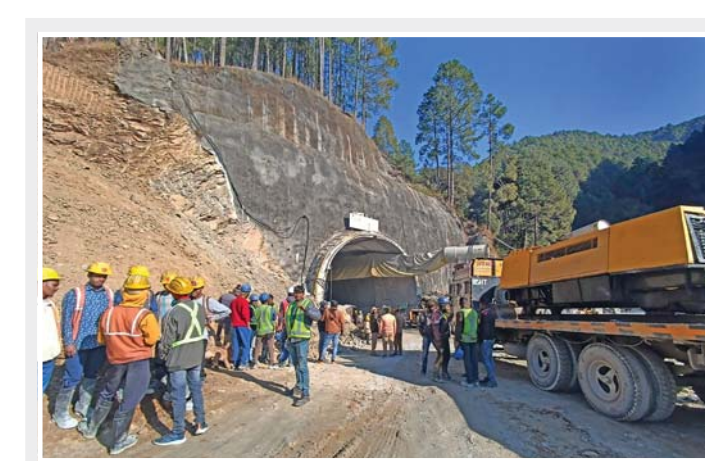
રાહત અને બચાવ કામગીરી: ઉત્તરકાશી જિલ્લાસ્થિત બ્રહ્માખલ-યમનોત્રી નેશનલ હાઇવે પર સિલ્કયારા અને દાંડલગામ વચ્ચે નિર્માણાધિન બોગદાનો હિસ્સો સોમવારે તૂટી પડ્યા બાદ રાહત અને બચાવ કામગીરી કરી રહેલી ટુકડીઓ. ઉત્તરાખંડના મુખ્ય પ્રધાન પુષ્કર ધામીએ ઘટનાસ્થળની મુલાકાત લઈ રાહત અને બચાવ કામગીરીની સમીક્ષા કરી હતી.

તેલંગણાના ગવર્નર તાનિલિસાઈ સુંદરરાજન અને મુખ્ય પ્રધાન કે. ચંદ્રશેખર રાવે ઘટના અંગે શોક અને મૃતકોના પરિવારજનો પરત્વે સહાનુભૂતિ વ્યક્ત કરી હતી. પ્રત્યેક મૃતકના પરિવારજનોને પાંચ લાખ રૂપિયાનું વળતર આપવાની રાવે જાહેરાત કરી હતી. આગની અન્ય એક ઘટનામાં નાગાલેન્ડના દિમાપુર જિલ્લાના નાહારબારી વિસ્તારમાં લાગેલી આગમાં ત્રણ બાળક સહિત એક જ પરિવારનાં પાંચ જણનું મોત થયું હતું. આગ રવિવારે સવારે ૧૦:૪૫ વાગે લાગી હતી. ફટકડાને કારણે આગ લાગી હોવાનું અનુમાન છે. આગને કારણે પચાસ જેટલા પરિવારોને અસર થઈ હતી. જોકે, આગનું ચોક્કસ કારણ જાણી શકાયું નહોતું. મૃતકોના મૃતદેહ પરિવારજનોને સુપરત કરવામાં આવી હોવાનું તેમણે (એજન્સી) કહ્યું હતું.