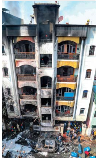
આગ: હેઠરાબાદના નામાપવલી વિસ્તારમાં સોમવારે એક બહુમાળી ઈમારતમાં લાગેલી આગમાં નવ જણનાં મોત થયા હતા. આગ લાગ્યા બાદ અગ્નિશમન દળના જવાનો અને પોલીસ અધિકારીઓ ઘટનાસ્થળે પહોંચી ગયા હતા. (એજન્સી)

હેઠરાબાદ: અહીંના નામવલ્લી વિસ્તારમાં રહેવાસી ઈમારતમાં લાગેલી આગમાં ગૂંગાઈ જવાથી અલગ અલગ બે પરિવારના નવ જણનું મોત થયું હોવા ઉપરાંત એક જણ ઘાયલ થયો હતો, એમ હોવાનું પોલીસ અને અગ્નિશમન દળના અધિકારીઓએ સોમવારે કહ્યું હતું. આગની અન્ય એક ઘટનામાં નાગાલેન્ડના દિમાપુર જિલ્લાના નાહારબારી વિસ્તારમાં લાગેલી આગમાં ત્રણ બાળક સહિત એક જ પરિવારનાં પાંચ જણનું મોત થયું હોવાનું અધિકારીઓએ કહ્યું હતું.