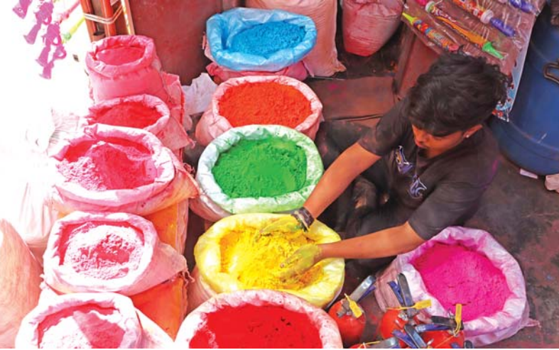
રંગીન: હોળી-દુળેટીને ગણતરીના દિવસો બાકી છે ત્યારે બજારમાં રંગબેરંગી રંગો વેચાવા લાગ્યા છે. (અમય ખરાડે)

મુંબઈ: પર્યાવરણ પ્રત્યે જાગૃતિ વધારવાની સાથે સાથે વિવિધ પર્યાવરણીય સંસ્થાઓ, વિદ્વાનો અને તજજ્ઞો જનજાગૃતિ ફેલાવી રહ્યા છે, જેથી તહેવારો અને ઉજવણી પર્યાવરણને અનુકૂળ રીતે કરી શકાય, પણ બજારમાં હાલમાં ઉપલબ્ધ હોળી રમવા માટેના કલર્સ નૈસર્ગિક નહીં, પણ કેમિકલયુક્ત છે. પર્યાવરણવાદીઓના જણાવવા અનુસાર પ્રકૃતિપ્રેમીઓને છેતરવામાં આવી રહ્યા છે. શહેરમાં ઈકો ફ્રેન્ડલી નહીં, પણ રાસાયણિક રંગની હોળી મનાવવામાં આવી રહી હોવાનું પર્યાવરણપ્રેમીઓનું કહેવું છે. આજના સમયમાં ધૂળનું સ્વરૂપ બદલાઈ ગયું છે. નૈસર્ગિક કલર્સની જગ્યા રાસાયણિક પ્રક્રિયાથી તૈયાર કરવામાં આવેલા કલર્સ લીધી છે. બે અઠવાડિયાંથી પ્લાસ્ટિકની થેલીઓ, કુગ્ગાઓ અને વિવિધ રંગના ગુલાલ વેચાઈ રહ્યા છે. રસ્તે ચાલતા રાહદારીઓ પર પ્લાસ્ટિકની થેલીઓ કે પછી કુગ્ગાઓ ફેંકવાનું પ્રમાણ સતત ચાલી રહ્યું છે. જોકે મુંબઈ પોલીસે આવી વ્યક્તિઓ પર કાર્યવાહી કરવાની શરૂ કરી દીધી છે. રાસાયણિક કલર્સને કારણે આંખમાં ચળ આવવી, આંખ લાલ થઈ જવી, અંધત્વ આવી જવું, આંખમાં ડાઘ થવો, ખુજલી આવવી, શ્વાસમાં તકલીફ થવી, ઉધરસ આવવી, જુલાબ કે પછી ઊલટી થવી જેવી મુશ્કેલીઓ ઊભી થાય છે. વેચનાર તો કંઈ પણ વેચશે, પણ ખરીદનારે