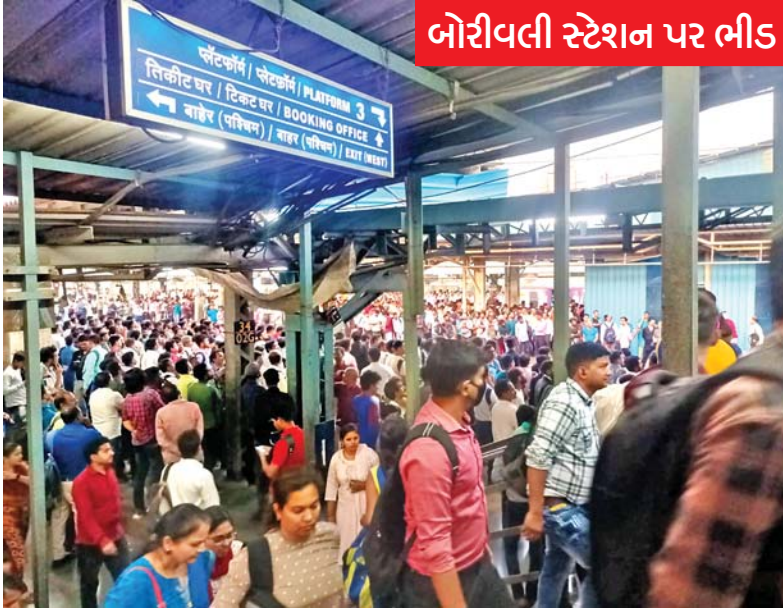
બોરીવલી સ્ટેશન પર ભીડ

મુંબઈ: સિમ્લ ફેઈલ્યોર થવાને કારણે મંગળવારે વેસ્ટર્ન રેલવેમાં ટ્રેનોની અવરજવર ઉપર અસર થઈ હતી. પશ્ચિમ રેલવેમાં વસઈ-વિરાર દરમિયાન સિમ્લ ફેલ થવાના કારણે ડાઉન ફાસ્ટ અને અપ સ્લો લાઇન ઉપર ટ્રેનોની વ્યવહારને અસર થઈ હતી. મંગળવારે સાંજે સાડા ચાર વાગ્યાની આસપાસ સિમ્લમાં ખામી સર્જાઈ હતી, પરિણામે ફાસ્ટ અને સ્લો લાઈનની ટ્રેન પર અસર થઈ હતી. વિરારથી ચર્ચગેટની લોકલ ટ્રેન સહિત લાંબા અંતરની મેલ-એક્સપ્રેસ ટ્રેનસેવા પર અસર થવાથી પ્રવાસીઓ માટે ટ્રેનમાં ટ્રાવેલ કરવામાં હાલાકી પડી હતી. મુસાફરી કરવામાં હાલાકી પડી હતી, મરમત કર્યા પછી ટ્રેનસેવા ચાલુ કરવામાં આવી હતી, એમ પશ્ચિમ રેલવેના અધિકારીએ જણાવ્યું હતું. પશ્ચિમ રેલવેમાં વસઈ રેલવે સ્ટેશન નજીક સંજના ઝ. ૩૨ વાગ્યાના સુમારે સિમ્લ ફેઈલ્યોર થયું હતું, પરિણામે ડાઉન સ્લો અને ફાસ્ટ લાઈનની ટ્રેનસેવા પર પહેલા અસર થઈ હતી. વસઈ અને વિરારની ટ્રેનસેવા ઠપ થવાને કારણે પશ્ચિમ રેલવેના તમામ ગીચ સ્ટેશન પર અસર થઈ હતી. સિમ્લ ફેઈલ્યોરના સમયગાળા દરમિયાન બોરીવલી, દહીસર, ભાયંદર, નાલાસોપારા, વસઈ-વિરાર સહિતના સ્ટેશન પર પ્રવાસીઓની ભીડ રહી હતી, જ્યારે લોકલ ટ્રેનમાં પણ ભીડ રહેવાથી ટ્રેનમાં મુસાફરી કરવામાં હાલાકી પડી હતી, (જુઓ પાનું ૪) ▶▶