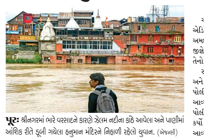
પૂર: શ્રીનગરમાં ભારે વરસાદને કારણે ઝેલમ નદીના કાંઠે આવેલા અને પાણીમાં આંશિક રીતે ડૂબી ગયેલા હનુમાન મંદિરને નિહાળી રહેલો યુવાન.

શ્રીનગર: જમ્મુ-કાશ્મીરમાં છેલ્લા કેટલાક દિવસોથી સતત પડી રહેલા ભારે વરસાદને કારણે હાહાકાર મચી ગયો છે. અવિરત વરસાદના કારણે આવેલા પૂરમાં અત્યાર સુધીમાં ત્રણ કિશોર સહિત પાંચ લોકોના મોત થયા છે. પૂરને કારણે ઘણા પશુઓ મૃત્યુ પામ્યા છે અને અનેક ઘરોને નુકસાન થયું છે. અધિકારીઓએ જણાવ્યું કે ૩૫૦ થી વધુ પરિવારોનું સલામત સ્થળે સ્થળાંતર કરવામાં આવ્યું છે. સરકારે ઘાટીમાં શાળાઓ બંધ કરી દીધી છે અને કાશ્મીર યુનિવર્સિટીએ મંગળવારે લેવાનાર તમામ પરીક્ષાઓ મુલતવી રાખી છે. એક તરફ સતત પડી રહેલા વરસાદને લીધે આવેલા પુર અને સાથે જ ભૂસ્ખલનને કારણે કાશ્મીરમાં હાહાકાર મચવા પામ્યો (જુઓ પાનું ૨) >>