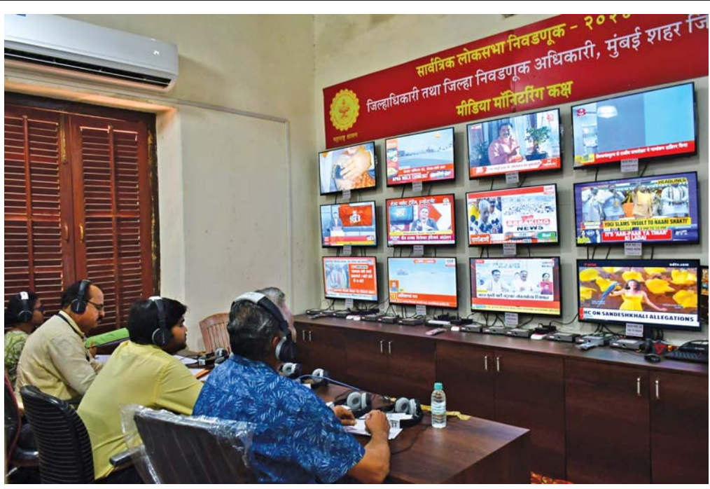
ચૂંટણી પંચની અચૂક નજર: લોકસભાની ચૂંટણી માટેની આચારસંહિતા લાગુ થઈ ગઈ ત્યારબાદ કોઈપણ રાજકીય પક્ષ દ્વારા ન્યૂઝ ચેનલો પર પરદા-ન્યૂઝ, જાહેરાતો કે પછી પ્રચાર સામગ્રી નથી દર્શાવવામાં આવતી તેના ઉપર નજર રાખવા માટે કોર્ટે ખાતે આવેલી જૂની કસ્ટમ્સ ઓફિસમાં મીડિયા મોનીટરીંગ રૂમ ઊભો કરવામાં આવ્યો છે. જેમાં ચૂંટણી અધિકારીઓ તેના પર દર્શાવતી તમામ સામગ્રી ઉપર અચૂક નજર રાખી રહ્યા છે.