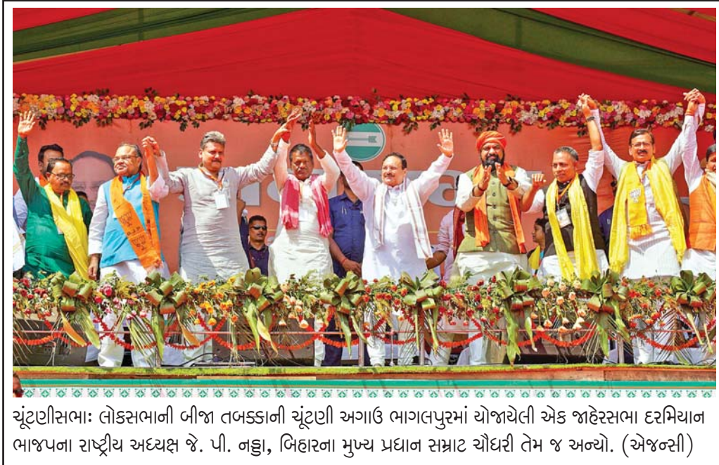
ચૂંટણીસભા: લોકસભાની બીજા તબક્કાની ચૂંટણી અગાઉ ભાગલપુરમાં યોજાયેલી એક જાહેરસભા દરમિયાન ભાજપના રાષ્ટ્રીય અધ્યક્ષ જે. પી. નહ્તા, બિહારના મુખ્ય પ્રધાન સમ્રાટ ચૌધરી તેમ જ અન્યો. (એજન્સી)

મતદારસંઘોમાં મહારાષ્ટ્રની બુલઢાણા, અકોલા, અમરાવતી, વર્ધા, યવતમાળ-વાશિમ, હિંગોલી, નાંદેડ અને પરભણી બેઠકનો સમાવેશ થાય છે. આચારસંહિતાના ભાગરૂપે ઉત્તર પ્રદેશના મેરઠ-મથુરા સહિત અનેક શહેરોમાં ડ્રાય ઝેર હાથે કરવામાં આવ્યા છે. બુધવારે સાંજે પાંચ વાગ્યાથી ૪૮ કલાક માટે બધી જ બિયર શોપ અને મોડેલ શોપ બંધ રાખવામાં આવશે. મહારાષ્ટ્રમાં મુખ્ય પ્રધાન એકનાથ શિંદે, ભૂતપૂર્વ મુખ્ય પ્રધાન ઉદ્ધવ ઠાકરે, નાયબ મુખ્ય પ્રધાન દેવેન્દ્ર ફડણવીસ, એનસીપી સુપ્રીમો શરદ પવારની રેલીનું આયોજન બુધવારે કરવામાં આવ્યું હતું. ■