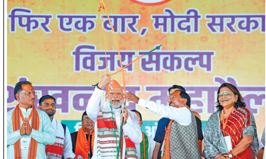
નિશાન: લોકસભાની ચૂંટણી અગાઉ છત્તીસગઢના સૂર્યજી જિલ્લામાં બુધવારે યોજાયેલી એક જાહેરસભામાં ધનુષ્ય-બાણ સાથે વડા પ્રધાન નરેન્દ્ર મોદી. છત્તીસગઢના મુખ્ય પ્રધાન વિષ્ણુ દેવ સાંઈએ પણ આ જાહેરસભામાં હાજરી આપી હતી.

સરહદની પરિક્ષા કરવા માટે શ્રદ્ધાળુઓની ભીડ ઉમટી પડી છે. ૮૪ કોસી યાત્રામાં ૫૦૦ થી વધુ સંતો અને સ્થાનિક લોકો જોડાયા હતા. પરિક્ષાથી સીતારામના નામના સંકીર્તન સાથે યાત્રાની શરૂઆત કરી રહી હતી. સરયૂ પૂજન સાથે યાત્રાનો પ્રારંભ થયો હતો. ઉપરાંત આ યાત્રા આંબેડકર નગર, સુલતાનપુર, બારાબંકી, ગોંડા જિલ્લા પહોંચે ૨૧ દિવસમાં અયોધ્યા પરત પહોંચશે, જ્યાં રામજન્મભૂમિની પરિક્ષા કર્યા બાદ ૮૪ કોસી પરિક્ષા પૂર્ણ થશે. હનુમાન મંડળ દળના પ્રમુખ પરિક્ષાના આયોજક સુરેન્દ્ર સિંહે જણાવ્યું હતું કે આ યાત્રા લગભગ ૨૬૫ કિલોમીટર લાંબી છે, જે પાંચ