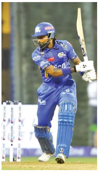
ક્રિકેટ-નિષ્ણાતોએ તો અત્યારથી જ હાર્દિકનો છેદ ઉડાડી દીધો છે.

ખાસ કરીને ઓલરાઉન્ડર્સ કપરી કસોટી આપવાની છે. લગભગ શિવમ દુબે અને હાર્દિક પંડ્યામાંથી કોઈ એકને જ વર્લ્ડ કપની ટિટિલ મળી શકશે. તો આવો જાણીએ તેમની વચ્ચે કેવી હરીફાઈ થઈ રહી છે! આઈપીએલના આ સીઝનનો ફર્સ્ટ-હાફ પૂરો થઈ ગયો છે. કેટલાક