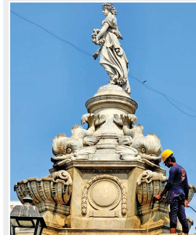
ક્લિન-અપ ટાઈમ: બુધવારે ચર્યંગેટના હુતાત્મા ચોકના ફ્લોરા ફાઉન્ટેનની આવેલી શિલ્પાકૃતિને સ્વચ્છ કરતો સરકારી કર્મચારી કચકડે કંડેરાઈ ગયો હતો.

આ કેસમાં ઈડી દ્વારા આ પૂર્વે ઉદ્ભવ ઠાકરેની શિવસેનાના સાંસદ સંજય રાઉત અને તેના ખૂબ જ નજીકના મનાતા પ્રવીણ રાઉતની ૧૧૫ કરોડ રૂપિયાની મિલકત પણ ટાંચમાં લીધી હતી. ગોવા ખાતેની સારંગ વાઘવાન અને રાકેશ વાઘવાનની ૩૧.૫૦ કરોડ રૂપિયાની મિલકતો પણ ઈડી દ્વારા આ પહેલા ટાંચમાં લેવામાં આવી છે. જોકે ઈડી ઊંડાણપૂર્વક તપાસ કરી રહી હોવાના કારણે હવે આ કેસના આરોપીઓ સામે ગાળિયો વધુને વધુ કસાતો જતો હોવાનું અને તેમની મુઠ્ઠેલી વધી રહી હોવાનું જણાવ રહ્યું છે. ■