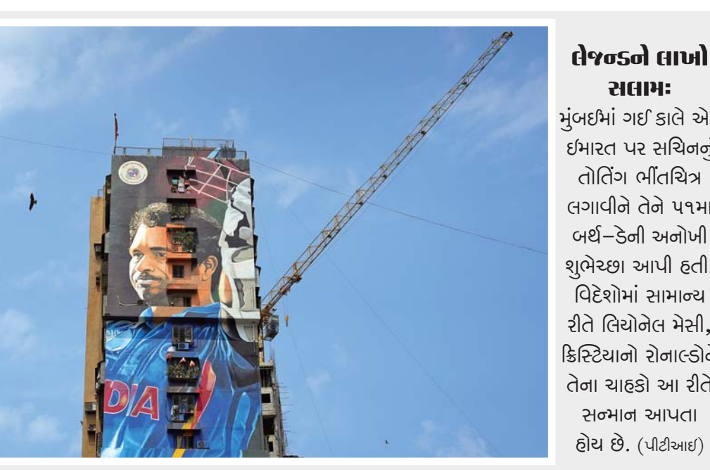
લેજન્ડને લાખો સત્તામાં: મુંબઈમાં ઘઈ કાલે એક ઈમારત પર સચિનનું તોર્નિંગ ભીંતચિત્ર લગાવીને તેને ૫૧મા બર્થ-ડેની અનોખી શુભેચ્છા આપી હતી. વિદેશોમાં સામાન્ય રીતે લિયોનેલ મેસી, ક્રિસ્ટિયાનો રોનાલ્ડોને તેના ચાહકો આ રીતે સન્માન આપતા હોય છે. (પીટીઆઈ)

બેરેસ્ટોરાં છે. તેની નેટવર્થ એમએસ ધોની તેમ જ વિરાટ કોહલીથી પણ વધુ છે. એવું મનાય છે કે સચિને વિવિધ જગ્યાએ જે ઇન્વેસ્ટમેન્ટ કર્યું છે એના દ્વારા વર્ષે ૧૦ કરોડ રૂપિયાની કમાણી કરે છે. મુંબઈ અને કેરળમાં તેની પાસે આલીશાન બંગલો છે. બાંદરા (પશ્ચિમ)માં સચિન જે વિશાળ બંગલામાં રહે છે એની કિંમત ૧૦૦ કરોડ રૂપિયા છે. તેણે ૨૦૦૭માં અંદાજે ૪૦ કરોડ રૂપિયામાં એ બંગલો ખરીદ્યો હતો. બાંદરા-કુર્લા કોમ્પ્લેક્સમાં તેની પાસે એક લક્ઝરિયસ ફ્લેટ પણ છે. સચિન પાસે અનેક જાણીતા મોડેલની કારનો વિશાળ કલેક્શન છે. ■