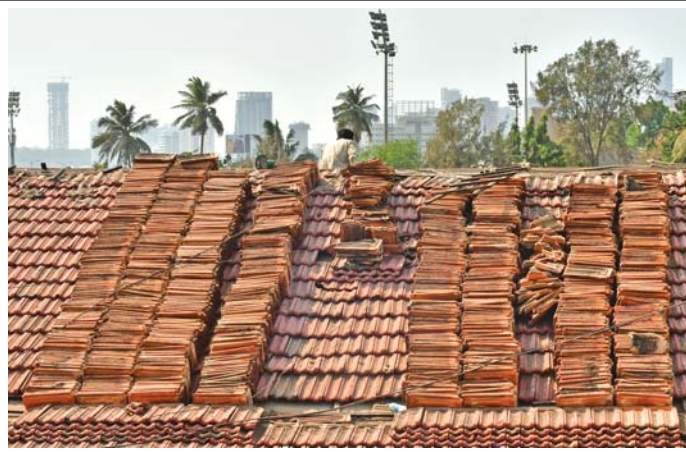
ઉનાળાની ગરમીમાં ચોમાસાની તૈયારી: સૂર્યદેવ કોપાયમાન થયા હોય તેમ મુંબઈના પર ગરમીનો ડાળો કેર વર્તાઈ રહ્યો છે ત્યારે જાણે અનેક લોકોની તરસ છિપાવનારા પાણીનું ગેલન પૂરું પાડનારા પોતે સાઈકલ ઉપર ધોમધપતા તડકામાં તપી રહેલા મુંબઈના રસ્તા પર દેખાયા હતા. બીજી બાજુ ઉનાળો પૂરો થાય અને ચોમાસું બેસે તેની રાહ જોનારા અમુક મુંબઈના ચોમાસું પણ ઉપાધિ લાવે તેવું છે. જેના કારણે પોતાના ઘરની નળિયાવાળી છતનું સમારકામ કરાવી ચોમાસામાં ઘરમાં પાણી ન પડે તેની તૈયારીઓ પણ ચાલુ થઈ ગઈ છે. (અમ્ય ખરાડે)

વિધાનસભાના વિરોધપક્ષ નેતા તેમ જ કોંગ્રેસના ડિગ્ગજ નેતા વિજય વેટ્ટીવારે આપ્યું છે. ઉલ્લેખનીય છે કે ભાજપ તરફથી ઉત્તર-મધ્ય મુંબઈની બેઠક પરથી મુંબઈ આતંકી હુમલા (જુઓ પાનું ૪) >>