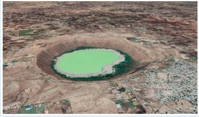
(તસવીર: ઉલ્કા તળાવ)

(અમારા પ્રતિનિધિ તરફથી) ભુજ: અનેક ભૌગોલિક વિશેષતાઓથી સમૃદ્ધ એવા ભાતીગળ પ્રદેશ કચ્છના પ્રસિદ્ધ યાત્રાધામ યાજ્ઞપીર નજીક આવેલા ભુજ તાલુકાના લુણા ગામના રહસ્યમયી ‘કેટર લેક’ એટલે કે, ઉલ્કા તળાવને વિશ્વના ઉલ્કાપાતથી સર્જાયેલા ૨૦૦ જેટલા દુર્લભ સ્થળો પૈકીના એક સ્થળ તરીકે અમેરિકાની અવકાશી સંસ્થા નાસાએ જાહેર કર્યું છે.