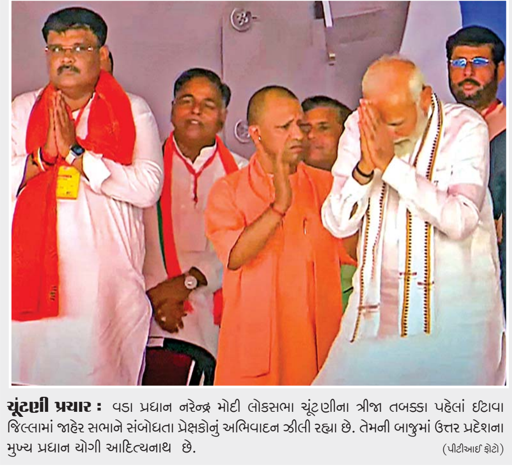
ચૂંટણી પ્રચાર : વડા પ્રધાન નરેન્દ્ર મોદી લોકસભા ચૂંટણીના ત્રીજા તબક્કા પહેલાં ઈટાવા જિલ્લામાં જાહેર સભાને સંબોધતા પ્રેક્ષકોનું અભિવાદન ઝીલી રહ્યા છે. તેમની બાજુમાં ઉત્તર પ્રદેશના મુખ્ય પ્રધાન યોગી આદિત્યનાથ છે. (પીટીઆઈ ફોટો)

ઈન્ફાલ : રવિવારે મણિપુરના અનેક વિસ્તારોમાં કરાં સાથે વરસાદ પડતાં ઘરો અને વાહનોને નુકસાન થયું હતું. અધિકારીઓએ કહ્યું હતું કે ઈન્ફાલ પશ્ચિમના કાંચીપુર અને તેરા સહિતના રાજ્યના વિસ્તારોમાં અનેક ઘરો નુકસાન પામ્યા છે. કરાને લીધે કલાઈના પતરામાં કાણાં પડી ગયા છે. જોરદાર પવનને (જુઓ પાનું ૨) ▶▶