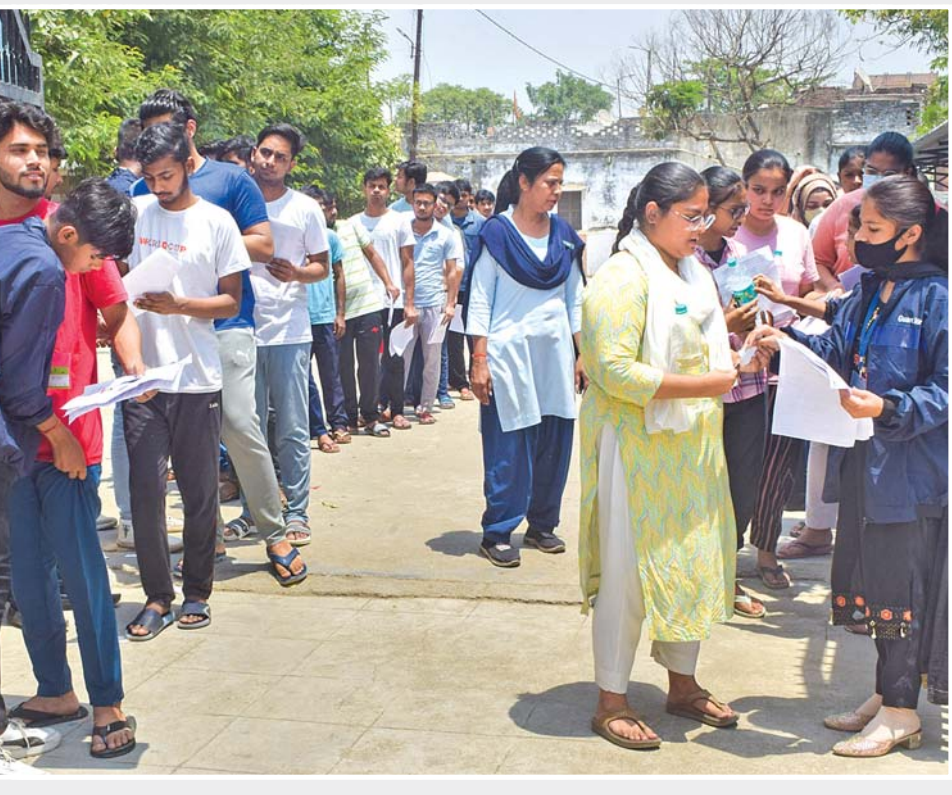
ભાવિ કોંકટરો : નીટ (યુજી) ૨૦૨૪ પરીક્ષામાં ઉમેદવારોની બરેલીમાં રવિવારે પરીક્ષા કેન્દ્રમાં પ્રવેશતાં પહેલાં ઝડપી કરાઈ હતી.

લુધિયાણા : પંજાબમાં ફરી એક વાર રેલવે તંત્રની બેદરકારી સામે આવી છે. જેમાં લુધિયાણાના ખર્યા ખાતે ટ્રેક પર ચાલી રહેલી ઝર્મના એક્સપ્રેસનું એન્જિન અચાનક બોગીથી અલગ થઈ ગયું અને લગભગ ત્રણ કિલોમીટર સુધી ચાલતું રહ્યું. ટ્રેક પર કામ કરતા કી-મેને એલાર્મ વગાડ્યું અને ટ્રાહવરને જાણ કરી. આ પછી ટ્રાહવરે એન્જિન બંધ કરી દીધું અને એન્જિનને બોગી સાથે જોડ્યું. આ દરમિયાન મોટી દુર્ઘટના ટળી હતી. સફળાવ્ય એ હતું કે તે સમયે જ્યાં બોગીઓ ઊભી હતી ત્યાં બીજી કોઈ ટ્રેન પાટા પર આવી ન હતી. નહીંતર મુસાફરોના જીવ જોખમમાં મુકાઈ શક્યા હોત. ટ્રેનમાં બેથી અઢી હજાર મુસાફરો હતા. જેમાં મળતી માહિતી મુજબ, ટ્રેન નંબર ૧૨૩૫૫/૫૬ અર્ચના એક્સપ્રેસ પટનાથી જમ્મુ જઈ રહી હતી. સરહિદ જંકશન પર ટ્રેનનું એન્જિન બદલવામાં આવ્યું હતું.