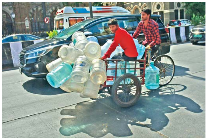
સૂર્યદેવ કોપાયમાન થયા હોય તેમ મુંબઈના પર ગરમીનો ડાળો કેર વર્તાઈ રહ્યો છે ત્યારે જાણે અનેક લોકોની તરસ છિપાવનારા પાણીનું ગેલન પૂરું પાડનારા પોતે સાઈકલ ઉપર ધોમધપતા તડકામાં તપી રહેલા મુંબઈના રસ્તા પર દેખાયા હતા. બીજી બાજુ ઉનાળો પૂરો થાય અને ચોમાસું બેસે તેની રાહ જોનારા અમુક મુંબઈના ચોમાસું પણ ઉપાધિ લાવે તેવું છે. જેના કારણે પોતાના ઘરની નળિયાવાળી છતનું સમારકામ કરાવી ચોમાસામાં ઘરમાં પાણી ન પડે તેની તૈયારીઓ પણ ચાલુ થઈ ગઈ છે. (અમ્ય ખરાડે)