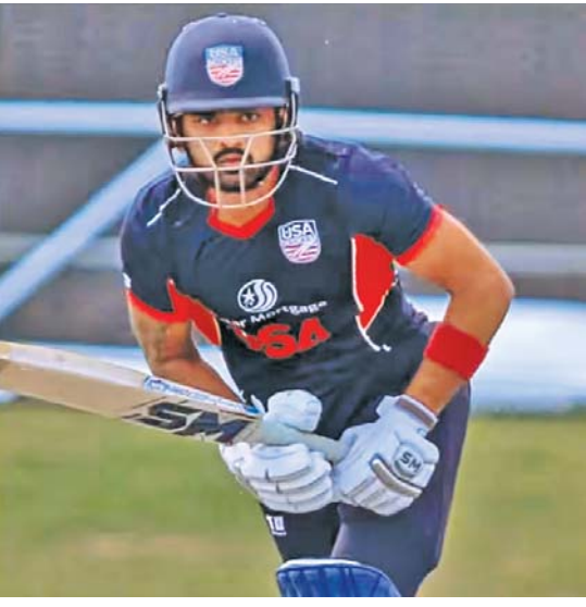
અમેરિકાનો કેપ્ટન મોનાંક પટેલ

ન્યૂ યૉર્ક: અમેરિકામાં આંતરરાષ્ટ્રીય ક્રિકેટ સ્પર્ધા તો ઘણી વાર રમાઈ છે, પણ વર્લ્ડ કપનું આયોજન બહુ જ મોટો અવસર કહેવાય અને એ અવસર બહુ નજીક આવી ગયો છે. પહેલી જૂને મેન્સ ટી-૨૦ વર્લ્ડ કપ શરૂ થઈ રહ્યો છે. વેસ્ટ ઇન્ડિઝ સંયુક્ત યજમાન છે, પરંતુ ઘણી મેંચો અમેરિકામાં રમાવાની છે. ખાસ કરીને ભારત-પાકિસ્તાન વચ્ચે નવમી જૂને ન્યૂ યૉર્કમાં હાઈ-પ્રોફાઇલ જંગ ખેલાશે. એક યજમાન વેસ્ટ ઇન્ડિઝની ટીમ તો એમાં રમવાની જ છે, સહ-યજમાન અમેરિકાની ટીમ પણ મેદાન પર ભિતરશે એ સાથે ક્રિકેટના વર્લ્ડ કપમાં નવું પ્રકરણ શરૂ થશે. અમેરિકામાં દાયકાઓથી હજારો ને લાખો ભારતીયો સ્થાયી થયા છે અને એમાં ઘણા પરિવારોમાંથી એક કે વધુ વ્યક્તિએ અમેરિકાના રમતગમત ક્ષેત્રે નામના મેળવી છે. અમેરિકાની ક્રિકેટની વાત કરીએ તો એમાં ભારતીય મૂળના ઘણા ખેલાડીઓ સક્રિય છે. ટી-૨૦ વર્લ્ડ કપમાં રમનારી અમેરિકાની ટીમની જ વાત કરીએ તો એમાં ૧૫માંથી આઠ ખેલાડી ભારતીય મૂળના છે અને એમાં પછા બે પ્લેયર ગુજરાતી છે. આ બંને