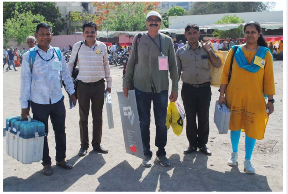
લોકસભા ચૂંટણીના મતદાનની તૈયારી માટે રાજકોટ યોધરી હાર્ડસ્કૂલ ખાતેથી ઈવીએમ અને વિવિપેટ રવાના કરાયા હતા.

લગાવાયા હતા. પોલીસે આસપાસના બીજા સ્થળના સીસીટીવી કેમેરાના ફૂટેજના આધારે લૂંટારુનું પગલું શોધવા વધુ તપાસ હાથ ધરી હતી. અત્રે ઉલ્લેખનીય છે કે, ચૂંટણી વિભાગ દ્વારા સીસીટીવી મોનિટરિંગ હેઠળ જિલ્લાના ક્રિટિકલ મતદાન મથકો પર વેબ કાર્ટીંગની તૈયારી શરૂ કરાઈ છે. સીસીટીવી મોનિટરિંગ કરાશે. જિલ્લામાં ચૂંટણી દરમિયાન લોખંડી બંદોબસ્તનું આયોજન કરવામાં આવ્યું છે જેમાં પેરા મિલિટરી ફોર્સની કંપની, એસઆરપી પ્લાટુનર સાથે ૭૦૦થી વધુ જવાનો પોલીસને બંદોબસ્તમાં ગોઠવવામાં આવ્યા છે. ■