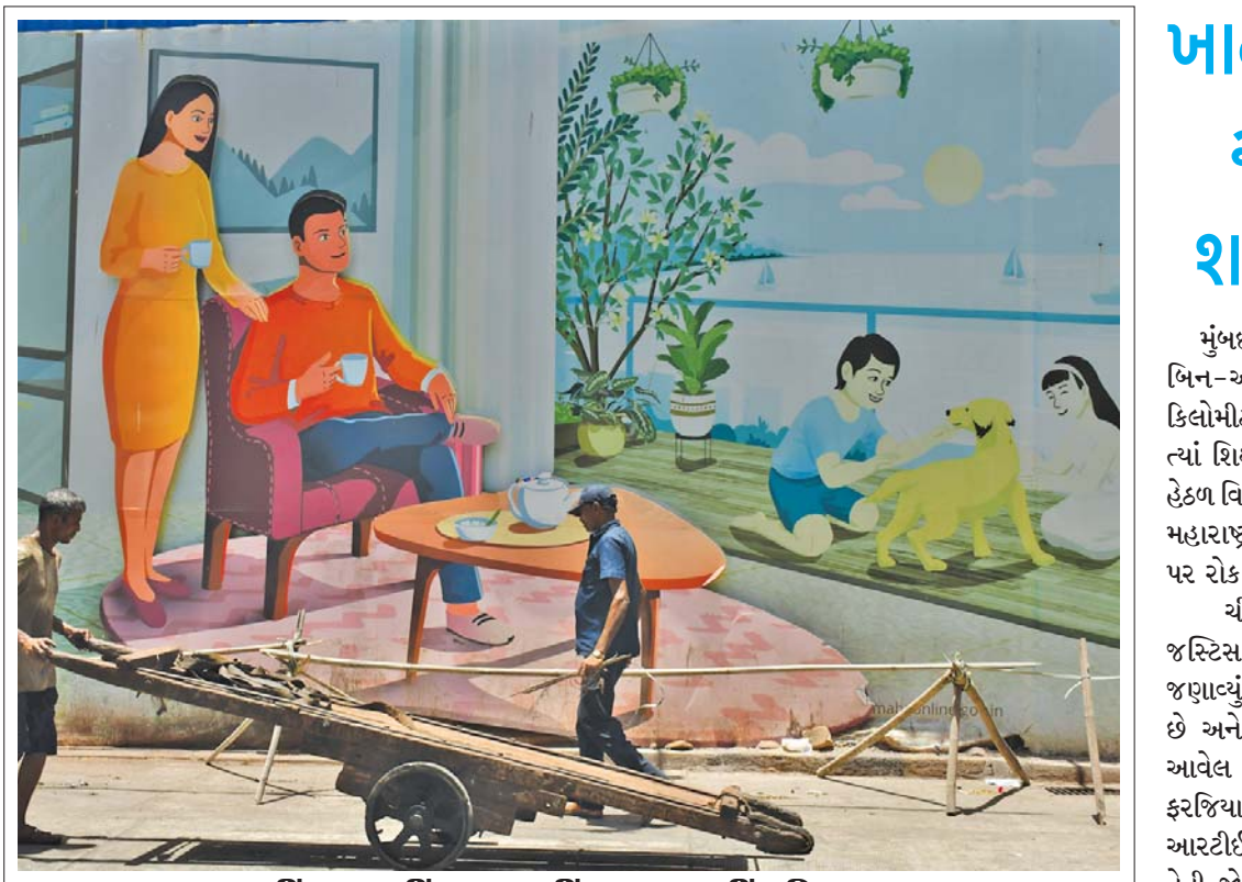
કહીં પૂપ-કહીં છાવ, કહીં આરામ-કહીં પરિશ્રમ: સમાજના બે અત્યંત વિરોધાભાસી પાસાઓને દર્શાવતી આ તસવીર છે. સમાજનો એક વર્ગ એવો છે જેની પાસે ભૌતિક સાધનો અને એશો-આરામની તમામ સગવડો છે જ્યારે એક વર્ગ એવો છે જે ગમે તેવી પરિસ્થિતિ હોય, ધોધમાર વરસાદ, કડકડતી ઠંડી કે બળબળતો તાપ, કાળી મજૂરી અને પરિશ્રમ કરીને પોતાનું પેટ ભરે છે. (અમય ખરાડે)

મુંબઈ: લોકસભાની ચૂંટણી માટે બે તબક્કાનું મતદાન થઈ ગયું છે અને બંને તબક્કાના મતદાન દરમિયાન મતદારોની ટકાવારી જોઈએ તેટલી ન હોવાનું મહારાષ્ટ્રના મુખ્ય પ્રધાન એકનાથ શિંદેનું માનવું છે. રાજ્યમાં કાળઝાળ ગરમીનો પ્રકોપ છે અને તેના કારણે મતદારો ઓછી સંખ્યામાં મતદાનની ફરજ બજાવવા ઘરની બહાર પડતા હોવાનું પણ કહેવામાં આવે છે. જોકે, આગામી તબક્કાના મતદાન દરમિયાન આમ ન થાય એ માટે પ્રયત્ન કરવાની અપીલ મુખ્ય પ્રધાન એકનાથ શિંદેએ મહાધુતિના કાર્યકરોને કરી છે. બાકીના ત્રણ તબક્કાના મતદાન દરમિયાન મતદાન કરવા આવનારા મતદારોની ટકાવારી વધે એ માટે પ્રયત્ન કરવાનું આહવાન શિંદે દ્વારા મહાધુતિના કાર્યકરોને કરવામાં આવ્યું છે. થાણેમાં પોતાના જૂથના ઉમેદવાર નરેશ મહેરકે માટે પ્રચાર દરમિયાન તેમણે આ અપીલ કરી હતી. તેમણે કહ્યું હતું કે ચૂંટણી અત્યંત ગરમીમાં યોજાઈ રહી છે અને તેની અસર આપણને મતદાનની ટકાવારી ઉપર સ્પષ્ટ જોવા મળી રહી છે. આપણે મોટા માર્જિનથી જીતીશું તેમાં બેમત નથી, પરંતુ મતદાનની ટકાવારી વધે એ માટે પ્રયત્ન કરવાની જરૂર છે. બૂથ વર્કર અને ઇન-બ્લોક કાર્યકરોએ મતદાનના શક્યતાના કલાકોમાં વધુમાં વધુ લોકો મતદાન કરવા આગળ આવે એ માટે પ્રયાસ કરવાનું શિંદેએ જણાવ્યું હતું. ■