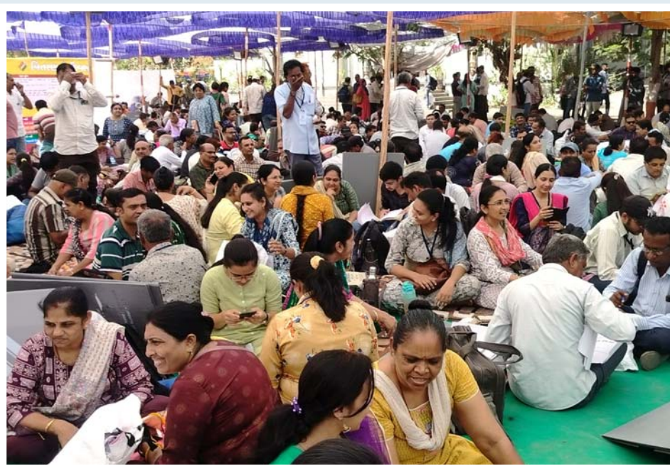
લોકસભા ચૂંટણીના મતદાનની તૈયારી માટે જૂનાગઢમાં ઈવીએમ અને વિવિપેટ રવાના કરાયા હતા.

બિલ્ડિંગ ધરાશાયી થઈ હતી. દરમિયાન ઝૂંપપટ્ટીમાં રમી રહેલા ચાર જેટલાં બાળકો કાટમાળ નીચે દબાયા હતા. જેને પગલે સ્થાનિક લોકો અને તંત્ર ઘટના સ્થળે દોડી આવ્યું હતું. જેસીબીની મદદથી બાળકોને બહાર કાઢવા રેસ્ક્યૂ હાથ ધર્યું હતું. એક બાળકનું મોત થયું હતું. જ્યારે ત્રણને સારવાર માટે હોસ્પિટલ ખસેડવામાં આવ્યા હતા. જેમાંથી બેની હાલત નાજુક હોવાનું જાણવા મળ્યું હતું. ઘટનાની જાણ થતાં પોલીસના ઉચ્ચ કામગીરી હાથ ધરી હતી. પ્રાપ્ત માહિતી અનુસાર ધ્રોલમાં આવેલી નૂરી હાઇસ્કૂલ પાસે જૂની