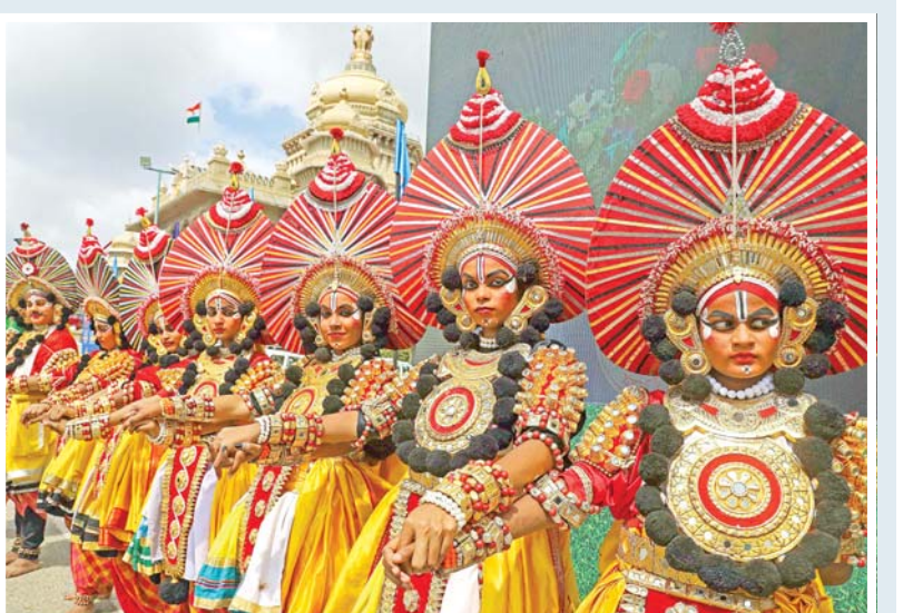
માનવ સાંકળનો વિક્રમ: કર્ણાટકમાં 'આંતરરાષ્ટ્રીય લોકશાહી દિન'ની ઉજવણી કરવા પચીસ હજાર લોકોએ માનવ સાંકળ રચીને વિશ્વ વિક્રમ કર્યો હતો. માનવ સાંકળ તૈયાર કરવામાં મુખ્ય પ્રધાન સિદ્ધરમેયા, પ્રધાનો, સરકારી અધિકારીઓ, કર્મચારીઓ, કલાકારો, વિદ્યાર્થીઓ અને સામાન્ય નાગરિકો જોડાયા હતા. તેઓએ વૃક્ષ ઉગાડવા હજારો રોપા પણ વાવ્યા હતા.