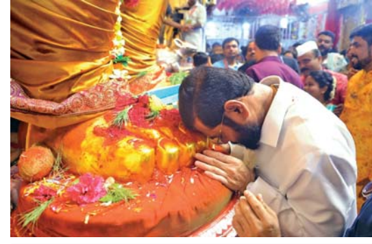
બાપ્પા ફળ્યા: આવી પ્રાર્થના મુખ્ય પ્રધાન એકનાથ શિંદેએ લાલબાગ યા રાજાના ચરણમાં કરી હશે.

મુંબઈ: ૧૧ દિવસનો ગણપતિ ઉત્સવ મંગળવારે સમાપ્ત થશે. જેમ જેમ અંતિમ વિસર્જનનો દિવસ નજીક આવી રહ્યો છે તેમ તેમ રાજ્યભરના ભક્તો પરંપરાગત ગણેશ મંડળોની મુલાકાત લેવા અને બાપ્પાના આશીર્વાદ લેવા ઊમટી રહ્યા છે. મહારાષ્ટ્રના મુખ્ય પ્રધાન એકનાથ શિંદેએ પણ સોમવારે બપોરે તેમના આખા પરિવાર સાથે મુંબઈના અત્યંત પ્રસિદ્ધ લાલબાગયા રાજાની મુલાકાત