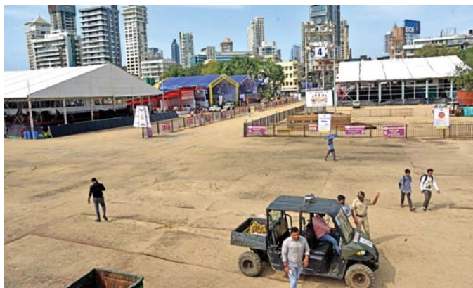
ગિરગામ ચોપાટી પર વિસર્જનની તૈયારી. (અમય ખરોડે)

મુંબઈ: અનંત ચતુર્દશીએ મુંબઈમાં ટ્રાફિકમાં અવરોધ ઊભો ન થાય એ માટે વિશેષ ગ્રીન કોરિડોર તૈયાર કરવામાં આવ્યો છે અને ટ્રાફિક વિભાગના અડી હજારથી વધુ અધિકારી અને કર્મચારીઓને ટ્રાફિકના નિયમન માટે રાખવામાં આવ્યા છે. મુંબઈમાં વિસર્જનને દિવસે બંદોબસ્ત માટે ૨૩ હજારથી વધુ પોલીસ તહેનાત કરાયા છે, જ્યારે લાલબાગ યા રાજાની સુરક્ષા માટે પાંચ હજાર પોલીસને રાખવામાં આવ્યા છે. એ સિવાય ધ્વનિ પ્રદૂષણ બાબતે ન્યાયાલયના આદેશ અનુસાર કાર્યવાહી કરાશે, એમ પોલીસ અધિકારીએ જણાવ્યું હતું. કયા માર્ગ રહેશે બંધ? ટ્રાફિક પોલીસે મુંબઈમાંના નાથાલાલ પારેખ માર્ગ, કેપ્ટન પ્રકાશ