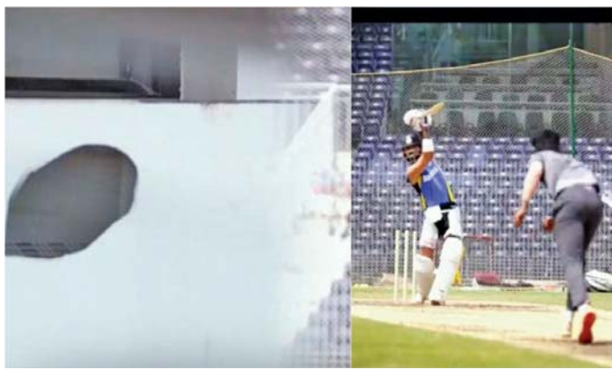
હતી. તેના એક શોટમાં બોલ નજીકની દીવાલને લાગ્યો હતો જેમાં મોટું બાકોરું પડી ગયું હતું. ટીમ ઇન્ડિયા હવે થોડા દિવસ રેડ

ચેન્નઈ: ગુરુવાર, ૧૯મી સપ્ટેમ્બરે અહીં બાંગ્લાદેશ સામે શરૂ થનારી પ્રથમ ટેસ્ટ માટે ટીમ ઇન્ડિયાના ખેલાડીઓ પૂરજોશમાં તૈયારી કરી રહ્યા છે. એમાં પણ વિરાટ કોહલી લંડનમાં પત્ની અનુષ્કા અને બંને બાળકો, વામિકા તથા અકાશ સાથે એક મહિનો વેકેશન માણ્યા બાદ પાછો આવ્યો છે એટલે પ્રેક્ટિસ સેશનમાં જોરદાર ફટકાબાજ કરી રહ્યો છે. ભારતના ત્રણેય ફોર્મટ માટેના ભૂતપૂર્વ કેપ્ટન વિરાટે રવિવારે નેટ સેશનમાં બોલસેની ખબર લઈ નાખી હતી. તેના એક શોટમાં બોલ નજીકની દીવાલને લાગ્યો હતો જેમાં મોટું