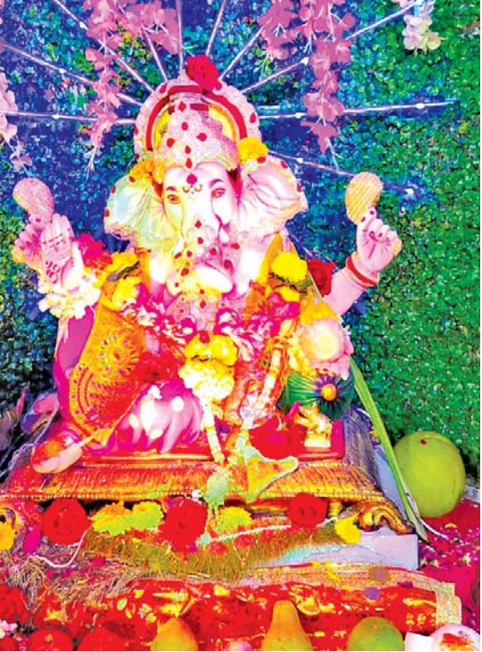
રાજગિરી સોસાયટી કાંદિવલી (દિસ્ત)

ગણેશોત્સવમાં વિવિધ થીમ સાથેની સજાવટ સાથે ગણપતિ બાપ્પાની પધરામણી કરાઈ છે. 'મુંબઈ સમાચાર' દર વર્ષની જેમ આ વર્ષે પણ આવા સરસ-સરસ મૂર્તિઓના દર્શનનો લાભ આપશે તેના વાચકોને.