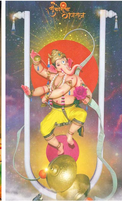
પરમાનંદવાડી બાળમિત્ર મંડળ (મુંબાઈવેલીના ગણરાજ)