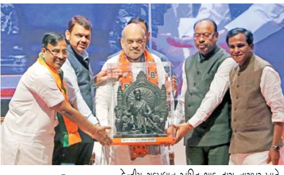
આરંભ હૈ પ્રયઃ: કેન્દ્રીય ગૃહપ્રધાન અમિત શાહ દ્વારા નાગપુર ખાતે ભાજપના ચૂંટણી પ્રચારનું રણીનું ફૂંકવા માટે સભા યોજાઈ એ દરમિયાન તેમનું સ્વાગત કરી રહેલા નાયબ મુખ્ય પ્રધાન દેવેન્દ્ર ફડલાવીસ, ભાજપના મહારાષ્ટ્ર પ્રદેશાધ્યક્ષ ચંદ્રશેખર બાવનકુળે તેમ જ અન્ય ટિગ્ગરો.

મુંબઈ: કેન્દ્રીય ગૃહ પ્રધાન અમિત શાહના નેતૃત્વ હેઠળ નાગપુરમાં કેન્દ્રીય પરિવહન પ્રધાન નીતિન ગડકરી, નાયબ મુખ્ય પ્રધાન દેવેન્દ્ર ફડલાવીસ અને ભાજપના મહારાષ્ટ્રના પ્રદેશાધ્યક્ષ ચંદ્રશેખર બાવનકુળેની હાજરીમાં ભાજપના સેંકડો કાર્યકર્તાઓ સમક્ષ ચૂંટણી પ્રચારનું બ્યુગલ ફૂંકવામાં આવ્યું હતું. જોકે, આ સભામાં નીતિન ગડકરીની ગેરહાજરી ઉડીને આંખે વળગી હતી અને તેના કારણે રાજકીય વર્તુળોમાં ભાતભાતની ચર્ચાઓ પણ શરૂ થઈ ગઈ હતી. ભાજપની આ સભામાં સ્પષ્ટ થઈ ગયું હતું કે મહારાષ્ટ્ર વિધાનસભાની ચૂંટણી ગડકરી, ફડલાવીસ અને બાવનકુળેના નેતૃત્વમાં ભાજપ લડશે. આ દરમિયાન સંપૂર્ણ ક્ષમતા સાથે ચૂંટણીમાં ઝંપલાવવાનો ઉદ્દેશ્ય કરવામાં આવ્યો હતો. આ દરમિયાન સભામાં હાજર કાર્યકર્તાઓને પત્રિકાઓ વહેંચવામાં આવી હતી જેમાં લખવામાં આવ્યું હતું કે જ્યાં સુધી ચૂંટણી ન જીતીએ ત્યાં સુધી થાકવાનું નથી, થોભવાનું નથી અને નથી આરામ કરવાનો. મહારાષ્ટ્ર વિધાનસભા એ જ બધાનું લક્ષ્ય હોવું જોઈએ. મહારાષ્ટ્રમાં અમુક લોકો આપણને ચક્રવ્યૂહમાં અટકાવવાનો પ્રયાસ કરશે તે ચક્રવ્યૂહને આપણે ભેદવાનો છે. આ (જુઓ પાનું ૪) ►►