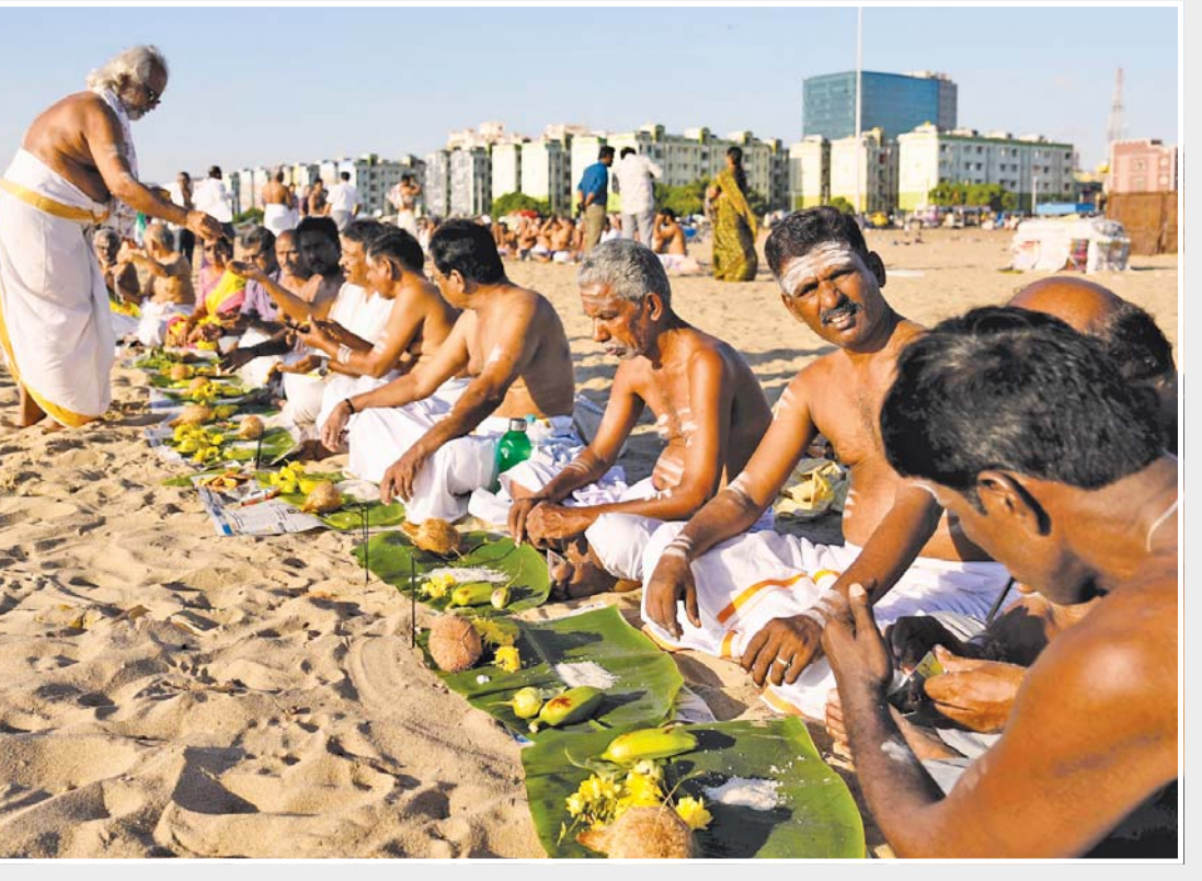
શ્રદ્ધા: એનઈના મરીના બીચ ખાતે બુધવારે પિતૃ પક્ષના અંતે 'મહાલય અમાવસ્યા' નિમિત્તે પૂર્વજો માટે 'પિતૃ કર્મ પૂજા' કરતા લોકો.

હોસ્પિટલોના જણાવ્યા અનુસાર ગાઝામાં અલગ-અલગ હુમલાઓમાં બે બાળકો સહિત અન્ય ૨૩ લોકો માર્યા ગયા હતા. ઈઝરાયલી સેનાએ હજુ સુધી આ મામલે કોઈ પ્રતિક્રિયા આપી નથી. સ્થાનિકોના મતે ઈઝરાયલે ભારે હુમલા કર્યા છે અને તેના સૈન્યએ ખાન યુનિસના ત્રણ વિસ્તારોમાં ઘૂસણખોરી કરી છે... 'ઘણા લોકો કાટમાળ નીચે દટાયા છે અને કોઈ તેમને બચાવી શક્યું નથી.' સ્થાનિક આરોગ્ય અધિકારીઓના જણાવ્યા અનુસાર, ઈઝરાયલના વળતા હુમલામાં ૪૧,૦૦૦ થી વધુ પેલેસ્ટિનિયનો માર્યા ગયા છે, જોકે તેઓએ જણાવ્યું નથી કે તેમાંથી કેટલા આતંકવાદીઓ હતા. તેમણે કહ્યું કે માર્યા ગયેલા લોકોમાં અડધાથી વધુ મહિલાઓ અને બાળકો હતાં. સેનાનું કહેવું છે કે તેણે ૧૭,૦૦૦થી વધુ આતંકવાદીઓને ઠાર કર્યા છે પરંતુ તેના કોઈ પુરાવા આપ્યા નથી.