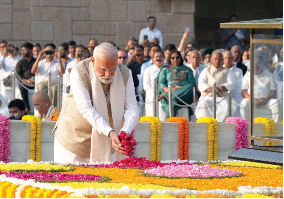
શ્રદ્ધાંજલિ: નવી દિલ્હીમાં રાજઘાટ ખાતે બુધવારે ગાંધી જયંતી નિમિત્તે ગાંધીજીને શ્રદ્ધાંજલિ આપતા વડા પ્રધાન નરેન્દ્ર મોદી.

નવી દિલ્હી: રાષ્ટ્રપતિ દ્રૌપદી મુર્મૂ અને વડા પ્રધાન નરેન્દ્ર મોદીએ રાષ્ટ્રપિતા મહાત્મા ગાંધી અને ભારતના બીજા વડા પ્રધાન લાલ બહાદુર શાસ્ત્રીને તેમની જન્મજયંતી નિમિત્તે શ્રદ્ધાંજલિ અર્પણ કરી હતી. રાષ્ટ્રપતિ મુર્મૂએ એક્સ પર જણાવ્યું કે હું તમામ નાગરિકો વતી રાષ્ટ્રપિતા મહાત્મા ગાંધીને તેમની ૧૫૫મી જન્મજયંતી પર મારી નમ્ર શ્રદ્ધાંજલિ અર્પણ કરું છું. તેણીએ અન્ય એક પોસ્ટમાં કહ્યું કે શાસ્ત્રીએ તેમના સમગ્ર જીવનમાં સાદગી, પ્રમાણિકતા અને દેશભક્તિના સર્વોચ્ચ આદર્શો રજૂ કર્યા હતા. તેમના મજબૂત નેતૃત્વ હેઠળ ભારતે આર્થિક, વ્યૂહાત્મક અને અન્ય સફળતાઓ હાંસલ કરી હતી. ચાલો તેમના જીવનમાંથી પ્રેરણા લઈએ અને એક મજબૂત ભારતનું નિર્માણ કરવાનો સંકલ્પ કરીએ. મુર્મૂએ હિન્દી પોસ્ટમાં કહ્યું કે હું ભૂતપૂર્વ વડા પ્રધાન લાલ બહાદુર શાસ્ત્રીને તેમની જન્મજયંતી પર મારી નમ્ર શ્રદ્ધાંજલિ અર્પણ કરું છું. મોદીએ એક્સ પર એક પોસ્ટમાં કહ્યું કે સત્ય, સદ્ભાવ અને સમાનતા પર આધારિત પુરુષ બાપુનું જીવન અને આદર્શ હંમેશાં દેશના લોકો માટે પ્રેરણાસ્ત્રોત રહેશે. મોદીએ ભારતના