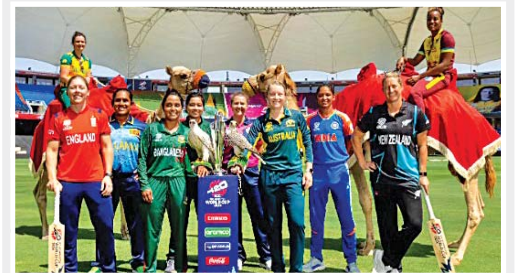
મહિલાઓના ટી-૨૦ વર્લ્ડ કપનો આજે આરંભ: યુએઈમાં આજે મહિલાઓનો ટી-૨૦ વર્લ્ડ કપ શરૂ થઈ રહ્યો છે અને એ નિમિત્તે આઈસીસીએ પોસ્ટ કરેલી તમામ ૧૦ ટીમની કેપ્ટનોવાળી તસવીર. આજે પ્રથમ મેંચ બાંગ્લાદેશ-સ્કોટલેન્ડ વચ્ચે બપોરે ૩.૩૦ વાગ્યાથી રમાશે. બીજી મેંચ સાંજે ૭.૩૦ વાગ્યાથી પાકિસ્તાન-શ્રીલંકા વચ્ચે રમાશે. ભારતની પ્રથમ મેંચ આપતી કાલે ન્યૂ ઝીલેન્ડ સામે સાંજે ૭.૩૦ વાગ્યાથી રમાશે.