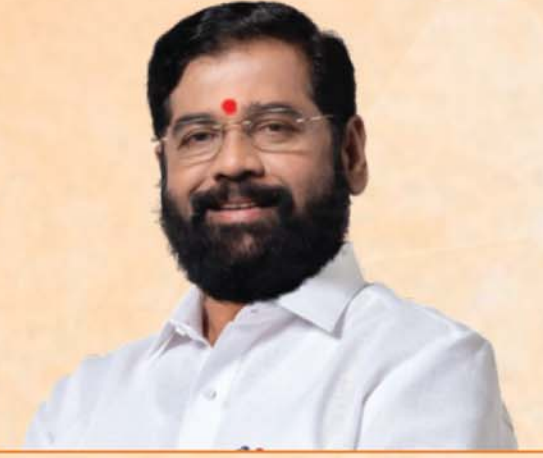
Eknath Shinde Chief Minister