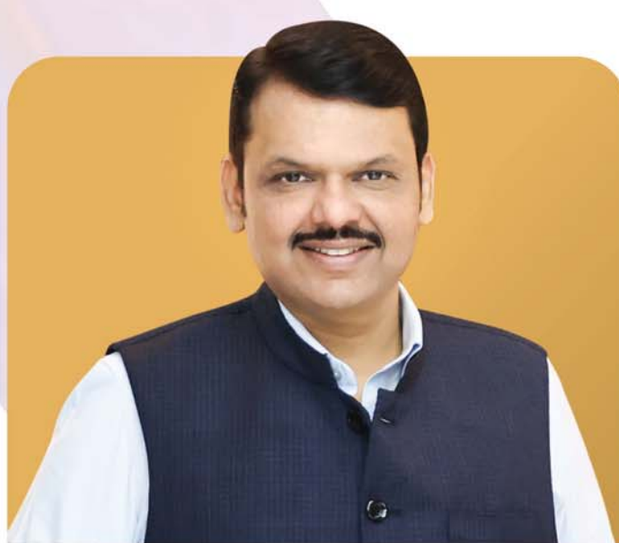
SHRI. DEVENDRA FADNAVIS HON'BLE DEPUTY CHIEF MINISTER, GOVERNMENT OF MAHARASHTRA