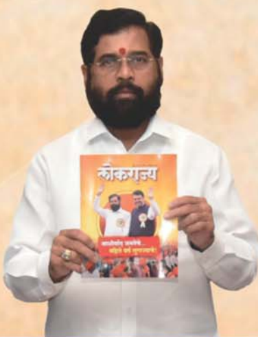
Eknath Shinde Chief Minister