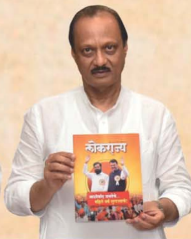
Ajit Pawar Deputy Chief Minister