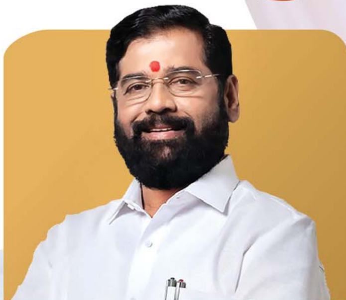
SHRI. EKNATH SHINDE HON'BLE CHIEF MINISTER, GOVERNMENT OF MAHARASHTRA