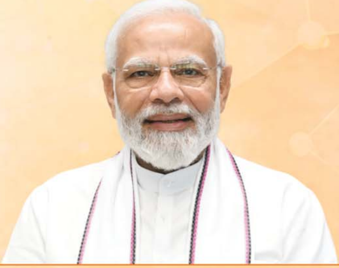
Narendra Modi Prime Minister