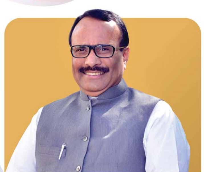
SHRI. ATUL SAVE HON'BLE MINISTER OF HOUSING, GOVERNMENT OF MAHARASHTRA