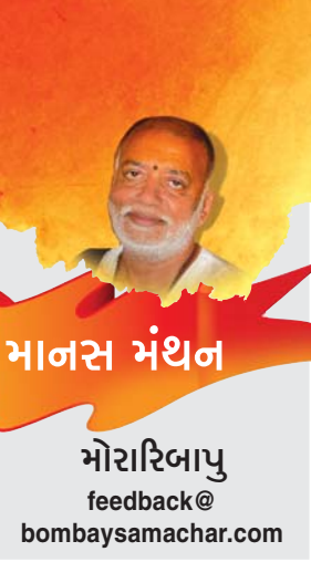
મનોરિભાવ feedback@ bombaysamachar.com

બંદઉ નામ રામ રઘુવર કો, હેતુ ક્રિસાનુ ભાનુ હિમકર કો, બિધિ હરિ હરમય બેદ પ્રાન સો, અગુન અનુપમ ગુન નિધાન સો. રઘુવરના અનેક નામ છે: એને કોઈ રાઘવ કહે, કોઈ રાઘવેન્દ્ર કહે, તુલસીજી કહે એ નામોને મારા પ્રણામ છે. પણ જે પ્રભા, વિષ્ણુ અને મહેશમય છે, વેદનો જે પ્રાણ છે, ઓમકાર સ્વરૂપ છે... એ રામતત્ત્વ- એ રામનામની વંદના કરતાં ગોસ્વામીજીએ નામ મહિમાનું મોટું પ્રકરણ લખ્યું છે. તુલસીજીએ એમ કહ્યું કે સત્યયુગમાં માણસ ધ્યાનથી પરમાત્માને જલદી પામતો હતો, ત્રૈતાયુગમાં એ જ ઈશ્વરને પામવા માટે યજ્ઞને પ્રધાન સાધન બતાવવામાં આવ્યું કે યજ્ઞ દ્વારા પામી શકાય. દ્વાપરમાં પૂજન-અર્ચનને પ્રધાનતા આપી કે પરમાત્માની પ્રાપ્તિ પૂજન-અર્ચનથી સુલભ. પણ કળિયુગમાં તો ગોસ્વામીજી કહે કે વેળ નામ આધાર છે. કળિયુગમાં કેટલા માણસો ધ્યાન કરી શકે ? હં...! મને લોકો મળતા હોય છે. એક ભાઈ મને કહે હું રાતના એક વાગે ધ્યાનમાં બેસું છું ને ત્રણ વાગે ઊભો થઈ છું. મને બહુ નવાઈ લાગી ! એક વાગે શરૂ થાય અને ત્રણ વાગે પૂરું થાય એ સમયની ખબર ધ્યાનમાં કેવી રીતે રહેતી હશે? ધ્યાન તો કાંતિ છે. ધ્યાનમાં કંઈ સમય હોઈ શકે કે તે આટલા વાગે શરૂ થાય અને આટલા વાગે પૂરું થાય? ધ્યાન જે કરી શકે, એમાં આગળ વધી શકે એ બધાને વંદન છે. રામનામ જપતાં જપતાં ક્યારેક ધ્યાન લાગી જશે ત્યારે આંખમાંથી આંસુમાં વહેશે. ઈસ લિએ નામ જપો. સામાન્ય માણસ માટે કળિયુગનું પ્રધાન સાધન હરિનામ આશ્રય, પરમાત્માનું નામ જ છે. કળિયુગમાં કેવળ રામનામ જ પ્રધાનતા