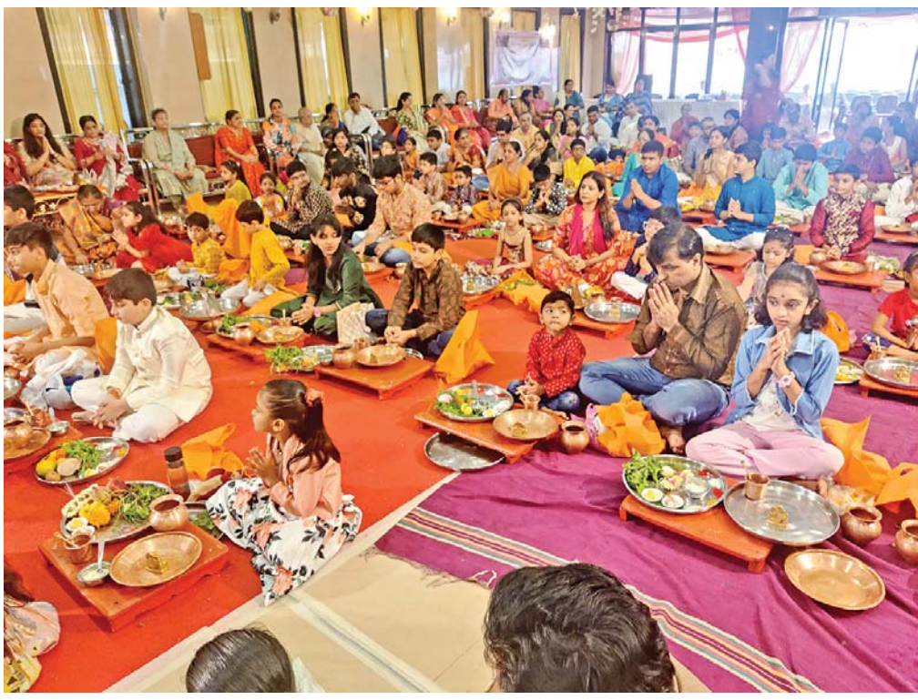
संस्कृतिनुं र्शियन... नवरात्री दरमिचान रविचारे विलेपार्ली (पूर्व)ना राजपुरिया बाग जाते १५ वर्षीय नाना जाणको माटे विशेष पूजा राजवामां आवी हती. जाणकोमां पण आपाणी संस्कृति प्रत्ये जाणपणथी भाव जागे अ हेतुथी योजायेली पूजांमां १२५ जाणके भाग लीघी हतो. (अमय पराडे)