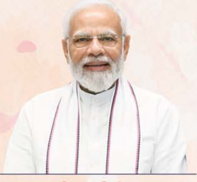
नरेन्द्र मोदी वडाप्रधान