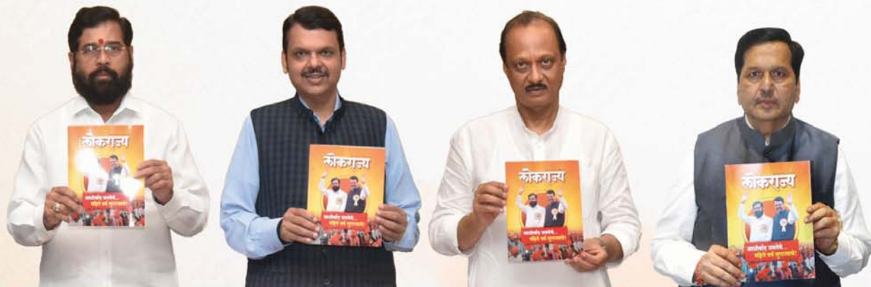
अकनाथ शिंदे मुध्यमंत्री