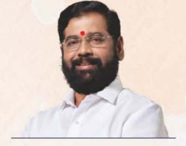
अकनाथ शिंदे मुध्यमंत्री

कौशल्य, रोजगार, उधमीता अने नाविन्यता विभाग, महाराष्ट्र सरकार