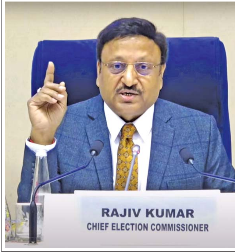
ચૂંટણી: દિલ્હીમાં મંગળવારે યોજાયેલી પત્રકાર પરિષદમાં મુખ્ય ચૂંટણી કમિશનર રાજીવકુમારે મહારાષ્ટ્ર અને ઝારખંડ વિધાનસભા ચૂંટણીના સમયપત્રકની જાહેરાત કરી હતી. મહારાષ્ટ્ર વિધાનસભા ચૂંટણી ૨૦ નવેમ્બરે તેમ જ ઝારખંડ વિધાનસભાની ચૂંટણી ૧૩ અને ૨૦ નવેમ્બરે એમ બે તબક્કામાં યોજાશે. બંનેનાં પરિણામ ૨૩મી નવેમ્બરે જાહેર કરવામાં આવશે. (એજન્સી)

ગઈ હતી. ઉત્તરાખંડમાં કેદારનાથ વિધાનસભા બેઠક, મહારાષ્ટ્રમાં નાંદેડ લોકસભા બેઠકની પેટાચૂંટણી ૨૦મી નવેમ્બરે યોજાશે, એમ મુખ્ય ચૂંટણી કમિશનર રાજીવકુમારે કહ્યું હતું. હરિયાણા ચૂંટણીને મામલે કોંગ્રેસ દ્વારા કરવામાં આવેલા આક્ષેપો અંગે બોલાતાં રાજીવકુમારે કહ્યું હતું કે વાસ્તવિકતાને આધારે ઈવીએમ અંગેની તમામ ૨૦ ફરિયાદના અમે જવાબ આપીશું. એકિઝટ પોલમાં અનેક વિકૃતિઓ જોવા મળે છે અને તેમણે આત્મમંથન કરવાની જરૂર છે, એમ તેમણે કહ્યું હતું. (એજન્સી)