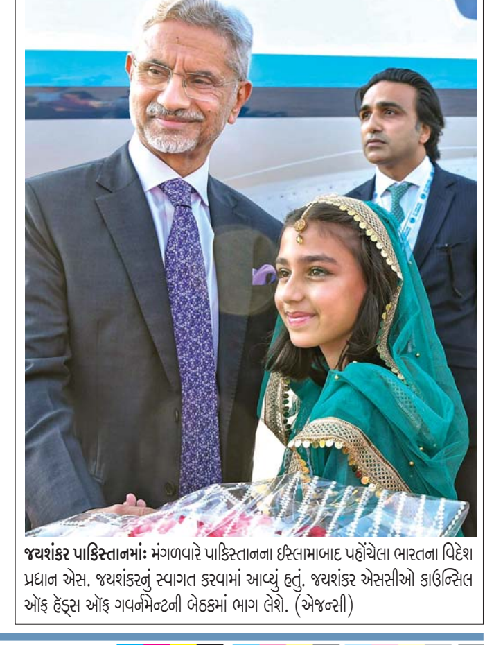
જયશંકર પારકિસ્ટાનમાં મંગળવારે પાકિસ્તાનના ઈસ્તામાબાદ પહોંચેલા ભારતના વિદેશ પ્રધાન એસ. જયશંકરનું સ્વાગત કરવામાં આવ્યું હતું. જયશંકર એસસીઓ કાર્ટેલિસ્ટ ઓફ હેડ્સ ઓફ ગવર્નમેન્ટની બેઠકમાં ભાગ લેશે.

વોશિંગ્ટન: કેનેડાના વડા પ્રધાન જસ્ટિન ટ્રુડોએ ભારત પર તેના રાજદ્વારીઓ અને સંક્રિંટ અપરાધનો ઉપયોગ કરીને તેના નાગરિકો પર હુમલો કરવા અને તેમને તેમની ધરતી પર અસુરક્ષિત કરવાનો આરોપ મૂક્યો છે, અને તેને નવી દિલ્હીની "મોટી ભૂલ" ગણાવી છે. ટ્રુડો દ્વારા સોમવારે આ ટિપ્પણી એવા દિવસે કરવામાં આવી હતી જ્યારે ભારતે છ કેનેડિયન રાજદ્વારીઓને હાંકી કાઢ્યા હતા અને શીખ ઉગ્રવાદી હરદીપસિંહ નિજજરની હત્યાની તપાસ સાથે રાજદ્વારને જોડતા એકાદવાના આક્ષેપોને સખત રીતે ફગાવી દીધા પછી કેનેડામાંથી તેના હાઈ કમિશનર અને અન્ય "લક્ષિત" અધિકારીઓને પાછા ખેંચવાની જાહેરાત કરી હતી. ભારતના વિદેશ મંત્રાલયે એક નિવેદનમાં જણાવ્યું હતું કે, ભારત વિરુદ્ધ ઉગ્રવાદ, હિંસા અને અલગતાવાદને ટ્રુડો સરકારના સમર્થનના જવાબમાં ભારત આગળ પગલાં લેવાનો અધિકાર અનામત રાખે છે. ૨૦૧૮ માં, તેમની ભારતની મુલાકાત, જેનો હેતુ વોટ બેંકની તરફેણ