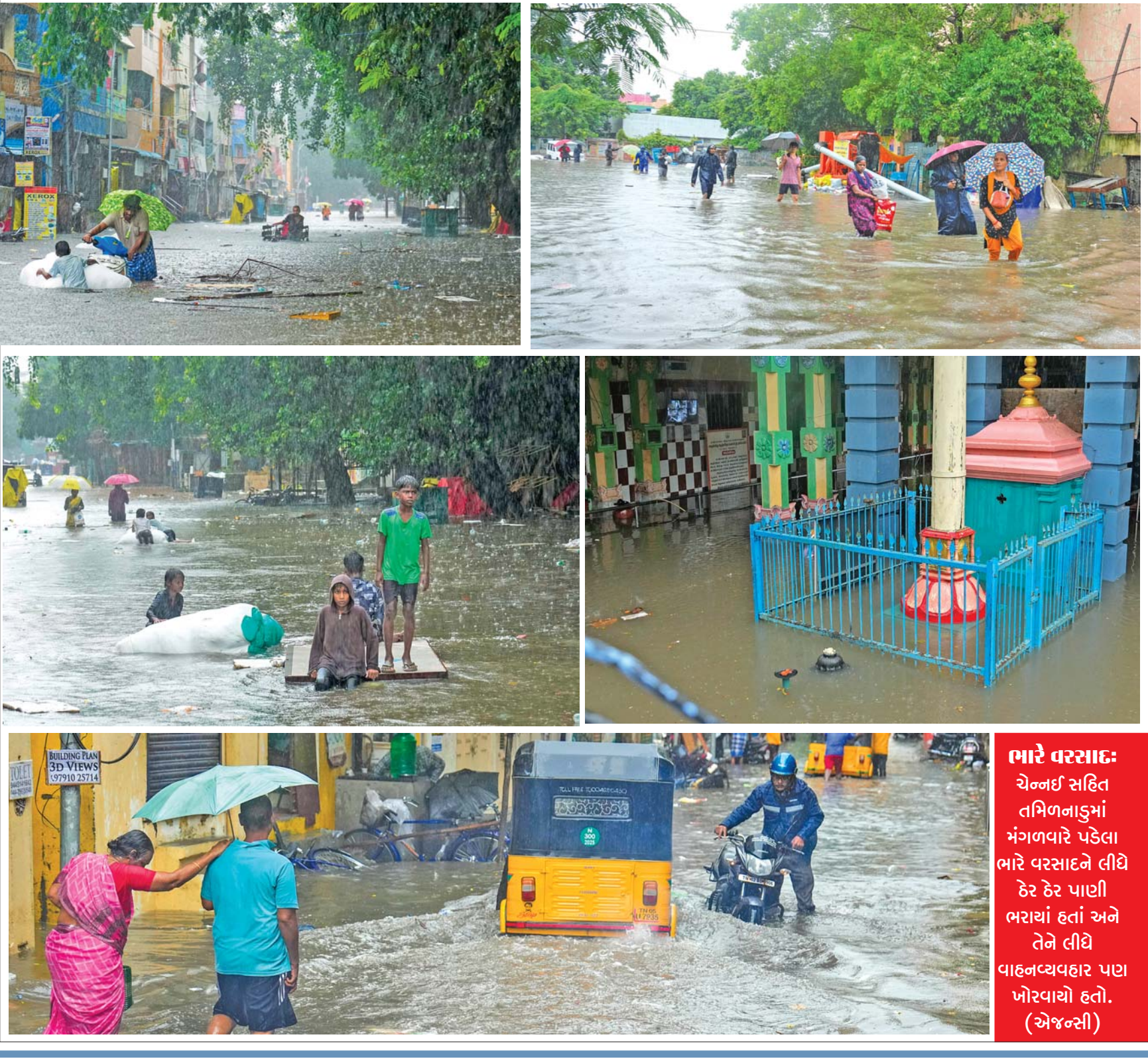
ભારે વરસાદ: ચેન્નઈ સહિત તમિળનાડુમાં મંગળવારે પડેલા ભારે વરસાદને લીધે ઠેર ઠેર પાણી ભરાયાં હતાં અને તેને લીધે વાહનવ્યવહાર પણ ખોરવાયો હતો.