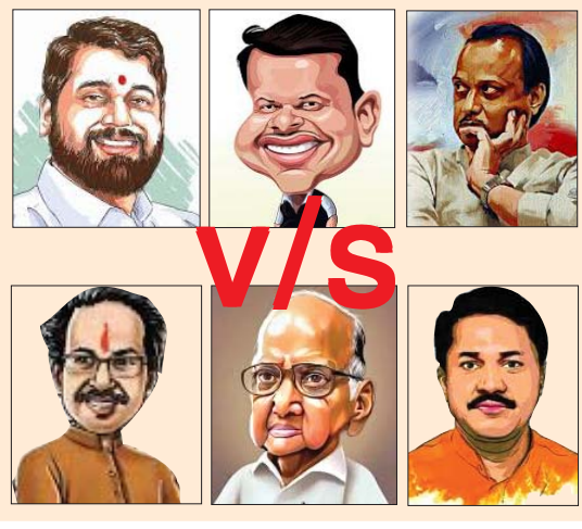
ઉત્તર પ્રદેશ (૪૦૩) પછીની બીજી સૌથી મોટી ૨૮૮ સભ્યોની વિધાનસભાની ચૂંટણી ૨૦ નવેમ્બરે એક જ તબક્કામાં યોજાશે અને મતગણતરી ૨૩ નવેમ્બરે થશે એવી જાહેરાત ચૂંટણી પંચે મંગળવારે કરી હતી.