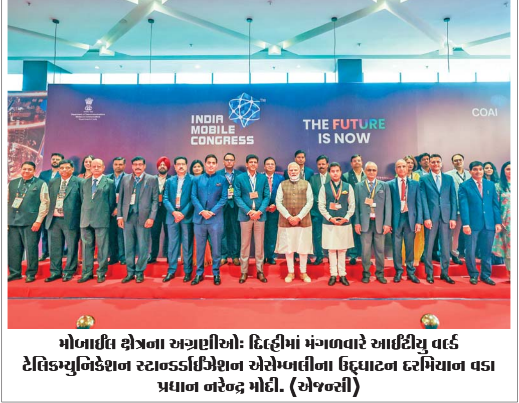
મોબાઈલ કોંગ્રેસના અગ્રણીઓ: દિલ્હીમાં મંગળવારે આઈટીયુ વર્લ્ડ ટેલિકોમ્યુનિકેશન સ્ટાન્ડર્ડાઈઝેશન એસોસિએશન ઉદ્ઘાટન દરમિયાન વડા પ્રધાન નરેન્દ્ર મોદી.

અને યાનમમાં મંગળવારે જોરદાર ચોમાસાની ગતિવિધિ જોવા મળી હતી અને જોરદાર વરસાદ પડ્યો હતો. ભારે વરસાદ સાથે રાજ્યના રાયલસીમા પ્રદેશ માટે સમાન હવામાન પેટર્નની આગાહી કરવામાં આવી છે. ડઝનેક સ્થળે ભારે વરસાદ પડ્યો હતો. નેલ્લોર જિલ્લાના કાવલીમાં ૧૫ સેમી વરસાદ નોંધાયો હતો, ત્યારબાદ અંદકી (બાપટલા) ૧૪ સેમી, કંદુકુર (નેલ્લોર) ૧૨ સેમી, યાનમ ૯ સેમી અને આત્મકુર (નેલ્લોર) ૮ સેમી વરસાદ નોંધાયો હતો. રાયલસીમા પ્રદેશમાંથી, વાયએસઆર કડપા જિલ્લાના કોડુરમાં ૧૦ સેમી વરસાદ નોંધાયો હતો, ત્યારબાદ સુલુર પેટા અને ગુદુર (તિરુમતિ) અનુક્રમે ૭ સેમી અને ૬ સેમી વરસાદ નોંધાયો હતો.