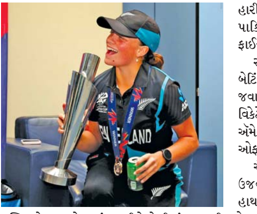
ઇન્ડિયાને પ્રથમ ટેસ્ટમાં હરાવીને શ્રેણીમાં ૧-૦ થી સરસાઈ લીધી હતી. એ સાથે, ભારતમાં ન્યૂ ઝીલેન્ડ ૩૬ વર્ષે ફરી ટેસ્ટ મેચ જીતવામાં સફળ થયું છે. એ રીતે ન્યૂ ઝીલેન્ડ માટે રવિવાર ડબલ સેલિબ્રેશનવાળો સુપર સન્ડે બન્યો હતો. મહિલા ટી-૨૦ વર્લ્ડ કપમાં ન્યૂ ઝીલેન્ડની ટીમ ભારત સામે જીત્યા બાદ ઓસ્ટ્રેલિયા સામે

દુબઈ: ન્યૂ ઝીલેન્ડની મહિલા ક્રિકેટરોએ રવિવારે અહીં પોતાના દેશને પહેલી જ વાર ટી-૨૦ વર્લ્ડ કપની ટ્રોફી અપાવી એટલે બેહુદ મુશ્કેલી હતી. વર્લ્ડ ચેમ્પિયન ટીમની કોઈ પ્લેયર ગિટાર પર ફેમસ સોંગ ગાતી હતી તો બીજી બાજુ ચાર-પાંચ ખેલાડીઓ ટોળે વળીને અભૂતપૂર્વ મજાક-મસ્તીનાં મૂડમાં જશન મનાવતી હતી. કોઈ પ્લેયર બિયર સાથે જીતનાં ઉત્સાહમાં હતી તો કોઈએ શ્રેણીબદ્ધ ગીતોથી ડ્રેસિંગ રૂમ ગજાવ્યું હતું. દુબઈમાં રવિવારે રાત્રે ન્યૂ ઝીલેન્ડની વિમેન્સ ટીમે ફાઇનલમાં સાઉથ આફ્રિકાને ૩૨ રનથી હરાવીને પહેલી વાર ટી-૨૦ વર્લ્ડ કપનો તાજ જીતી લીધો હતો. ટી-૨૦માં સાઉથ આફ્રિકાના પુરુષોની જેમ મહિલાઓ પણ ચોર્સ (છેલ્લી ઘડીએ પરાજિત થનાર) સાબિત થઈ. જૂનમાં મેન્સ વર્લ્ડ કપમાં રોહિત શર્માના સુકાનમાં રમનાર ભારતીય ટીમ સામેની ફાઇનલમાં સાઉથ આફ્રિકાનો પરાજય થયો હતો. રવિવારે એ પહેલાં, બેંગ્લુરુમાં ટોમ લેથમના સુકાનમાં ન્યૂ ઝીલેન્ડની મેન્સ ટેસ્ટ ટીમે ટીમ