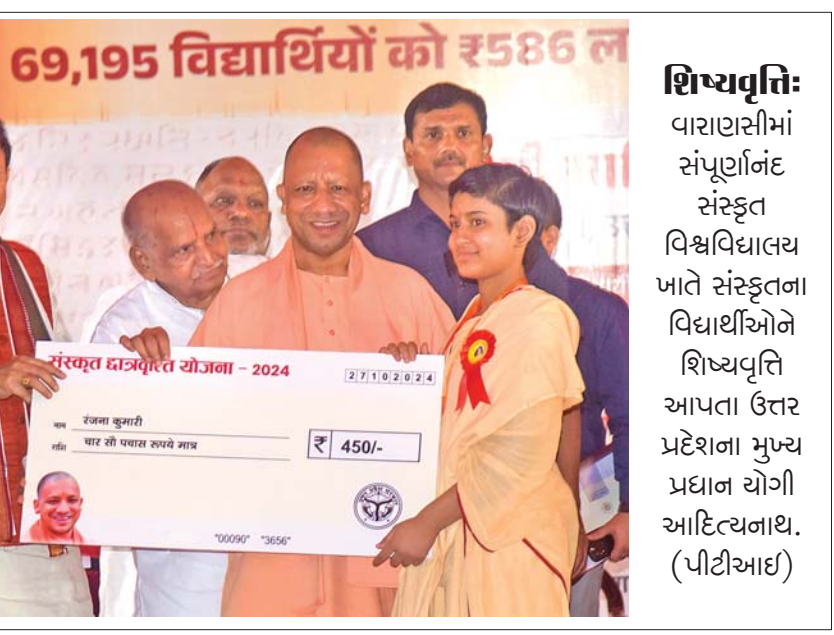
શિષ્યવૃત્તિ: વારાણસીમાં સંપૂર્ણાનંદ સંસ્કૃત વિશ્વવિદ્યાલય ખાતે સંસ્કૃતના વિદ્યાર્થીઓને શિષ્યવૃત્તિ આપતા ઉત્તર પ્રદેશના મુખ્ય પ્રધાન યોગી આદિત્યનાથ. (પીટીઆઈ)

વિદેશમાં નાણાં ટ્રાન્સફર કરવામાં આવતા હતા. આ તપાસમાં સામે આવ્યું છે કે કપિલ ડ્રગ સ્મગલર કબીર તલવારની નજીક છે. એનઆઇએ ૨૧ હજાર કરોડ રૂપિયાના ડ્રગ્સ સ્મગલિંગ કેસમાં કબીરની ધરપકડ કરવામાં આવી હતી. કબીરની દિલ્હીમાં ઘણી કલબ છે. કબીર ફોન સ્મગલિંગમાં પણ સામેલ હોઈ શકે છે. એન્ફોર્સમેન્ટ ડિરેક્ટોરેટ અને નેશનલ ઇન્વેસ્ટિગેશન એજન્સી આ કેસનો કબજો લઈ શકે છે કારણ કે તપાસમાં અનેક હવાલા ચેનલો અને ઉચ્ચ આંતરરાષ્ટ્રીય સંપર્કો બહાર આવ્યા છે.