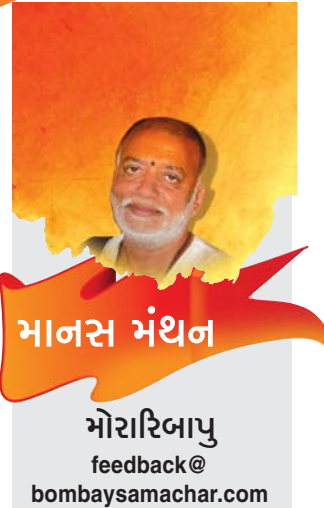
માનસ મંથન મોરારિબાપુ feedback@bombaysamachar.com

અર્થાત્ એમ માની શકાય કે જે દેખાયું છે, જે અનુભવાયું છે, જે સમજાયું છે તેની યથા સ્વરૂપની રજૂઆત એટલે સત્ય. બની શકે કે માનવીની મર્યાદાઓને કારણે સત્ય સંપૂર્ણતામાં છતું ન થયું હોય. જે વ્યક્તિની રંગ પારખવાની શક્તિ નબળી હોય તે વ્યક્તિ રંગની બાબતમાં જે 'સત્ય' કહે તે 'અસત્ય' પણ હોઈ શકે. આવા સંજોગોમાં સત્યની વ્યાખ્યા જટિલ બની રહે. અહીં કોઈનો અસત્ય કહેવાનો આશય નથી હોતો, તેથી અસત્ય કથન માફીને યોગ્ય છે. પરંતુ તેનાથી અસત્ય સત્યમાં પરાવર્તિત નથી થઈ જતું અને તેથી જ એમ માનવા મન પ્રેરાય છે કે સત્ય ક્યારેક વ્યક્તિની ક્ષમતાની બહારનો વિષય બની રહે. સત્ય વ્યક્તિ આધારિત ન હોઈ શકે. સત્ય સંજોગો આધારિત પણ ન હોઈ શકે. સત્ય સમયના બંધનમાં પણ ન બંધાય. સત્ય શાશ્વત છે, અખંડ છે, અલિપ્ત છે, નિર્દોષ છે. એમ માનવામાં આવે છે કે વિજ્ઞાન અને ગણિત સત્ય પર આધારિત છે. તત્ત્વજ્ઞાનના મૂળમાં સત્યની શોધની ઈચ્છા છે. આધ્યાત્મિક ક્ષેત્રમાં સત્ય એ મુક્તિ માટેનું સાધન ગણાય છે.