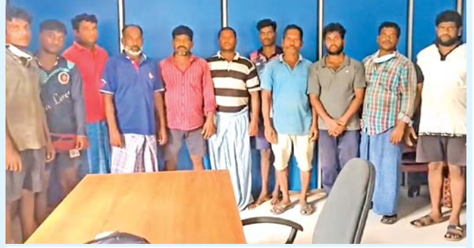
ધરપકડ: શ્રીલંકાની જળસીમામાં માછીમારી કરતા પકડાયેલા ભારતીય માછીમારો. શ્રીલંકાના નૌકાદળે ૧૨ માછીમારોને પકડીને તેઓની હોડી કબજે કરી હતી.

કિનારેથી જપ્ત કરવામાં આવ્યું હતું. પકડાયેલા ૧૨ માછીમારને ક્રેકસેથુરાઇ બંદર પર લઈ જવામાં આવ્યા હતા અને આગળની કાર્યવાહી માટે મલડી ફિશરીઝ ઇન્સ્પેક્ટરને સોંપવામાં આવશે. ઉલ્લેખનીય છે કે માછીમારોનો મુદ્દો ભારત અને શ્રીલંકા વચ્ચેના સંબંધોમાં એક વિવાદાસ્પદ મુદ્દો છે, જેમાં શ્રીલંકાના નૌકાદળના કર્મચારીઓએ પાલક સ્ટ્રેટમાં ભારતીય માછીમારો પર ગોળીબાર કર્યો અને શ્રીલંકાની જળસીમામાં ગેરકાયદેસર રીતે પ્રવેશ કરવાની અનેક કથિત ઘટનાઓમાં તેમની બોટ જપ્ત કરવાનો સમાવેશ થાય છે.