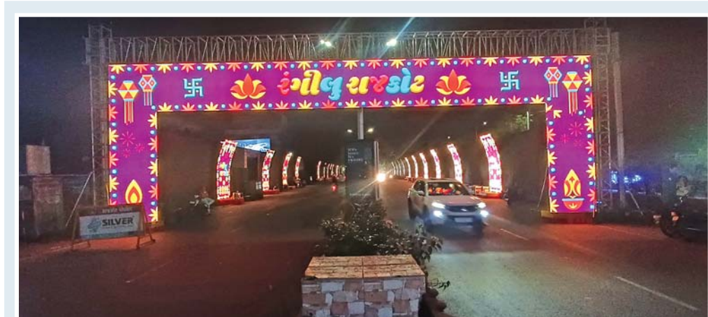
રાજકોટમાં દિવાળી કાર્નિવલની ઉજવણીનો ૨૭ ઓક્ટોબરથી આરંભ થયો હતો. શહેરમાં ૩૧ ઓક્ટોબર સુધી વિવિધ કાર્યક્રમો યોજાશે. રવિવારે કિસાનપરા ચોકમાં મનમોહક રોશનીનો શાણગાર કરવામાં આવ્યો હતો.

તેમ જણાવ્યું હતું. તેમણે જામનગરના જોડિયા તાલુકામાં વિવિધ સ્થળોએ ખેડૂતો તથા ગ્રામજનો સાથે બેઠક યોજી હતી. તેઓના સિંચાઈ, પાક ધોવાણ, પીવાના પાણીની સમસ્યા વગેરે બાબતોને લગતા પ્રશ્નો સાંભળ્યા હતા તેમ જ સત્વરે આ પ્રશ્નો અંગે કાર્યવાહી કરી તેનું નિરાકરણ લાવવામાં આવશે તેમ જણાવ્યું હતું. તેમણે ખેતીવાડી વિભાગના ઉપસ્થિત અધિકારીઓને ગામોનો સંપૂર્ણ સર્વે તકીદે પૂર્ણ કરી ખેડૂતોને યોગ્ય સહાય મળી રહે તે મુજબ કામગીરી હાથ ધરવા સૂચના આપી હતી. ઉલ્લેખનીય છે કે તાજેતરમાં રાજ્ય સરકારે જાહેર કરેલી સહાયનો ખેડૂતોએ વિરોધ કર્યો હતો અને હેક્ટર દીઠ મળતી સહાયને વિદ્યા દીઠ આપવા માટે રજૂઆત કરી હતી.