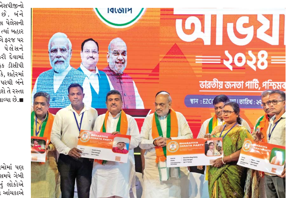
ભાજપનું સભ્યપદ: કોલકાતામાં ભાજપના સભ્યપદની ચુંબેશ વખતે કેન્દ્રના ગૃહ પ્રધાન અમિત શાહ અને ભાજપના નેતાઓ - મિથુન ચકવર્તી તેમ જ સુવેન્દુ અધિકારી.

ઢાકા: બાંગ્લાદેશમાં વિદ્યાર્થી આંદોલન બાદ દેશભરમાં ફાટી નીકળેલી હિંસા દરમિયાન હિંદુ સમુદાયના લોકો પર હુમલાની ઘટનાઓ બની હતી. શેખ હસીનાના રાજનામા અને વચગાળાની સરકાર રચાયા બાદ સીધા હુમલા ભલે ઓછા થયા હોય, પરંતુ બાંગ્લાદેશમાં હિંદુઓની મુશ્કેલીઓમાં ઘટાડો થયો નથી. બંગડાટ રાજકીય વાતાવરણમાં હિંદુઓ ભેદભાવ અને ધમકીઓનો સામનો કરી રહ્યા છે. અહેવાલ મુજબ, બાંગ્લાદેશમાં હિંદુઓ માત્ર ભેદભાવનો જ નહીં પરંતુ શારીરિક હિંસાથી માંડીને સામાજિક બહિષ્કાર સુધીની ધમકીઓનો પણ સામનો કરી રહ્યા છે. આ સાથે તેમને બદનામ કરવા માટે વિવિધ પ્રકારના અભિયાનો ચલાવવામાં આવી રહ્યાં છે. શેખ હસીનાની હકાલપટ્ટી બાદ પાંચમી ઓગસ્ટના નોબેલ શાંતિ પુરસ્કાર વિજેતા મોહમ્મદ યુનુસની આગેવાની હેઠળ વચગાળાની સરકારે સત્તા સંભાળી. આ પછી પણ દેશમાં કટ્ટરવાદી જૂથો દ્વારા ધાર્મિક લઘુમતીઓ સામે હિંસા અને ભેદભાવની ઘટનાઓ બની છે. મીડિયા રિપોર્ટ્સ અનુસાર, ચિત્તાગોંગ યુનિવર્સિટીના ઈતિહાસ વિભાગના આસિસ્ટન્ટ પ્રોફેસર રોન્ટુ દાસને કથિત રીતે રાજનામું આપવાની ફરજ પાડવામાં આવી હતી. આ સિવાય તેમને જાનથી મારી નાખવાની ધમકીઓ પણ આપવામાં આવી હતી. હિન્દુ સમુદાયના લોકો દાવો કરી રહ્યાં છે કે બાંગ્લાદેશમાં હિન્દુઓ વિરુદ્ધ દુસ્મનાવટનું વાતાવરણ બનાવવામાં આવી રહ્યું છે. જેના કારણે હિંદુઓ તેમની નોકરી અને અન્ય તકી ગુમાવી રહ્યા છે.