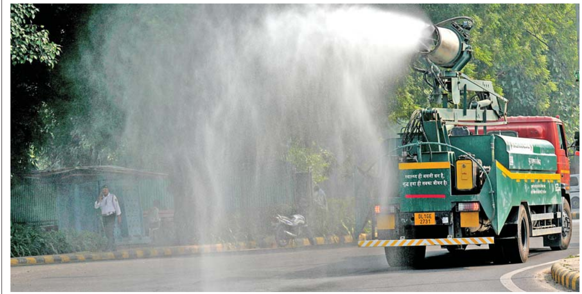
પ્રકૃપણ: દેશની રાજધાની નવી દિલ્હીમાં હવાનું પ્રદૂષણ ઘટાડવા 'એન્ટિ-રમોગ ગન'થી ઘઈ રહેલો છંટકાવ. અહીં શિયાળામાં, ખાસ કરીને દિવાળીના સમયે હવાનું પ્રદૂષણ ઘણું જ વધી ગયું છે.

આંચકો અનુભવાયો છે. ખાંભાના તાતણીયા ગામમાં આવેલા હીરાના કારખાનામાં કામ કરતા કારીગરો ગભરાઈને બહાર દોડી આવ્યા હતા, જેના સીસીટીવી ફૂટેજ સોશિયલ મીડિયા પર વાયરલ થયા હતા. રાજકોટ જિલ્લાના જેતપુર વિસ્તારમાં પણ ધરતીકંપનો આંચકો અનુભવાયો હતો, તે ઉપરાંત ગીર સોમનાથ જિલ્લાના ગીર ગઢડા અને