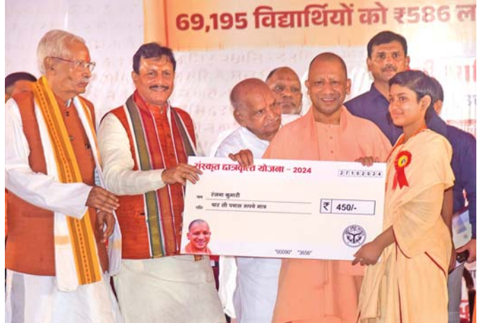
શિષ્યવૃત્તિ: વારાણસીમાં સંપૂર્ણાનંદ સંસ્કૃત વિશ્વવિદ્યાલય ખાતે સંસ્કૃતના વિદ્યાર્થીઓને શિષ્યવૃત્તિ આપતા ઉત્તર પ્રદેશના મુખ્ય પ્રધાન યોગી આદિત્યનાથ.

વારાણસી: ઉત્તર પ્રદેશના મુખ્ય પ્રધાન યોગી આદિત્યનાથે રવિવારે કહ્યું હતું કે સંસ્કૃત એ માત્ર ભગવાનની ભાષા નથી પરંતુ તે વિજ્ઞાનની ભાષા પણ છે, જે કમ્પ્યુટર સાયન્સ અને આર્ટિફિશિયલ ઇન્ટેલિજન્સ (એઆઇ) જેવી આધુનિક ટેકનોલોજીમાં ઉપયોગી છે. યોગીએ અહીંની સંપૂર્ણાનંદ સંસ્કૃત યુનિવર્સિટીમાંથી રાજ્યના સંસ્કૃત ભાષાના વિદ્યાર્થીઓ માટે શિષ્યવૃત્તિ યોજના શરૂ કરી હતી. આ પ્રસંગે રાજ્યના ૬૯,૧૯૫ સંસ્કૃત વિદ્યાર્થીઓને શિષ્યવૃત્તિના વિતરણની શરૂઆત કરતી વખતે મુખ્ય પ્રધાને રાજ્યભરમાં ગુરુકુળ પદ્ધતિની નિવાસી સંસ્કૃત શાળાઓ ફરીથી શરૂ કરવાનો સંકલ્પ લીધો હતો.