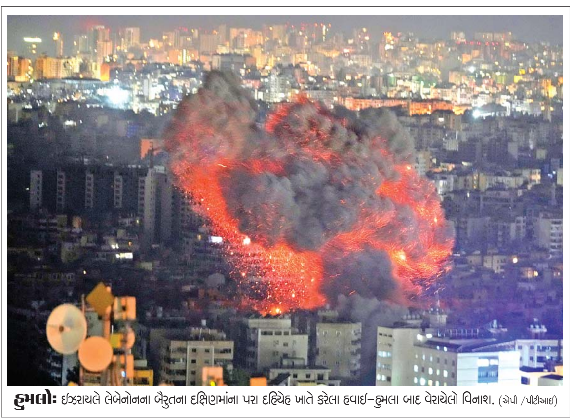
હુમલો: ઇસ્રાયેલે તેબેનેગના બેરુતના દક્ષિણમાંના પરા દહિયેહ ખાતે કરેલા હવાઈ-હુમલા બાદ વેરાયેલો વિનાશ.

મોદીએ જણાવ્યું હતું કે ભારત મોબાઇલ ફોનના વિશ્વમાંના સૌથી મોટા ઉત્પાદકોમાંનું બીજું રાષ્ટ્ર બની ગયું છે. લઘુમૂલ્યે એનિમેશન સૌથી મોટું દુરબીન 'ઇમેજિંગ ટેલિસ્કોપ એમએસીઈ'નું ચાલુ મહિને ઉદ્ઘાટન કરાયું હતું. તેમણે તહેવારોની મોસમમાં સ્થાનિક વેપારીઓ, દુકાનદારો, ઉત્પાદકો પાસેથી જ સ્વદેશી ચીજો ખરીદી કરવા અનુરોધ કર્યો હતો. વડા પ્રધાને જણાવ્યું હતું કે દેશ સરદાર વલ્લભભાઈ પટેલની ૧૫૦મી જન્મજયંતી ૩૧ ઓક્ટોબરથી અને ભગવાન બિરસા મુંડાની જન્મજયંતી ૧૫ નવેમ્બરથી ઊજવવાનું શરૂ કરશે. તેમણે જણાવ્યું હતું કે સરદાર વલ્લભભાઈ પટેલની ૩૧ ઓક્ટોબરની જન્મ જયંતી દિવાળીને દિવસે હોવાથી ૨૮ ઓક્ટોબરે 'રન ફોર યુનિટી' યોજાશે. (એજન્સી)