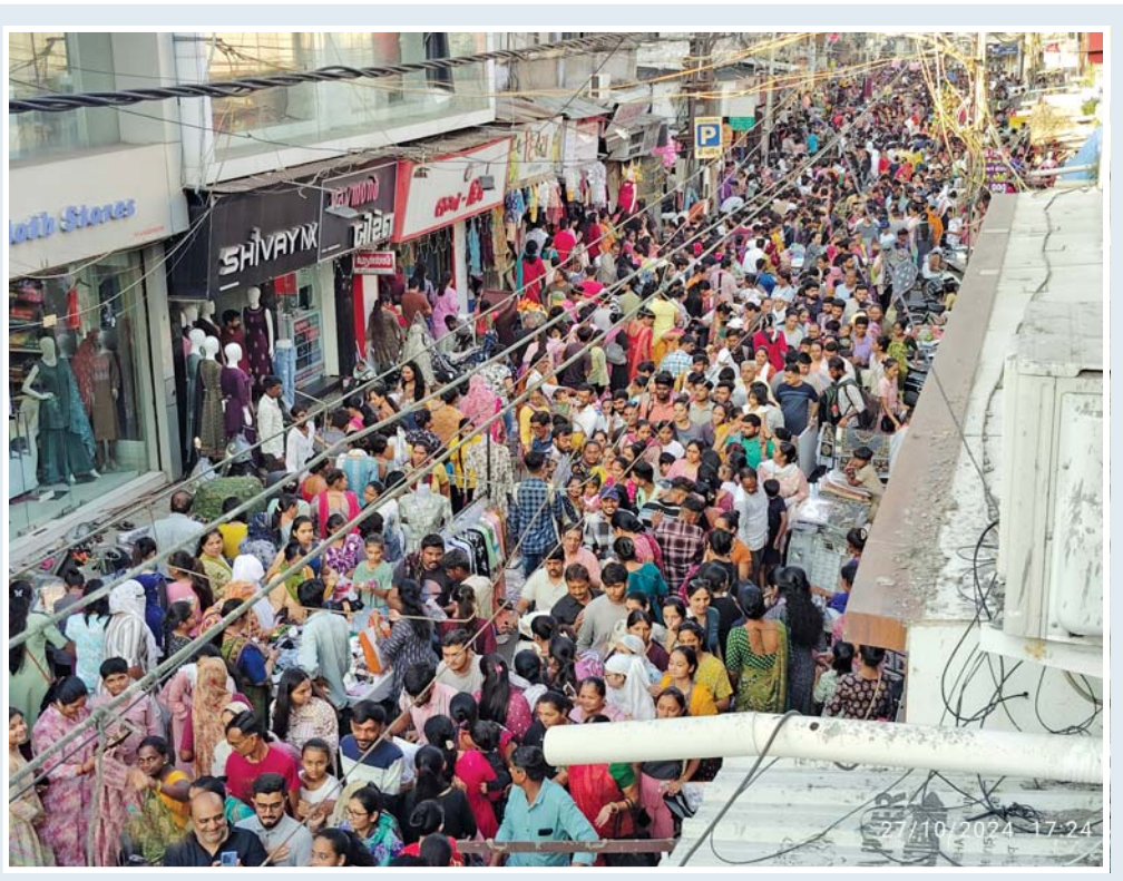
રાજકોટમાં દિવાળીના તહેવારની રંગેરંગે ઉજવણી શરૂ થઈ ગઈ છે. શહેરના બજારોમાં ખરીદી માટે લોકોની ભીડ જોવા મળી રહી છે. રવિવારે સાંજે ધર્મેન્દ્ર રોડ પર મોટી સંખ્યામાં લોકો દિવાળીની ખરીદી કરવા માટે ઉમટ્યા હતા.

સૌરાષ્ટ્ર કચ્છના કોંગ્રેસના નેતાઓ તેમજ કાર્યકર્તાઓ સાથે બેઠકોનો દૈર ચાલી રહ્યો હોવાનું જણાવ્યું હતું તેમ જ બૃથ લેવલના કાર્યકરો સાથે મુલાકાત કરતા તેમાં ઘણા ઊર્જાવાન કાર્યકરો જોવા મળ્યા હોવાથી આગામી સમયમાં આવા કાર્યકરોને મહત્વની જવાબદારી અપાય એવા સંકેતો આપ્યા હતા.