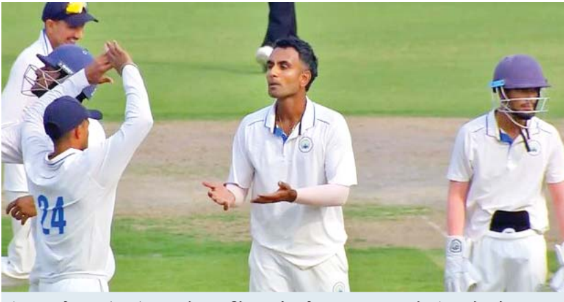
પંજાબ-હરિયાણા મેચમાં ગઈ કાલે ૧૫ વિકેટ પડી. હરિયાણાના ૧૧૪ સામે પંજાબનો સ્કોર ૯૦/૫