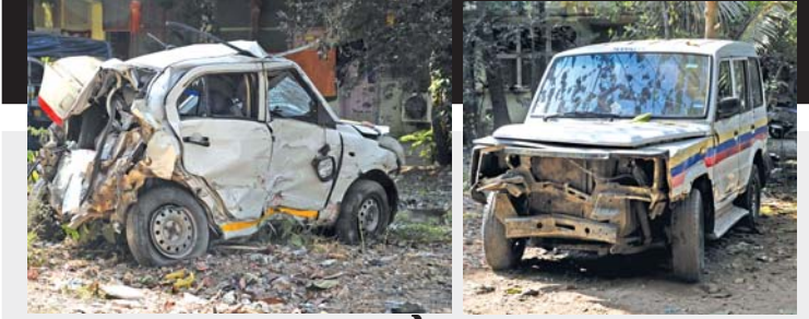
હાલબેહાલ: કુર્લામાં સોમવારે રાત્રે બેસ્ટ બસે કરેલા ભીષણ અકસ્માતમાં ઈજાગ્રસ્ત થયેલી વ્યક્તિ હોસ્પિટલમાં સારવાર હેઠળ જ્યારે અકસ્માતમાં કચરચાણ વળી ગયેલાં વાહનો. (અમચ ખરાડે)