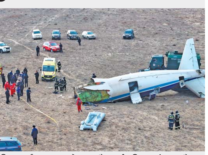
વિમાન દુર્ઘટના : બુધવારે અઝરબૈજાનથી રશિયા જતું અઝરબૈજાન એરલાઈન્સનું વિમાન એમ્બ્રેજર ૧૯૦ ખઝાકસ્તાનના અકતો હવાઈમથકેની નજીકના મેદાન પર તૂટી પડ્યું હતું. તસવીરમાં વિમાનના અવશેષો દેખાય છે.

વિમાન અગાઉથી નિર્ધારિત કર્યા મુજબ અઝરબૈજાનની રાજધાની બાકુથી રશિયાના નોર્થ કોકાસસના ગ્રાન્ડી શહેર જવાનું હતું. સોશિયલ મીડિયા પર વાઈરલ થયેલા વીડિયોમાં વિમાને ઝડપથી ઉતરાણ કર્યું હતું અને જમીન સાથે ટકરાયા બાદ આગના ગોળામાં ફેરવાઈ