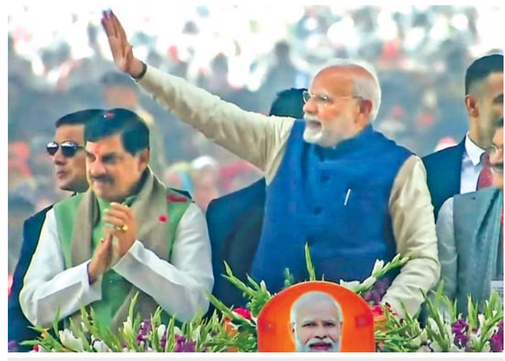
નદીઓ જોડવાની યોજના : વડા પ્રધાન નરેન્દ્ર મોદીએ મુખ્ય પ્રધાન મોહન યાદવ સાથે મધ્ય પ્રદેશના ખજુરાહો ખાતે કેન-બેતવા રિવર લિન્કીંગ પ્રોજેક્ટનો શિલાન્યાસ કર્યો હતો. આ દરમિયાન તેમણે ભૂતપૂર્વ વડા પ્રધાન અટલ બિહારી વાજપેયીને તેમની જન્મજયંતી નિમિત્તે અંજલી આપી હતી.

ખજુરાહો (મ.પ્ર.): મધ્ય પ્રદેશમાં બે નદી (કેન-બેતવા)ને જોડવાના પ્રકલ્પનું લોકાર્પણ કરતાં વડા પ્રધાન નરેન્દ્ર મોદીએ બુધવારે આશ્પે કર્યો હતો કે દેશના જળસ્રોતોના વિકાસમાં ડૉ. બાબાસાહેબ આંબેડકરે આપેલા યોગદાનની કોંગ્રેસે અવગણના કરી હતી.