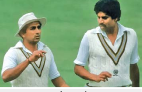
સુનીલ ગાવસ્કર અને કપિલ દેવ (બીસીસીઆઇ)

વિજય મેળવ્યા હતા. હવે મુખ્ય વાત પર આવીએ તો રોહિતે ગઈ કાલે સિડનીની છેલ્લી ટેસ્ટમાંથી પોતાને બહાર રાખ્યો (કે પછી તેને સ્વૈચ્છિક રીતે રેસ્ટ લેવાનું આડકતરી રીતે દબાવવામાં આવ્યું). જે કંઈ હોય, પણ ટેસ્ટના આ બે દિવસોના આવાના દિવસોમાં ટેસ્ટ-કરીઅર પર પડદો પાડી દેવાના હશે તો અત્યારે તેમનો કપરો કાળ ચાલી રહ્યો છે. ફોર્મ ગુમાવી બેસવા બદલ અને મોટા શોટ સિલેક્શનને લીધે (ખાસ કરીને વિરાટના કિસ્સામાં) ટીકાઓનો તેમના પર વરસાદ વરસી રહ્યો છે, તેમની બ્રેન્ડને પણ અસર થઈ રહી છે અને જે કરોડો ક્રિકેટપ્રેમીઓને તેમના પર માન હતું એ થોડું ઓછું થઈ ગયેલું જણાય છે. રોહિતના નામે ૧૧૬ ટેસ્ટ ઇનિંગ્સમાં ૧૨ સેન્યુરી અને ૧૮ હાફ સેન્યુરીની મદદથી બનેલા ૪,૩૦૧ રન છે. બીજા બાજુ, વિરાટના નામે ૨૦૯ ટેસ્ટ ઇનિંગ્સમાં ૩૦ સેન્યુરી અને ૩૧ હાફ સેન્યુરી સાથે બનેલા ૯,૨૨૪ રન છે. જે ઓ પર્સિંગ બેટરે (રોહિતે) ટેસ્ટ કારકિર્દીની