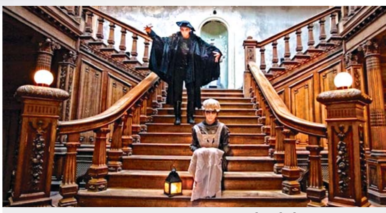
ભૂત બંગલા: અહીં ભૂત-ડાકણ આ રીતે પ્રગટે છે

બેર, આવા ફિલ્મી 'અત્મ આત્મા'ની દુનિયામાંથી બહાર આવીએ તો બહારના જગતમાં ભૂત-પ્રેતના ખોફની વાતો પણ એટલી જ રસપ્રદ છે. ભૂત શબ્દ જેટલો રોમાંચક છે એટલો જ ભયાનક છે. અગમનિગમની દુનિયામાં ભૂત-પ્રેત-પિશાચ જેવાં પાત્રોનું અસ્તિત્વ છે કે નહીં એ જબરા મત-મત્તાતરનો વિષય છે, પણ ભૂત-ડાકણના મહેલ-બંગલા-હવેલીની કથા ડરામાણી હોવા છતાંય જબરી મજેદાર હોય છે. એમાં મર-મિસ્ટ્રી-હોરર જેવાં લોકપ્રિય કથાનાં બધાં જ તત્ત્વ ઠાંસોઠાંસ ભરેલાં હોય છે. જગતનાં એવાં કેટલાંય સ્થળો છે, જે ત્યાં