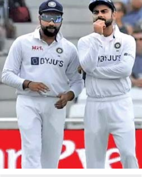
રોહિત શર્મા તથા વિરાટ કોહલી

પહેલી બે ઇનિંગ્સમાં સદી ફટકારી હોય (૨૦૧૩માં વેસ્ટ ઇન્ડિઝ સામે ૧૭૭ રન અને ૧૧૧ અણનમ) અને જે બેટરે (વિરાટે) સચિન જેવા ક્રિકેટિંગ-ગોડના પણ વિક્રમો તોડ્યા હોય તેમને જો શાનથી કરીઅરને ગુડબાય કરવા નહીં મળે તો ઘણાને દુઃખ થશે. રવિચન્દ્રન અશ્વિન જેવા દિવસોના ઓફ-સ્પિનરે તાજેતરમાં જ ટીમમાં થતી અવગણના બદલ રિસાઈને ઓર્થિનું રિટાયરમેન્ટ લઈ લીધું એવું રોહિત અને વિરાટના કિસ્સામાં ન બને એવી પ્રાર્થના કરીએ. અગાઉના દિવસોના મોટા ભાગે વ્યક્તિગત રીતે ટેસ્ટના ફલક પરથી વિદાય જોવા મળી હતી, પણ રોહિત અને વિરાટની વિદાય જાણે સાગમટે થઈ રહી હોય એવું લાગી રહ્યું છે. રોહિત અને વિરાટ ટેસ્ટ માટે જરૂરી પાછા ફોર્મમાં ન આવે તો પણ તેમના માટે ભવ્ય ફેરવેલ રાખવામાં આવે એવું તેમના કરોડો ચાહકો ઇચ્છતા હશે. ■