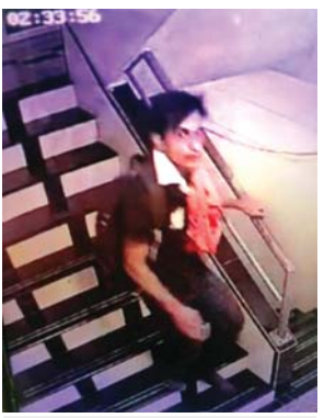
સીસીટીવી ફૂટેજમાં ઝડપાયેલો હુમલાખોર

(અમારા પ્રતિનિધિ તરફથી) મુંબઈ: બોલીવૂડને હયમચાવી મુકતી બાન્દ્રામાં બનેલી ઘટનામાં ફલેટમાં ઘૂસેલા હુમલાખોરે અભિનેતા સૈફ અલી ખાન પર છરીથી હુમલો કરતાં પહેલાં એક કરોડ રૂપિયાની માગણી કરી હોવાનું તપાસમાં સામે આવ્યું હતું. હુમલાખોર સરળતાથી ૧૨ મા માળે જઈને પાછો રુક્યુકર થઈ ગયો હોવાથી પોશ ઈમારતની સુરક્ષાવ્યવસ્થા સામે સવાલ ઊભો થયો હતો. બીજી બાજુ, ફોરેન્સિકની ટીમે ઘટનાસ્થળેથી ફિંગરપ્રિન્ટ્સ લીધા હોવાનું સૂત્રોએ જણાવ્યું હતું. પોલીસના જણાવ્યા મુજબ બાન્દ્રા પશ્ચિમમાં આવેલી સતગુરુ શરણના ૧૧ થી ૧૪ માળ (જુઓ પાનું ૪) >>