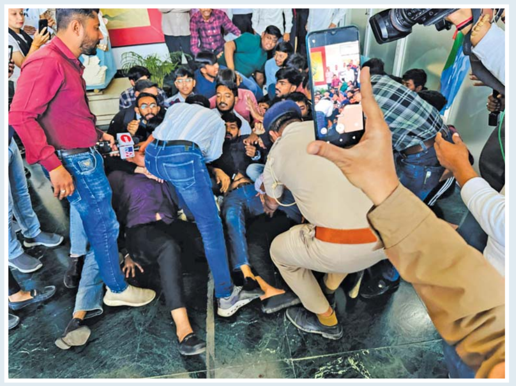
રાજકોટમાં આવેલી એસએનકે સ્કૂલની વિદ્યાર્થીનીઓ વીડિયો વાઈરલ થયા બાદ એનએસયુઆઈએ સ્કૂલમાં જોરદાર વિરોધ પ્રદર્શન કર્યું હતું. બાદમાં કાર્યકર્તાઓની પોલીસ દ્વારા અટકાયત કરવામાં આવી હતી.

ઠંડીની અનુભૂતિ થાય છે તેથી હજુ સત્તાવાર રીતે શિયાળાને વિદાય લીધી નથી. કચ્છના નલિયા ખાતે આજે લઘુત્તમ તાપમાન ૧૦ ડિગ્રી સે. રહેવા પામ્યું હતું જ્યારે ભુજમાં ૧૬ ડિગ્રી સે. રહેવા પામ્યું હતું. શિયાળાએ વહેલી વિદાય લેવી શરૂ કરી હોય તેવું હાલ લાગી રહ્યું છે, પણ આગામી ઉનાળાની ગરમી રેશાન કરનારી બની રહેશે તે બાબત નક્કી છે.