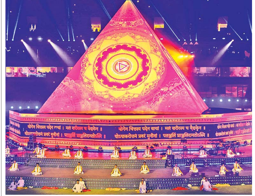
રાષ્ટ્રીય રમતોત્સવના રોમાંચ પહેલાં શાનદાર શુભારંભ: ઉત્તરાખંડમાં મંગળવારે વડા પ્રધાન નરેન્દ્ર મોદીએ ૩૮મા રાષ્ટ્રીય રમતોત્સવનું શાનદાર સમારોહમાં ઉદ્ઘાટન કર્યું હતું (એકદમ ઉપર). આ સમારંભમાં કલાકારોએ પોતાની કળાનું પ્રદર્શન કર્યું હતું અને એમાં યોગ આદારિત શો (ઉપર) પણ યોજાયો હતો.