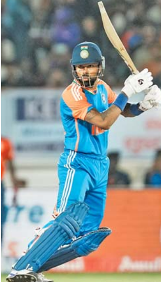
હાર્દિકે એક કલાકની ઇનિંગ્સમાં ૩૫ બૉલમાં ૪૦ રન બનાવ્યા હતા.

ભારત સિરીઝમાં ૨-૧ થી આગળ છે. ચોથી મેચ શુક્રવારે પુણેમાં અને છેલ્લી મેચ રવિવારે વાનખેડેમાં રમાશે.