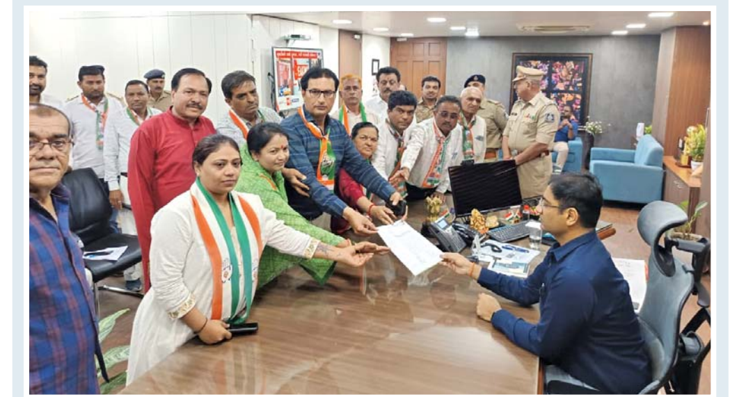
રાજકોટમાં મકાનોનું ડિમોલીશન કરતાં પહેલાં પીડિત પરિવારોને વૈકલ્પિક જગ્યા આપવા બાબતે મ્યુનિ. કમિશનરને રજૂઆત કરવામાં આવી હતી.

તેમણે જણાવ્યું કે સારણ લિંક પાઈપલાઈનનું કામ આશરે રૂ.૭૨૦.૦૦ કરોડના ખર્ચે હાથ ધરાઈ છે. જેમાં બે પમ્પિંગ સ્ટેશન તથા ૭૨ કી.મી. પાઈપલાઈનની કામગીરી થઈ રહી છે, જેનાથી રાપર તાલુકાનાં ૮ ગામના ૨૯૦૦૦ હેક્ટર વિસ્તારને લાભ મળશે. આ યોજના અંતર્ગત અંદાજિત રૂ.૨૦૨૯.૦૦ કરોડના ખર્ચે ૬ પમ્પિંગ સ્ટેશન અને ૧૫૮ કી.મી. પાઈપલાઈનની કામગીરી કરવામાં આવી રહી છે. જેનાથી મુન્દ્રા, ભુજ, માંડવી અને અંજાર તાલુકાનાં ૪૭ ગામના ૩૮,૮૨૪ હેક્ટર વિસ્તારને અને ૨૫ સિંચાઈ યોજનાઓને તેનો લાભ મળશે. જ્યારે નોર્થન લિંક પાઈપલાઈનના પ્રથમ તબક્કામાં અંદાજિત રૂ. ૧૪૧૯ કરોડના ખર્ચે ચાર પમ્પિંગ સ્ટેશન અને ૧૦૬ કી.મી. પાઈપલાઈનની કામગીરી કરવામાં આવી રહેલ છે. જેનાથી ભુજ અને નખત્રાણ તાલુકાનાં ૨૨ ગામોના ૩૬,૩૮૨ હેક્ટર વિસ્તારની ૧૨ સિંચાઈ યોજનાઓને લાભ મળશે. સર્વન લિંક પાઈપલાઈનના બીજા તબક્કામાં અંદાજિત રકમ રૂ. ૧૩૬૮.૦૦ કરોડના ખર્ચે ૮ પમ્પિંગ સ્ટેશન અને ૨૧૨ કી.મી. પાઈપલાઈનની કામગીરી થઈ રહી છે, જેનાથી માંડવી, નખત્રાણ, લખપત અને અબડાસા તાલુકાનાં ૨૮ ગામના ૩૬,૫૧૪ હેક્ટર વિસ્તારને લાભ થશે. જેમાં ૨૮ સિંચાઈ યોજનાઓનો સમાવેશ થાય છે, જ્યારે નોર્થન લિંક પાઈપલાઈનના બીજા તબક્કામાં અંદાજિત રૂ. ૮૪૮.૦૦ કરોડના ખર્ચે પાંચ પમ્પિંગ સ્ટેશન અને ૧૨૦ કી.મી. પાઈપલાઈનની કામગીરી હાથ ધરવામાં આવી રહેલ છે. જેનાથી નખત્રાણ અને લખપત તાલુકાનાં ૨૫ ગામના ૩૧,૬૮૧ હેક્ટર વિસ્તારને લાભ મળશે. જેનાથી ૧૩ સિંચાઈ યોજનાને લાભ મળશે.