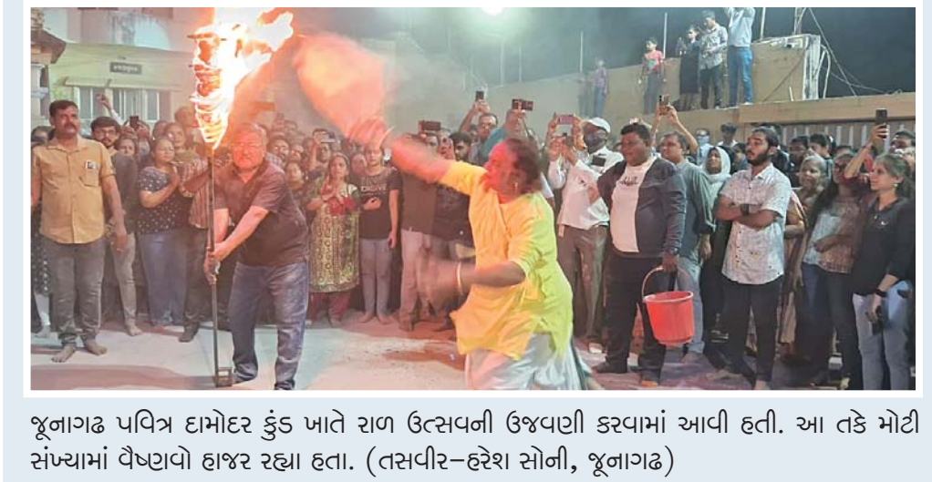
જૂનાગઢ વિવિધ દામોદર કુંડ ખાતે રાજા ઉત્તસવની ઉજવણી કરવામાં આવી હતી. આ તકે મોટી સંખ્યામાં વૈષ્ણવો હાજર રહ્યા હતા.

તેમણે જણાવ્યું હતું કે, માનદ સેવા માટે ઇચ્છુક પુરૂષ અને મહિલાઓએ પોતાની સાથે તમામ અસલ પ્રમાણપત્રો, પોતાના રહેઠાણનો પુરાવો સાથે બે ફોટોગ્રાફ્સ લઇને આવવાના રહેશે. જે ઓની પસંદગી થશે તેઓના ફોર્મ ગ્રાઉન્ડ ખાતે જ ભરવામાં આવશે. રાજકોટ શહેર અને જિલ્લાના તેમ જ જેમના વિરુદ્ધ કોઈ ગુનો નોંધાયેલ ન હોય એવા ઉમેદવાર આ પ્રક્રિયામાં સામેલ થઈ શકશે.