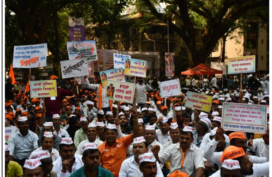
મુંબઈમાં પીઓપીની મૂર્તિ પર મૂકવામાં આવેલા પ્રતિબંધના વિરોધમાં મૂર્તિકારો દ્વારા દેખાવો કરવામાં આવ્યા હતા. (અમય ખરાડે)

મુંબઈ: 'કોલાબા-બાંદ્રા-સીપ્હા અંડરગ્રાઉન્ડ મેટ્રો ૩' લાઇનનું ૯૫ ટકા કામ પૂર્ણ થઈ ગયું છે અને બીકેસી-કફ પરેડ વચ્ચેના ભાગનું ૯૩ ટકા કામ પૂર્ણ થઈ ગયું હોવાની માહિતી મુંબઈ મેટ્રો રેલ કોર્પોરેશન (એમએમઆરસી) એ આપી છે. આર-બીકેસી વચ્ચેનો પહેલો તબક્કો શરૂ કરવામાં આવ્યો છે અને બીકેસી-કફ પરેડ તબક્કાના બીકેસી-આચાર્ય અને ચોક મેટ્રો સ્ટેશન તબક્કાને ટૂંક સમયમાં સેવામાં મૂકવામાં આવશે. બીકેસી - આચાર્ય અને ચોક મેટ્રો સ્ટેશન તબક્કામાં મેટ્રો સ્ટેશનોનું ૯૮.૦૦ ટકા કામ પૂર્ણ થઈ ગયું છે.