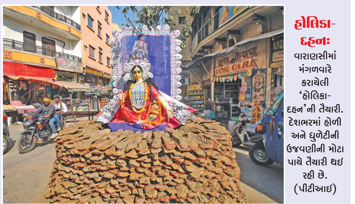
હોલિકા-દહન: વારાણસીમાં મંગળવારે કરાયેલી 'હોલિકા-દહન'ની તૈયારી. દેશભરમાં હોળી અને ધુળેટીની ઉજવણીની મોટા પાયે તૈયારી થઈ રહી છે. (પીટીઆઈ)

નથી કરાયું. સંયુક્ત રાષ્ટ્રસંઘની મહિલાઓના અધિકારો માટે કાર્ય કરતી સમિતિના અહેવાલમાં જણાવાયું હતું કે દુનિયાના પચીસ ટકા (એક-ચતુર્થાંશ) દેશોમાં મહિલાઓ સાથેના અન્યાયના કિસ્સા હજી પણ મોટી સંખ્યામાં (જુઓ પાનું ૨) ▶▶