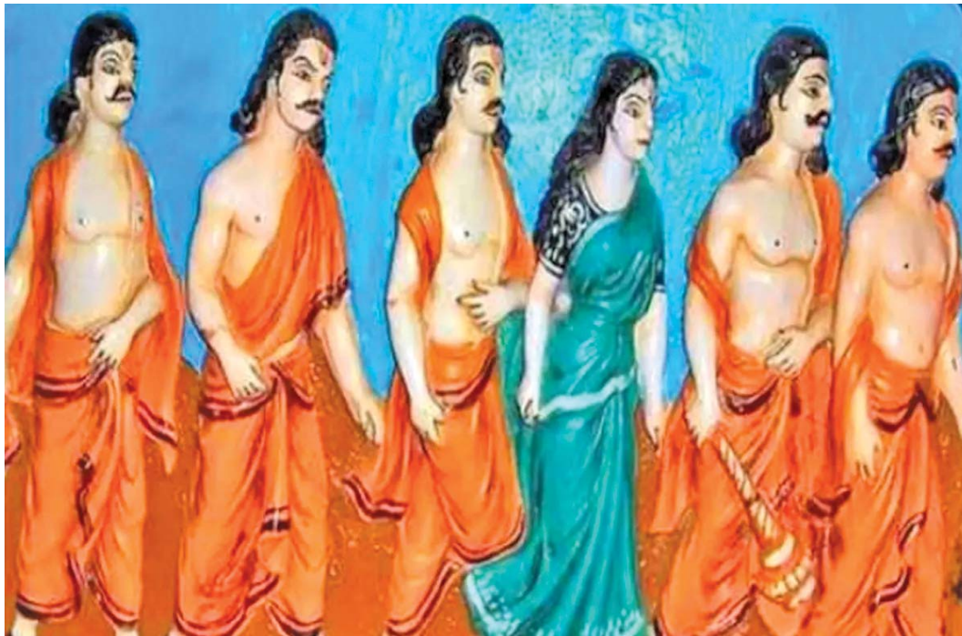
ક્રૌંપદી સાથે પાંડવો અજ્ઞાતવાસમાં

પરિશ્રમની સાથે જોખમ લેનારો જ જીવન સફળ બનાવી શકે.