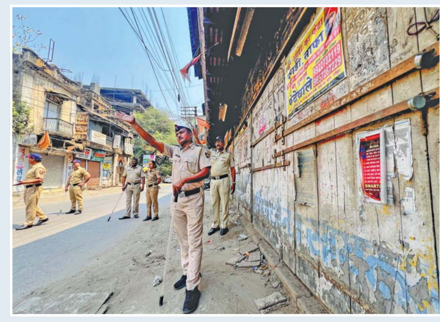
દ્રશ્ય દેશન: ઔરંગઝેબની કબરના મુદ્દે નાગપુરમાં સોમવારની હિંસા પછી બુધવારે પણ અનેક વિસ્તારોમાં કચ્છું યથાવત્ હતો.