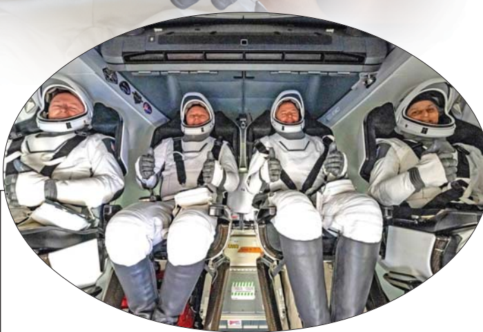
સુરક્ષિત ધરવાપસી : ભારતીય મૂળની અવકાશયાત્રી સુનિતા વિલિયમ્સ અને નાસાના અવકાશવીર બુચ વિલ્મોર નવ મહિના અને ૧૪ દિવસ અવકાશમાં રહ્યાં બાદ પાછાં ફર્યા હતાં. ડ્રેગન અવકાશયાન બુધવારે ફ્લોરિડાના કિનારે ઊતર્યું હતું, ડ્રેગન કેપ્સ્યુલને અવકાશયાનથી અલગ કરવામાં ૧૭ કલાક લાગ્યા હતા. (પીટીઆઈ)

વિલ્મોર અને વિલિયમ્સે તેમના પ્રિયજનો સાથે પુનઃમિલન કરતા પહેલા રાહ જોવી પડશે. નાસાના ત્રણ અવકાશયાત્રીઓને ફ્લાઇટ સર્જન દ્વારા તપાસવામાં આવશે કારણ કે તેમને ગુસ્તવાકર્ષણ સાથે એકઠું થતાં વાર લાગશે, અને ઘણા દિવસો પછી ઘરે જવાની મંજૂરી મળશે. તેમને જરૂરી ચેકઅપ માટે હુસ્ટન લઈ જવાયા હતા. ગયા વસંતમાં ૫ જૂનના રોજ બોઇંગના નવા સ્ટારલાઇનર ક્રૂ કેપ્સ્યુલ પર લોન્ચ થયા પછી બંને એક અઠવાડિયા કે તેથી વધુ સમય પસાર થવાની અપેક્ષા સાથે ગયાં હતાં. વિલ્મોર અને વિલિયમ્સે અવકાશમાં ૨૮૬ દિવસ ગાળ્યા હતા - જ્યારે તેઓ લોન્ચ થયા ત્યારે ધાર્યા કરતા ૨૭૮ દિવસ વધુ રહ્યાં હતાં. તેઓએ પૃથ્વીની ૪૫૭૬ વખત (જુઓ પાનું ૨) >>