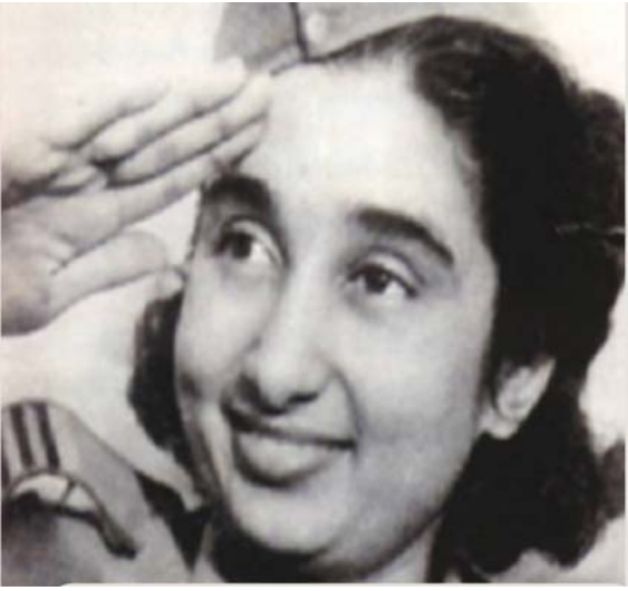
નામ: કેપ્ટન લક્ષ્મી સહગલ સમય: ૧૯૮૮ સ્થળ: કાનપુર ઉંમર: ૮૩ વર્ષ (ભાગ: ૧)