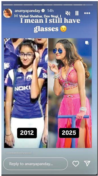
સોમવારે વાનખેડેમાં અભિનેત્રી અનન્યા પાન્ડેએ મેચ પહેલાંના પર્ફોર્મન્સથી સૌને મંત્રમુગ્ધ કર્યા હતા.

મુંબઈ: વાનખેડે સ્ટેડિયમમાં સોમવારે આઈપીએલ-૨૦૨૫ની પ્રથમ મેચ મુંબઈ ઇન્ડિયન્સ (એમઆઇ) અને ડિકેન્ટિંગ ચેમ્પિયન કોલકાતા નાઇટ રાઇડર્સ (કેકેઆર) વચ્ચે ૨માઈ એ પહેલાં ઓપનિંગ સમારોહમાં બોલીવૂડ-અભિનેત્રી અનન્યા પાન્ડેએ સ્ટેજ પર્ફોર્મન્સથી સૌને મોહિત કરી લીધા હતા અને આ સમારંભ બાદ ખુદ તેણે પોતાની કેટલીક જૂની તસવીરો પણ શેર કરી હતી.