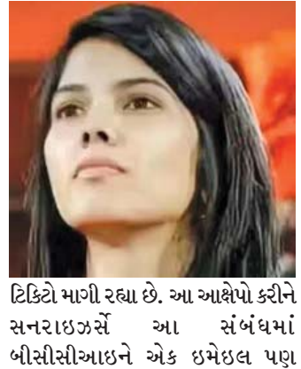
ટિકિટો માગી રહ્યા છે. આ આક્ષેપો કરીને સનરાઇઝર્સ આ સંબંધમાં બીસીસીઆઇને એક ઇમેઇલ પણ