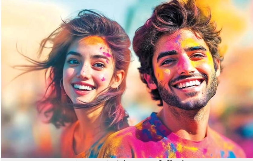
‘નાદશા’માં સંગીત માનવ નિર્મિત છે

એકવીસમી સદી ટેકનોલોજીના પ્રભુત્વની સદી તરીકે પણ ગણવામાં આવશે એ હદે એનો પગપેસારો થઈ રહ્યો છે. આર્ટિફિશિયલ ઈન્ટેલિજન્સ - AI મનુષ્ય જીવનમાં દાખલ થઈ એનો ઝડપથી પ્રસાર થઈ રહ્યો છે. આ સદીના ત્રીજા દાયકામાં ચિત્રપટ સુધિમાં એની હાજરી ભલે નજીવી, પણ વર્તાઈ રહી છે એ નોંધવા જેવી હકીકત છે.