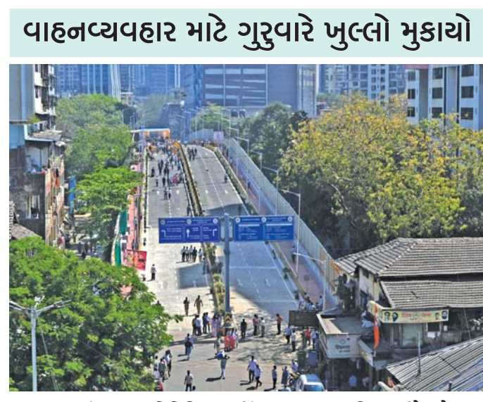
વાહનવ્યવહાર માટે ગુરુવારે ખુલ્લો મુકાયો

(અમારા પ્રતિનિધિ તરફથી) મુંબઈ: દક્ષિણ મુંબઈના તાડદેવ- નાગપાડા અને મુંબઈ સેન્ટ્રલ રેલવે સ્ટેશનને જોડનારા બેલાસિસ રેલવે ઓવર બ્રિજનું ગુરુવારે મુખ્ય પ્રધાન દેવેન્દ્ર ફડણવીસે લોકાર્પણ કર્યા બાદ સાંજે તેને વાહનવ્યવહાર માટે ખુલ્લો મુકવામાં આવ્યો હતો. એ સાથે જ આ રેલવે ઓવર બ્રિજનું નામકરણ કરવામાં આવ્યું હતું. હવેથી આ રેલવે ઓવર બ્રિજ પુલ્કર-લોક અહિલ્યાદેવી હોળકર બ્રિજ તરીકે ઓળખાશે. આગાઉ બેલાસિસ તરીકે ઓળખાતા રેલવે ઓવર બ્રિજનું પુનઃબાંધકામ હાથ ધર્યા બાદ છેલ્લા બે વર્ષથી તેને ખુલ્લો ક્યારે મુકવામાં આવે છે તેની રાહ જોવામાં આવતી હતી. છેવટે લાંબી રાહ બાદ ગુરુવાર સાંજથી તે વાહનવ્યવહાર માટે ખુલ્લો મુકી દેવામાં આવતા નાગરિકોને રાહત થઈ હતી. ગુરુવારે મુખ્ય પ્રધાને વિડિયો (જુઓ પાનું ૪) ▶▶