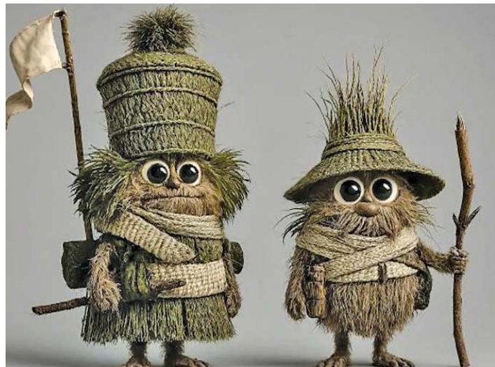
કાન ફેસ્ટિવલમાં રજૂ થનારી 'ક્રીટર્સ'

ધૂમ્રપાનની લત માટે ઘરમાંથી સોનું ચોરી પૈસા ઉપજાવવા હતા એ વાતની કબૂલાત કરી મોહનદાસ કરમચંદ ગાંધી નામના ૧૫ વર્ષના કિશોરે સત્યનો આગ્રહ રાખ્યો હતો. ત્યારે એમને તો શું કોઈને સપને પણ ખ્યાલ નહીં હોય કે એ સત્યનો આગ્રહ સત્યાગ્રહ બની જીવનમાં એવો વણાઈ જશે કે ૫૮ વર્ષની ઉંમરે મહાત્મા ગાંધી 'સત્યના પ્રયોગો' નામની આત્મકથા લખશે, જેનો વિશ્વની વીસેક ભાષામાં અનુવાદ થશે અને એની ૧૮ લાખથી વધુ નકલ છપાશે.