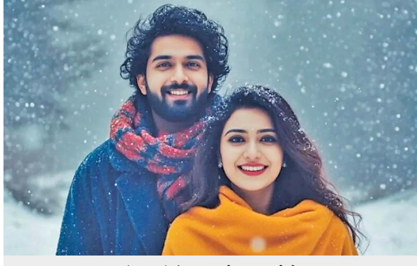
‘લવ યુ’માં મનુષ્યની બાદબાકી છે

વિદેશી સાથે સાથે આપણે ત્યાં સુદઘાં હિન્દી અને અન્ય ભાષામાં AIના ઉપયોગથી ફિલ્મ બનાવવાની કોશિશ જોવા મળી રહી છે