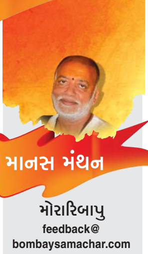
માનસ મંથન મોરારિબાપુ feedback@ bombaysamachar.com

પાણી, માટી અને કાઢવ તો માત્ર એક પરિસ્થિતિ છે. તેમાંથી થકી સ્થાપિત થતું પરિણામ સંલગ્ન વ્યક્તિ પર આધાર રાખે છે. વ્યક્તિની શારીરિક તેમજ માનસિક ક્ષમતા તેમજ નબળાઈ, વ્યક્તિના સિદ્ધાંતો તેમજ મૂલ્યો, વ્યક્તિની માનસિકતા તેમજ પરિષ્કવતા, વ્યક્તિની જરૂરિયાત તથા અપેક્ષાઓ, વ્યક્તિની પ્રતિબદ્ધતા તેમજ નિષ્ઠા, તથા તે વ્યક્તિના અસ્તિત્વ સાથે જોડાયેલી કેટલીક ભાવાત્મક બાબતોને આધારે પરિણામ નક્કી થઈ શકે. છતાં પણ જો મૂળ વિશેષ સ્પષ્ટતા હોય તો કાર્ય સરળ બની શકે. જો પાણી નિયંત્રિત કરી શકાય તો કાઢવની સંભાવના ઊભી જ ન થાય. ■