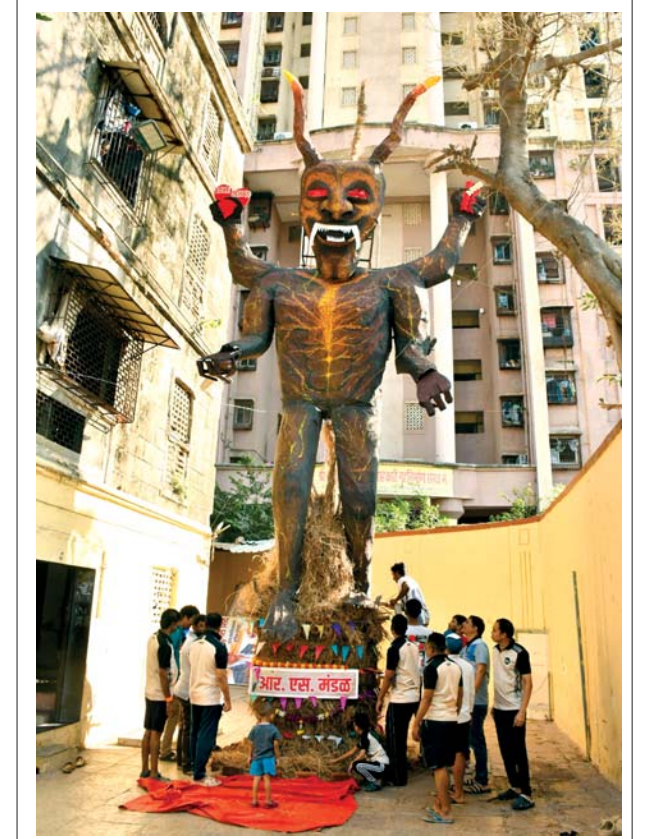
દાનવરૂપી હોળી: અસત્ય પર સત્યના વિજયરૂપે હોળી દહન કરવામાં આવે છે ત્યારે દેશમાં વિરોધી સમસ્યા ઊભી કરનારાઓની દાનવરૂપી હોળી વરલી બીડીટી ચાલના આર. એસ. મંડળ દ્વારા બનાવવામાં આવી છે જેનું દહન આજે સોમવારે કરવામાં આવશે.

૨૦૦૦ સેકેવર ફૂટના વિસ્તારમાં ધીમે ધીમે પહેલા અને બીજા માળ સહિત ટેરેસ સુધીના વિસ્તારમાં ફેલાઈ ગઈ હતી. આગમાં ઈલેક્ટ્રિક વાયરિંગ્સ ઈન્સ્ટોલેશન, લાકડાનું ફર્નિચર, ગાડલાસ ભંગાર સામાન વગેરેમાં ફેલાઈ હતી. મોડી રાતના લગભગ ૨.૩૦ વાગ્યાની આસપાસ આગ પર નિયંત્રણ મેળવવામાં સફળતા મળી હતી. જોકે કુલિંગ ઓપરેશન માટે સુધી ચાલ્યું હતું. આગમાં કોઈ જખમી થયું નહોતું. આગનું ચોક્કસ કારણ જાણી શકાયું નહોતું પણ પ્રાથમિક તપાસમાં શોર્ટ સર્કિટને કારણે આગ લાગી હોવાનું માનવામાં આવે છે.