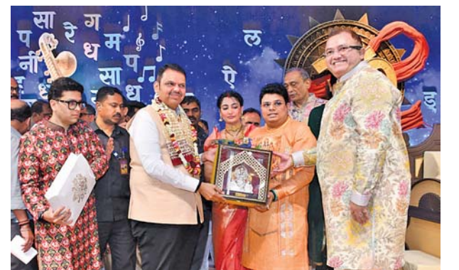
મુખ્ય મનોરથી સૌરભ મહેતા, મિતેશ શાહના હસ્તે મુખ્ય પ્રધાન દેવેન્દ્ર ફડણવીસનું સન્માન કરાયું હતું