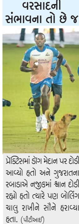
પ્રેક્ટિસમાં ડોગ મેદાન પર દોડી આવ્યો હતો અને ગુજરાતના રબાડાને નજીકમાં શ્વાન દોડી રહ્યો હતો ત્યારે પણ બોલિંગ ચાલુ રાખીને સૌને હરાવ્યા હતા. (પીટીઆઈ)

નવી દિલ્હી: અહીં બુધવારે (સાંજે ૭.૩૦ વાગ્યાથી) રમાનારી મેચમાં યજમાન દિલ્હી કેપિટલ્સ જીતીને સતત ત્રીજી મેચમાં પણ અપરાજિત રહેવા કોઈ કસર નહીં છોડે ત્યાં બીજી તરફ ગુજરાત ટાઇટન્સ પહેલી બન્ને મેચ હાર્યા બાદ પહેલી વખત જીતવા મક્કમ છે. બુધવારે દિલ્હીમાં કમોસમી વરસાદ પડવાની સંભાવના છે. ગુજરાતનો સુકાની શુભમન ગિલ ગરદનમાં દુભાવો હોવાથી પાછલી મેચ નહોતો રમ્યો. મિડલ-ઓર્ડર બેટ્સમેન સમીર રિઝવી આ વખતના ટીમના પહેલા બન્ને મુકાબલામાં મેન ઓફ ધ મેચ બન્યો હતો એટલે તેની પાસેથી કેપ્ટન અક્ષર પટેલ વધુ સફળ પર્ફોર્મન્સની અપેક્ષા રાખશે જ, ઓપનર કે. એલ. રાહુલ પાસે પણ ટીમને ઘણી આશા છે. તેણે ખૂબ બેટિંગ પ્રેક્ટિસ કરી છે. દિલ્હીની ટીમમાં રાહુલ ઉપરાંત ખુદ અક્ષર પટેલના તેમ જ નીતીશ રાણા અને ડેવિડ મિલર પાસે પણ દિલ્હીવાસીઓ અસલ પર્ફોર્મન્સની અપેક્ષા રાખતા જ હશે.