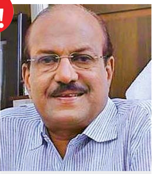
પી. કે. કુન્હાલિકુન્ડી

વગદાર લોકોનાં નામો હતાં. મોટો આંચકો એ હતો કે આ સેક્સકાંડમાં રાજ્યના ઉદ્યોગ અને ઇન્ફોર્મેશન ટેકનોલોજી પ્રધાન પી. કે. કુન્હાલિકુન્ડીનું નામ બહાર આવ્યું હતું. અચ્યુતનંદને કોર્ટ પિટિશનમાં દાવો કર્યો હતો કે ખુદ કુન્હાલિકુન્ડીના સંબંધી કે. એ. રહુકે પ્રેસ કોન્ફરન્સમાં સ્વીકાર્યું હતું કે આ પ્રધાને આ કેસના મુખ્ય સાક્ષીઓને આર્થિક લાભ આપી તેમના નિવેદન બદલી નાખવા પ્રભાવિત કર્યા હતા. આ સનસનીબેજ વિસ્ફોટને આધારે કેરળ પોલીસે ૨૦૧૧ની ૩૦મી જાન્યુઆરીએ ૩૦ નવો કેસ નોંધ્યો હતો. એટલું જ નહિ બીજી ફેબ્રુઆરીએ વિશેષ તપાસ દળ (સ્પેશિયલ ઈન્વેસ્ટિગેશન ટીમ - એસ.આઇ.ટી.) રચવાની જાહેરાત કરી હતી. આઇસક્રીમ પાર્લર સેક્સ સ્કેન્ડલથી રાજ્યમાં શાસક અને વિપક્ષો તો સામસામે આવી જ ગયા હતા. આ સાથે