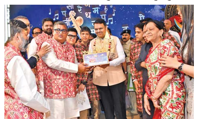
મુખ્ય પ્રધાન દેવેન્દ્ર ફડણવીસના હસ્તે શ્રી સંતોષ સિંહનું સન્માન કરવામાં આવ્યું હતું