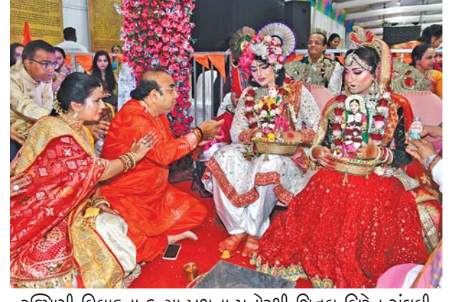
રુક્મિણી વિવાહના કન્યા પક્ષના મનોરથી શિતલ બિરેન ઘંધવી