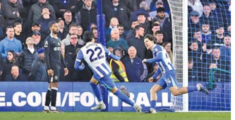
બ્રાઇટન વતી ફર્ડીએ પહેલો ગોલ કર્યો હતો અને ડેની વેલ્બેકે ૯૧મી મિનિટમાં ગોલ કર્યો હતો.

લંડન: ચેલ્સી ફૂટબોલ ક્લબની ટીમ છ વખત ઇંગ્લિશ પ્રીમિયર લીગ (ઇપીએલ)નું અને બે વખત ચેમ્પિયન્સ લીગ (સીએલ)નું ટાઇટલ જીતી ચૂકી છે, પરંતુ મંગળવારે કંઈક એવું જેને કારણે ચેલ્સીની ટીમ મોટી મુશ્કેલીમાં મુકાઈ શકે એવી સ્થિતિ સર્જાઈ છે. આ ટીમ ચેમ્પિયન્સ લીગ માટે ક્વોલિફાઇ ન થઈ શકે એવા સંજોગો ઊભા થયા છે.