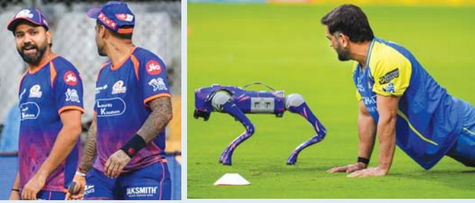
ગઈ કાલે વાનખેડેમાં પ્રેક્ટિસ દરમિયાન સૂર્યકુમાર સાથે રોહિત (ડાબે) અને રોનો કેમેરા સાથે મજાકના મૂડમાં ધોની.

આ વખતે પહેલી ચાર મેચ રમેલા રોહિતને સાથળમાં ઈજા થઈ હતી, જ્યારે ધોની આ વખતે પહેલી જ વખત રમતો જોવા મળશે. ગઈ કાલે બન્ને ટિગ્ગરે વાનખેડેમાં ઘણી પ્રેક્ટિસ કરી