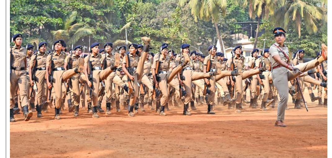
મહારાષ્ટ્ર દિન પહેલી મેના દિવસે દાદરના શિવાજી પાર્કમાં પરેડ યોજાતી હોય છે જેની તૈયારી રૂપે નાયગાંવ પોલીસ ગ્રાઉન્ડમાં મહિલા પોલીસોને તાલીમ આપવામાં આવી હતી.

શિક્ષણ વિભાગનો શિક્ષકોને યુજીસી ધોરણે વેતન આપવાનો નિર્ણય કેબિનેટની બેઠકમાં અન્ય ત્રણ મહત્વના નિર્ણયો લેવાયા (અમારા પ્રતિનિધિ તરફથી) મુંબઈ: રાજ્ય પ્રધાનમંડળની એક મહત્વપૂર્ણ બેઠકમાં ચાર ઐતિહાસિક નિર્ણયો લેવામાં આવ્યા. આનાથી શિક્ષણ ક્ષેત્ર, પર્યાવરણ, ઔદ્યોગિક વિકાસ અને જમીન નીતિમાં મોટા ફેરફારો થશે. સ્પષ્ટ છે કે આ નિર્ણયો રાજ્યના વિવિધ ક્ષેત્રોને નવી ગતિ આપશે. સૌ પ્રથમ, મહારાષ્ટ્ર રાજ્ય સંકુલિત બાયોગેસ નીતિ (સીબીજી) ૨૦૨૬ ની જાહેરાત કરવામાં આવી છે. આ નીતિ અનુસાર દરેક જિલ્લામાં એક સંકલન સમિતિની રચના કરવામાં આવશે. બાયોગેસ પ્રોજેક્ટ્સ પીપીપી ધોરણે અને હાઇબ્રિડ વાર્ષિકી પદ્ધતિથી અમલમાં મૂકવામાં આવશે. ચાલુ વર્ષમાં આ માટે રૂ. ૫૦૦ કરોડની જોગવાઈ કરવામાં આવી છે. આ પહેલ ઘન કચરાના પર્યાવરણને અનુકૂળ વ્યવસ્થાપનને સક્ષમ બનાવશે અને ગ્રીનહાઉસ ગેસ ઉત્સર્જનમાં મોટા પ્રમાણમાં ઘટાડો કરશે. શહેરી વિકાસ વિભાગે આની જવાબદારી લીધી છે. બીજો મહત્વપૂર્ણ નિર્ણય શિક્ષણ ક્ષેત્ર સાથે સંબંધિત છે. રાજ્યની સાત મોડેલ કોલેજોમાં શિક્ષકોને યુનિવર્સિટી ગ્રાન્ટ્સ કમિશનના નિર્દેશો અનુસાર મૂળ પગાર આપવામાં આવશે. આ કોલેજોમાં કાર્યરત શિક્ષકોને ઉચ્ચ અને ટેકનિકલ શિક્ષણ વિભાગની ભરતી પ્રક્રિયામાં વધારાના ગુણ મળશે. આનાથી શિક્ષકોને પ્રોત્સાહન મળશે અને ગુણવત્તાયુક્ત અમલમાં મૂકવામાં આવશે. ચાલુ વર્ષમાં (જુઓ પાનું ૪) >>