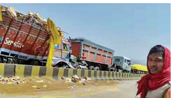
ઉત્તર પ્રદેશના મિર્ઝાપુર ખાતે ગુરુવારે મેશનલ હાઈવે રસ્તા પર ફરતું મોત: ૧૩૫ પર થયેલા અકસ્માતે ૧૧ જણનો ભોગ લીધો હતો. અકસ્માતનો ભોગ બનેલાં વાહનોનો કાટમાળ રસ્તાની બાજુએ ખેડેલી દીઠા બાદ વાહનવ્યવહાર પૂર્વવત્ થયો હતો.

ઉત્તર પ્રદેશના મિર્ઝાપુર જિલ્લામાં અનેક વાહન એકમેક સાથે ટકરાતાં થયેલા અકસ્માતમાં ૧૧ જણનાં મોત થયાં હોવાનું પોલીસે ગુરુવારે કહ્યું હતું. એક ટ્રકની બ્રેક ફેઇલ થવાને કારણે બુધવારે રાત્રે સાડાઠાક વાગે આ અકસ્માત થયો હોવાનું પોલીસે કહ્યું હતું. ઘટનાની જાણ થતાં જ પોલીસ અને અગ્નિશમન દળની ટુકડી તાત્કાલિક ઘટનાસ્થળે પહોંચી ગઈ હતી અને સ્થાનિક લોકોની સહાયથી બચાવ તેમ જ રાહત કામગીરી શરૂ કરી દીધી હતી, એમ એસપી અપુર્ણ રજત કોશિકે કહ્યું હતું. મુખ્ય પ્રધાન યોગી આદિત્યાનાથે આ ક્યુપીટિકા અંગે શોક વ્યક્ત કર્યો હતો અને મૃતકના પરિવારજનો પરત્વે સહાનુભૂતિ વ્યક્ત કરી હતી. પ્રાથમિક અહેવાલ મુજબ પસાર થઈ રહેલી એક ટ્રકની બ્રેક ફેઇલ થતાં આ અકસ્માત સર્જાયો હતો. મધ્ય પ્રદેશથી આવેલી ચણા લાદેલી ટ્રકની બ્રેક ફેઇલ થતાં ડ્રાઈવરે વાહન પરનો અંકુશ ગુમાવ્યો હતો અને ટ્રક આગળ જઈ રહેલી બોલેરો કાર સાથે અથડાયા બાદ અનેક વાહન એકમેક સાથે ટકરાયાં હતાં. અકસ્માતને પગલે બોલેરો કારમાં આગ લાગી હતી. આગ એટલી તીવ્ર હતી કે તેને કાબૂમાં લેતાં કલાકો લાગ્યા હતા.