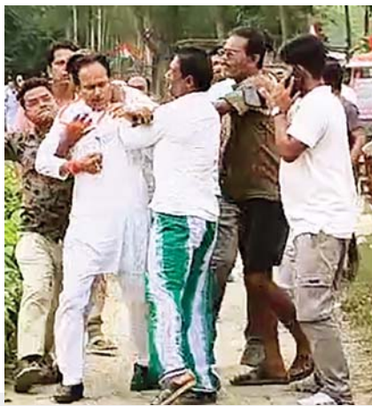
યહ ક્યા હો રહા હૈ:

આઝાદી પછીનું સૌથી વધુ વોટિંગ: જોકે સાથે હિંસાના પહા ઘણા બનાવો