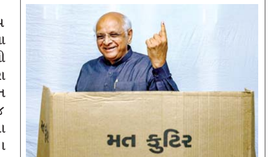
મતદાન: અમદાવાદ મ્યુનિસિપલ કોર્પોરેશનની ચૂંટણીમાં મતદાન કર્યા બાદ શાહીની નિશાનીવાળી આંગળી બતાવતા ગુજરાતના મુખ્ય પ્રધાન ભૂપેન્દ્ર પટેલ.

અમદાવાદ: ગુજરાતમાં કાળઝાળ ગરમીની વચ્ચે ૧૫ મહાનગરપાલિકાઓ, ૮૪ નગરપાલિકાઓ, ૩૪ જિલ્લા પંચાયતો અને ૨૬૦ તાલુકા પંચાયતોની સામાન્ય ચૂંટણી તેમ જ ૧૧ નગરપાલિકાઓની પેટા ચૂંટણી માટે સરેરાશ અંદાજિત ૫૭ ટકા જેટલું શાંતિપૂર્ણ મતદાન સંપન્ન થયું હતું. ચૂંટણીના અંદાજિત આંકડાઓ મુજબ, ૮૪ નગરપાલિકાઓમાં ૫૮.૧૨ ટકા, ૩૪ જિલ્લા પંચાયતોમાં ૬૦.૨૧ ટકા અને ૨૬૦ તાલુકા પંચાયતોમાં ૬૧.૦૦ ટકા મતદાન નોંધાયું હતું. ૧૫ મહાનગરપાલિકાઓની કુલ ૧૦૦૧ બેઠકો પર ચૂંટણી લડી રહેલા ૩૧૪૫ ઉમેદવારોનું રાજકીય ભાવિ હાલ ઈવીએમમાં સીલ થઈ ચૂક્યું છે, જેનો આખરી ફેસલો આગામી મંગળવારે મતગણતરી બાદ જાહેર કરવામાં આવશે. જોકે મતદાનના આંકડા જોતા જણાઈ રહ્યું છે કે શહેરી પ્રજા કરતા ગ્રામ્ય પ્રજાએ મતદાનમાં વધુ રસ દાખવ્યો હતો.