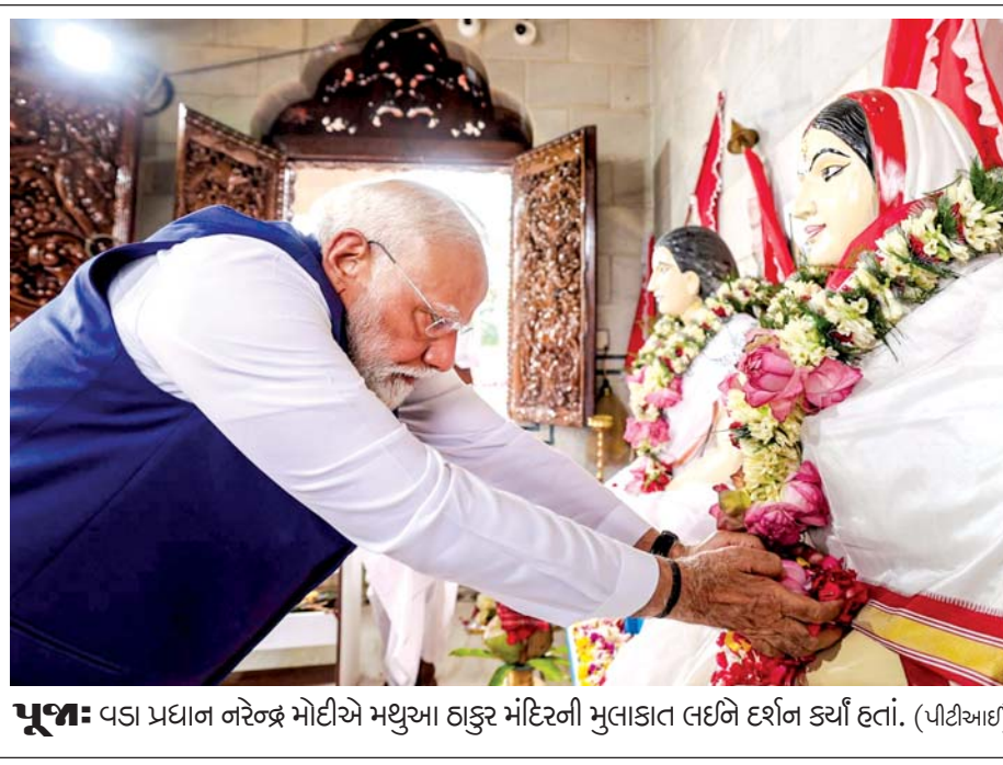
પૂજા: વડા પ્રધાન નરેન્દ્ર મોદીએ મધુઆ હાકુર મંદિરની મુલાકાત લઈને દર્શન કર્યાં હતાં.

હુગો લોપેઝે કહ્યું હતું કે આ આતંકવાદી કૃત્ય હતું. તેમણે આ હુમલા માટે કોલંબિયાના મોસ્ટ વોન્ટેજ મેન ઈવાન મોર્ડિસ્કો અને જેમે માર્ટિનેઝના જૂથના નેટવર્કને દોષિત કરાવી હતી. ૨૦૧૬માં કરાયેલા શાંતિ કરારને માનવાનો મોર્ડિસ્કો અને જેમે માર્ટિનેઝે ના પાડી છે. કોલંબિયાના પ્રમુખ ગુસ્તાવો પેટ્રોએ આ હુમલાની નિંદા કરી છે. તેમણે કહ્યું હતું કે જે લોકોએ હુમલો કરીને સાત નાગરિકોને મારી નાખ્યા હતા અને બીજા ૧૭ને ઘાયલ કર્યા હતા એ લોકો આતંકવાદી, ફાસિસ્ટ અને કેફીદ્રવ્યોની હેરફેર કરનારા છે. આ હુમલો જાહેર માળખાકીય સુવિધાને તોડી પાડવા માટે કરાયો હતો. (એજન્સી) ■