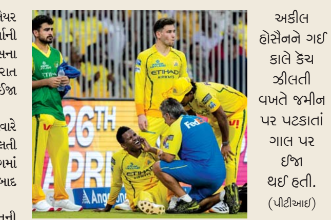
घटना याद आवी गळी छे. येन्गळना क्लिनिये थरत ज मॅदान पर द्रोडी आल्या हाता अने अकीलनी छिजा गंभीर तो नथीने अने तेने माथामां कोर्ठ दुभावो नथी थतोने अेवुं विचारने सारवार शड करी हाता. जेके सध्दासीने अकीलनी छन्जरी गंभीर नहोती अने तेणे थोडी ज वारमां इरी रमवानुं शड करी हातुं.

येन्गळ: गुजुराते वानभेडमां मुंबई छनिंस्सना चार प्लेयर रेनिश मालेवर, नमन धीर, सूर्यकुमार यादव अने तिलक वर्मानो विकेट लईने मुंबईने पराजय तरक द्रोडी जनार येन्गळ सुपरकॅप्सना डेव्हिभियन स्पिनर अकील हासेने रविवारे येन्गळमां गुजुरात टाउटन्स सामेनी भेंचमां यहेरा पर छिजा थर्ध हाता. जेके अे छिजा गंभीर नहोती अने पछीथी ते ररयो हाता. बे दिवसमां बे झीलडरने छिजा थवानो भनाव बन्यो छे. शनिवारे दिव्हीनो लुंगी अॅन्गिडी पंजाबना बेंटसमेनो संभवित केंच जीलती वपते छिजा माथे पटकायो हाता अने तेने माथाना पाछगना भागमां छिजा थर्ध हाता. जेके दिव्हीनी हॉस्पिटलमां सारवार लीधा बाढ तेनी हातल हावे सारी छे. रविवारे येन्गळना अकील हासेनेनी छिजा घटना गुजुरातनी छनिंस्सनी छळी ओवरमां बनी हाता. गुजुरातना सुकानी शुभमन गिले बोलने आंक साउथ पर मोकल्यो हाता अने अकील केंच जीलवाना छरादाथी पोतानी जमपुडी दिशामां दोज्यो हाता. जेके ते जमीन पर पटकायो हाता अने तेने गाल पर छिजा थर्ध हाता. रविवारे येन्गळना अकील हासेनेनी छिजा घटना गुजुरातनी छनिंस्सनी छळी ओवरमां बनी हाता. गुजुरातना सुकानी शुभमन गिले बोलने आंक साउथ पर मोकल्यो हाता अने अकील केंच जीलवाना छरादाथी पोतानी जमपुडी दिशामां दोज्यो हाता. जेके ते जमीन पर पटकायो हाता अने तेने गाल पर छिजा थर्ध हाता.