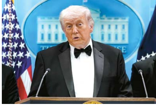
પણ તાત્કાલિક બહાર કાઢવામાં આવ્યા હતા. એક રિપોર્ટ અનુસાર, પ્રમુખ ટ્રમ્પના વાઇટ હાઉસ કોરસપોન્ડન્ટ્સ એસોસિએશન ડિનરમાં ફાયરિંગ કરનારને ઝડપી લીધો હતો.

વોશિંગ્ટન: વાઇટ હાઉસ કોરસપોન્ડન્ટ્સ ડિનરમાં શનિવારે રાત્રે ગોળીબાર થયો હતો. આ ઘટના દરમિયાન અમેરિકાના પ્રમુખ ડોનલ્ડ ટ્રમ્પ અને ફર્સ્ટ લેડી મેલાનિયા સ્ટેજ પર હાજર હતાં. ગોળીબાર બાદ સિકેટ સર્વિસે તાત્કાલિક પ્રમુખ ડોનલ્ડ ટ્રમ્પ અને અન્ય ટોચના નેતાઓને સુરક્ષિત રીતે બહાર કાઢ્યા હતા. ફાયરિંગમાં કોઈને ઈજા પહોંચી નથી. ફાયરિંગના કારણે જીવ બચાવવા સેંકડો મહેમાનો ટેબલ નીચે ઝૂકી ગયા ત્યારે સિકેટ સર્વિસ અને અન્ય અધિકારીઓ વોશિંગ્ટન હિલ્ટન ખાતેના બેન્કવેટ હોલમાં ધસી ગયા હતા. બાદમાં સિકેટ સર્વિસ એજન્ટોએ તાત્કાલિક પ્રમુખ ડોનલ્ડ ટ્રમ્પને સ્ટેજ પરથી સુરક્ષિત સ્થળે લઈ ગયા હતા. ઉપપ્રમુખ જે.ડી. વેન્સ અને ટ્રમ્પના મંત્રીમંડળના સભ્યોને