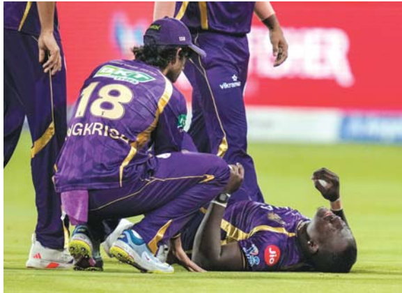
कोलकाताना रोवमेन पोवेलने लखनऊना मिचल मार्शानो डाईविंग केंच जीलती वपते छिजा थर्ध हाता. बे रन जनापनार मार्शानो विकेट वैभव अरोराअे लीधी हाता.