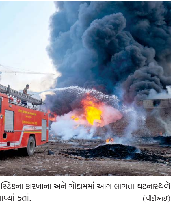
આગ: રવિવારે ગુરગ્રામમાં પ્લાસ્ટિકના કારખાના અને ગોદામમાં આગ લાગતા ઘટનાસ્થળે આગ ઓલવવા ફાયર ફાઈટર આવ્યાં હતાં. (પીટીઆઈ)

હત્યા ઉપરાંત અલગ અલગ સમયે ત્રણ અન્ય અમેરિકી પ્રમુખો પર હુમલો કરવાનો પ્રયાસ કરવામાં આવ્યો હતો જેમાં ફ્રેન્કલિન ડી. રૂઝવેલ્ટ, રોનાલ્ડ રીગન અને ડોનલ્ડ ટ્રમ્પ સામેલ છે. ફ્રેન્કલિન ડી. રૂઝવેલ્ટ પર હુમલો ૧૫ ફેબ્રુઆરી, ૧૯૩૩ના રોજ ફ્લોરિડાના મિયામીમાં થયો હતો. ભાષણ દરમિયાન અચાનક તેમના પર હુમલો કરવામાં આવ્યો હતો. ૩૦ માર્ચ, ૧૯૮૧માં રોનાલ્ડ રિગન પર જોન હિંકલી જુનિયર નામના એક વ્યક્તિએ વોશિંગ્ટન હિલ્ટન હોટલની બહાર ગોળીબાર કર્યો હતો. રિગનને છાતીમાં ગોળી વાગી હતી, પરંતુ તેઓ સારવાર બાદ બચી ગયા હતા. આ હુમલામાં પ્રેસ સેક્રેટરી જેમ્સ શ્રેડી સહિત ત્રણ અન્ય લોકો પણ ઘાયલ થયા હતા. ■