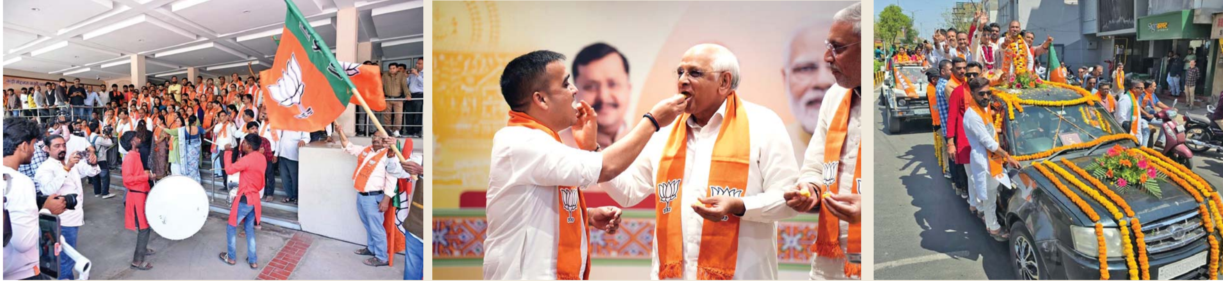
વિજયનો જલ્લોષ: ગુજરાતમાં સ્થાનિક સ્વરાજ્યની ચૂંટણીમાં ભાજપના ભવ્ય વિજયની રાજકોટમાં ઉજવણી કરી રહેલા પક્ષના ટેકેદારો. કમલમ ખાતે એકબીજાનું મોઢું મીઠું કરાવી રહેલા મુખ્ય પ્રધાન ભૂપેન્દ્રભાઈ પટેલ અને નાયબ મુખ્ય પ્રધાન હર્ષ સંઘવી.

ગુજરાતની જનતાનો હૃદયપૂર્વક આભાર વ્યક્ત કર્યું છે, વડા પ્રધાન નરેન્દ્રભાઈ મોદીએ પ્રસ્થાપિત કરેલી વિકાસની રાજનીતિ પ્રત્યે ગુજરાતની જનતાએ અતૂટ વિશ્વાસ અને ભરોસો દર્શાવી ભાજપને આ પ્રચંડ વિજય અપાવ્યો છે. ભાજપ પ્રદેશ અધ્યક્ષ જગદીશભાઈ વિશ્વકર્માએ ગુજરાતની સાડા છ કરોડ જનતાને નતમસ્તક થઈ વંદન કરતા ઠોળાં કહ્યું હતું. નાયબ મુખ્ય પ્રધાન હર્ષભાઈ સંઘવીએ આ જીતને વડા પ્રધાન નરેન્દ્રભાઈ મોદીની વિકાસની રાજનીતિનો વિજય ગણાવતા કહ્યું કે, જનતાએ પુરવાર કર્યું છે ગુજરાતની જનતા અને ભાજપા વિશ્વનો સૌથી મોટો સંયુક્ત પરિવાર છે. ■