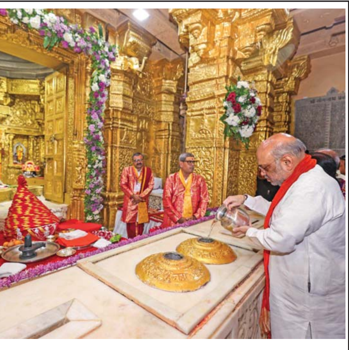
જય સોમનાથ: ગીર સોમનાથ જિલ્લામાં વેરાવળના સોમનાથ મંદિરમાં પૂજા કરી રહેલા કેન્દ્રના ગૃહ પ્રધાન અમિત શાહ.

(અમારા પ્રતિનિધિ તરફથી) અમદાવાદ: એક દાયકા બાદ ગુજરાતમાં ગ્રેટ ઈન્ડિયન બસ્ટર્ડ એટલે કે ઘોરાડના બચાનો જન્મ થયો હતો અને તેને જડબેસલાક સુરક્ષા આપવામાં આવી હતી, પરંતુ જન્મના ૨૬ દિવસમાં જ તે ગાયબ થઈ ગયું હોવાના નિરાશાજનક અહેવાલો આવ્યા છે. લગભગ ૫૦ ગાર્ડર્સ, ૨૪ કલાકની દેખરેખ, ખાસ ઊભા કરાયેલા વોચટાવર પણ આ પક્ષીને રોકવામાં નિષ્ફળ ગયા હતા. વન અધિકારીઓએ જણાવ્યું હતું કે ૧૮ એપ્રિલથી બચ્યું દેખાયું નથી. વારંવાર શોધખોળ કરવા છતાં, તે તેની ટેગ કરેલી મા પાસે પણ મળ્યું નથી. છુપત થઈ જતી પ્રજાતિના આ બચ્યાંના જન્મને એક આશા જગાવી હતી અને તેને ઝેડ પ્લસ સુરક્ષામાં રાખવામાં આવ્યું હતું. તેના અદ્રશ્ય થવાથી હવે રાજ્યના સંરક્ષણ તંત્રની તપાસ થશે તેમ લાગી રહ્યું છે. અગાઉ પણ આ પ્રજાતિના પક્ષીઓ ખોવાયાં છે. ડિસેમ્બર ૨૦૧૮ માં રાજ્યનો એકમાત્ર નર બસ્ટર્ડ ગાયબ થઈ ગયો હતો અને ક્યારેય મળ્યો નથી. ત્યારથી તેની વસ્તી ઘટીને ફક્ત ત્રણ માદા થઈ ગઈ છે. તાજેતરમાં બચ્યું આવ્યા બાદ બે માદાને પણ ટેગ કરવામાં આવી હતી જેથી મોનિટરિંગ યોગ્ય રીતે થઈ શકે. વાહલ્ડલાઇફ ઇન્સ્ટિટ્યૂટ ઓફ ઇન્ડિયા સાથે સંકળાયેલા એક અધિકારીએ નામ ન આપવાની શરતે જણાવ્યું હતું કે નેસ્ટિંગ સાઈટને જોઈએ તેવું રક્ષણ ન મળ્યું હોવાથી અને વિલંબ થયો હોવાથી આ નુકસાન થયું હોઈ શકે. હવે, જીઆઈબી બચ્યાનો કોઈ પત્તો ન હોવાથી, તેને જીવિત શોધવાની આશા ધૂંધળી થઈ ગઈ છે, તેમ નિષ્ણાતો માને છે. ■