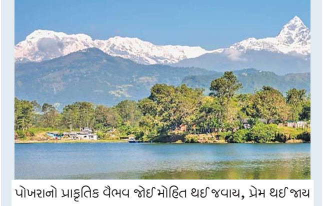
પોખરાનો પ્રાકૃતિક વૈભવ જોઈ મોહિત થઈ જવાય, પ્રેમ થઈ જાય

કેવા લેકઃ પોખરા પ્રાકૃતિક સૌંદર્યનું ગણાય છે એમાં શહેરમાં સ્થિત નવ સરોવરની આભાનો મોટો ફાળો છે. નેપાળી શબ્દ 'પોખરા'નો અર્થ થાય છે 'સરોવરોનું શહેર'. કેવા લેક અહીંનો પ્રખ્યાત લેક તરીકે ગણાવાય છે. એનું કારણ એ છે કે આ સરોવરમાં વિવિધ પ્રકારની નાવડીમાં બોટિંગ કરવાની સગવડ હોવા ઉપરાંત એક મંદિરના દર્શન કરવાની તક પણ મળે છે. બોટિંગના પણ પેકેજિસ છે. એક રાઉન્ડ મારવો છે કે પછી ચકરાવો લેવો છે કે ટૂર સુધી જઈ આનંદ લેવો છે એના આધારે પૈસા ચૂકવવાના રહે છે. અમારું તો પેકેજ ડીલ હતું એટલે હલેસા મારતી ખુલ્લી નાવડી તો નહીં, પણ ઉપરથી બંધ એવી બોટમાં અમારી સવારી ઉપડી. સરોવરના જળ એટલા નિર્મળ હતા કે આપણા પ્રતિબિંબ જોઈ શકાતા હતા. લીલીછમ વનરાજીથી ઢંકાયેલા પહાડો નીરખી મન પ્રકુલિત થઈ ગયું. દસ - બાર મિનિટની જળયાત્રા પછી સામે કિનારે ઉતરીને તાલબારાડી મંદિરમાં દર્શનનો લાભ મળ્યો. પોખરાના આ નામાંકિત ધર્મસ્થાનમાં બિરાજમાન હિન્દુ દેવી બારાહી દુર્ગાનું સ્વરૂપ છે એવી જાણકારી આપવામાં આવી. જોકે, કેવા લેકની અસલી મજા તો અન્નપૂર્ણા પર્વતમાળાના દૃશ્યમાં હતી. પોખરાના અન્ય સરોવરમાં ખસ્તે સરોવર જોવાની અદ્ભુત ઈચ્છા હતી, કારણ કે ત્યાં સાઈબેરિયાના અને અફઘાની પંખીઓ સ્થળાંતર કરીને થોડા સમય માટે વસવાટ કરતા હોય છે. પણ એ શક્ય નહોતું. પોખરાની બીજી મુલાકાતમાં એ ઈચ્છા પૂરી કરવી એવો નિર્ધાર કરી મન મનાવી લીધું.