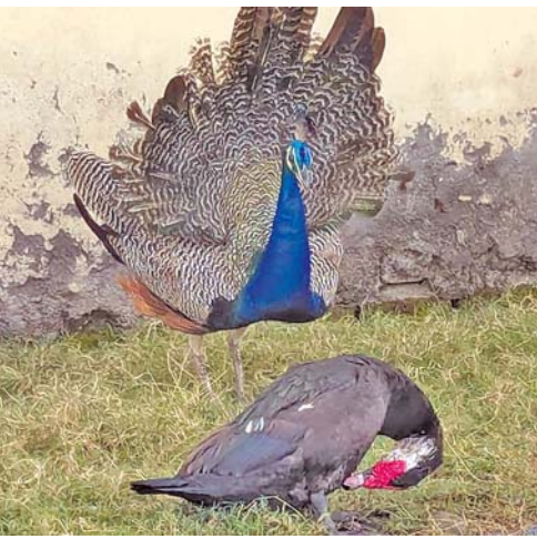
ચિતવન નેશનલ પાર્ક સફારી:

જંગલ સફારીની વાત નીકળે એટલે સૌથી પહેલા આફ્રિકાની 'મસાઈ મારા' (કન્યા) અને 'સેરેન્ગેટી નેશનલ પાર્ક' (ટાન્ઝાનિયા)નું સ્મરણ થાય છે. જંગલ સફારીનું ક્રીમ ગણાતી આ બંને જગ્યાએ એકવાર તો જવું જ જોઈએ એવી ઈચ્છા અનેક દિલોમાં વસવાટ કરતી હશે. અલબત્ત, આ સફારીનો આનંદ લેવા બિસ્સા પહોળા અને ઊંડા હોવા જોઈએ. એમ તો આપણા જિમ કોર્બેટ (નેનિતાલ), રણથંભોર (સવાઈ માધોપુર - રાજસ્થાન), બાંધવગઢ નેશનલ પાર્ક (ઉત્તર પ્રદેશ) તેમજ તરોબા (ચંદ્રપુર - મહારાષ્ટ્ર) ઓછા ઉતરે એવા નથી. નેપાળના પોખરાસ્થિત ચિતવન નેશનલ પાર્કની ખાસિયત એ છે કે અહીં 'જંગલ વોક' કરવાની સુવિધા ઉપલબ્ધ છે. જંગલ વોક શરૂ કરતા પહેલા કેટલીક ચાઠગાર બાબત જોઈ જે માનસપટ પર અંકિત થઈ ગઈ. એક જગ્યાએ મોર અને ઢેલ સાથે હતા. એવું નાનપણથી સાંભળતા આવીએ છીએ અને શાળા ભણતર દરમિયાન પુસ્તકમાં પણ વાંચ્યું છે કે મોર મુખ્યત્વે વર્ષાઋતુ દરમિયાન, આકાશમાં કાળા ડિબાગ વાદળો