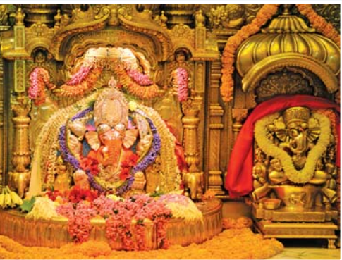
બાપ્પાના શરણે ફટ મંગળવારે અંગારક ચોથનો યોગ વર્ષમાં ફટ બે થી ત્રણ વખત આવતો હોય છે. જેનું મહત્વ ઘણું છે. મુંબઈના પ્રખ્યાત સિદ્ધિવિનાયક મંદિરમાં આ નિમિત્તે બાપ્પાના દર્શન માટે ભક્તોની ભીડ જામી હતી. (અમય ખરાડે)