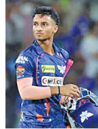
‘આ ટીમ પ્રગતિ કરી જ નહીં શકે. એના કેપ્ટનને અને આખી ટીમને શું કરવું છે જ નથી સમજાતું. તેમની બોલિંગ લાઇન-અપ સારી છે, પરંતુ બાકી બધા પાસે કોઈ જ આશા ન રાખી શકાય. તેમણે આયુષ બદોની પાસે ઘાવની શરૂઆત કરાવી અને એક મેચમાં તો તેમનો આઉટ-ઓફ-ફોર્મ બેટ્સમેન રિન્કુ સિંહ ૬/૮૮ના સ્કોર વખતે પાછો ફોર્મમાં આવ્યો હતો. આવી હતી આ ટીમની હાલત.’ ■

બદોનીને નહોતો રમાડવામાં આવ્યો. આઠ મેચમાં તેની માંડ એક હાફ સેન્યુરી છે. તે બે વખત શૂચ્યમાં આઉટ થયો છે અને બાકીની ઇનિંગ્સમાં તે ક્યારેય ૪૦ રનનો આંકડો પાર નથી કરી શક્યો. આઠ મેચમાં તે કુલ માંડ ૧૭૨ રન બનાવી શક્યો છે. કિષ્નામાચારી શ્રીકાંતે આયુષ બદોની વિશે ટીકા કરતા લખનઉના ફેન્સાઇઝી માટે કહ્યું છે કે 'તમે જેને વર્ષ પછી ટીમમાં રાખી મૂક્યો છે તે ઇનર સર્કલ પરથી બોલ બાઉન્ડરી લાઇન તરફ જાય એવા સારા શોટ પણ નથી રમી શકતો. તેણે આવા માંડ બે શોટ માર્યા છે. તમે તેની બેટિંગ એવરેજ અને બીજા નંબર્સ વિશે જાણશો તો સમજાશે કે તમે ભૂલ કરી રહ્યા છો. જોકે આવી ભૂલ દરેક કરતા જ હોય છે. તમારી ટીમના કોઈને સ્ટાફમાં જાણીતા નામો છે એમ છતાં તમારા જૂના બેટ્સમેનનો પર્ફોર્મન્સ નબળો રહ્યો છે.' શ્રીકાંતે લખનઉની ટીમ વિશે કહ્યું,