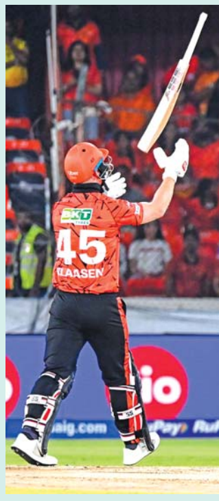
હૈદરાબાદનો દિવિન્ક કલાસેન