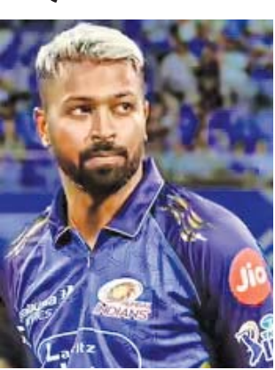
યુક્રો છે જેમાં તેણે ૧૬.૪૪ના સ્ટ્રાઇક-રેટ સાથે કુલ ૧૪૬ રન કર્યા છે જેમાં એકેચ હાફ સેન્યુરી નથી. હાર્દિક આઠ મેચમાં કુલ માત્ર ચાર વિકેટ લઈ શક્યો છે.

મેચની બહાર હતો. તેની ગેરહાજરીમાં સૂર્યકુમાર યાદવે કેપ્ટન્સી સંભાળી હતી. સૂર્યએ ટોસ વખતે કહ્યું હતું કે 'હાર્દિક પૂર્ણપણે ફિટ નથી એટલે તે પ્લેઇંગ-ઇલેવનમાં સામેલ નથી.' જોકે પીઠની કથિત ઈજાને કારણે તે અગાઉ દિલ્હી સામેની મેચમાં પણ નહોતો રમ્યો. મુંબઈની ટીમ આ વખતની ટૂર્નામેન્ટમાં બહુ ખરાબ હાલતમાં છે. માત્ર છ પોઇન્ટ સાથે આ ટીમ છેક નવમા નંબરે છે. હાર્દિકનો પોતાનો પર્ફોર્મન્સ પણ સારો નથી. ૧૦માંથી મુંબઈની ટીમ ફક્ત ત્રણ મેચ જીતી છે અને સાત મેચમાં પરાજિત થઈ છે. હાર્દિક આઠ મેચમાં બેટિંગ કરી