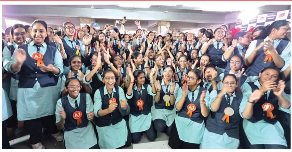
રાજકોટમાં ધોરણ ૧૦ના પરિણામો આવ્યા બાદ વિદ્યાર્થીઓમાં ઉત્સાહનો માહોલ જોવા મળ્યો હતો, સ્કૂલ ખાતે પરિણામ જોઈ વિદ્યાર્થીઓ ઝૂમી ઊઠ્યા હતા...