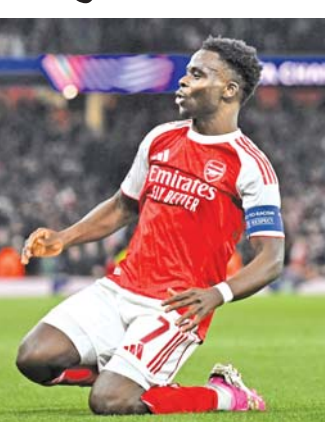
આ વખતે આર્સેનલનો ૩૦મી મેની બુકાયો સાકાએ ગોલ માર્યો હતો.

લંડન: આર્સેનલ ક્લબની ટીમ ૨૦ વર્ષ બાદ પહેલી વખત ચેમ્પિયન્સ લીગ ફૂટબોલ સ્પર્ધાની ફાઇનલમાં પહોંચી છે અને એનો સૌથી વધુ જશ એના મુખ્ય ખેલાડીઓમાંથી એક બુકાયો સાકાને મળ્યો જોઈએ, કારણકે તેણે મંગળવારે અહીં આર્સેનલને રોમાંચક સેમિ ફાઇનલમાં વિજય ૧-૦થી અપાવ્યો હતો. એટલેટિકો મેડ્રિડ સામેની સેમિ ફાઇનલનો એ બીજો રાઉન્ડ હતો જેમાં થયેલો એકમાત્ર ગોલ સાકાએ ૪૪મી મિનિટમાં કર્યો હતો. સેમિ ફાઇનલના બન્ને તબક્કાને ગણતરીમાં લઈએ તો આર્સેનલે મેડ્રિડને ૨-૧થી પરાજિત કરીને બે દાયકા બાદ ફાઇનલમાં એન્ટ્રી કરી. આર્સેનલ યુરોપની સૌથી મોટી ફૂટબોલ સ્પર્ધા ચેમ્પિયન્સ લીગમાં અગાઉ ફક્ત એક વખત ફાઇનલમાં પહોંચ્યું હતું. ૨૦૦૬ની એ ફાઇનલમાં આર્સેનલનો બાર્સેલોના સામે પરાજય થયો હતો.