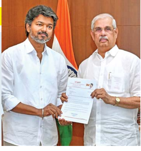
બેઠક: ચેન્નઈમાં બુધવારે લોક ભવન ખાતે યોજાયેલી બેઠક દરમિયાન તમિળના વેત્રી કળમગ (ટીવીકે)ના વડા થલપતિ વિજય સાથે તમિળનાડુના ગવર્નર રાજેન્દ્ર આર્લેકર.

કોંગ્રેસ પાર્ટી દ્વારા ટેકો જાહેર કર્યાના કલાકો પછી વિજય રાજ્યપાલને મળ્યા હતા. આ પહેલા ટીવીકે વડા અને કોંગ્રેસના નેતાઓ વચ્ચે અહીં એક બેઠક પણ યોજાઈ હતી. એક બાજુ ટીવીકે, વીસીકે અને બે ડાબેરી પક્ષો તરફથી સમર્થન મેળવવા માટે ઉત્સુક દેખાઈ રહી છે- જે હજુ પણ ડીએમકેના નેતૃત્વ હેઠળના ગઠબંધનનો ભાગ (જુઓ પાનું ૨) ▶▶