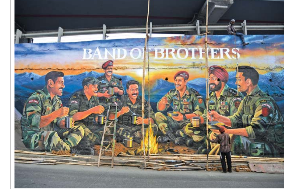
શૌર્ય ઝાંખી...: મુંબઈને સુંદર બનાવવા માટે પ્રશાસન સતત પ્રયાસ કરી રહી છે ત્યારે કોઈવતીના ઇલાચઓવર નીચેની દીવાલ પર ભારતીય લશ્કરી દળની ઝાંખી દર્શાવતું સુંદર ચિત્ર બનાવવામાં આવ્યું છે.

ટોચના રેન્કરોના બોર્ડ માક્સ અને એમએચ-સીઈટી સ્કોર્સમાં વિસંગતિ: તપાસની માગણી (અમારા પ્રતિનિધિ તરફથી) મુંબઈ: કોંગ્રેસ મંગળવારે મહારાષ્ટ્ર કોમન એન્ટ્રન્સ ટેસ્ટ (એમએચ-સીઈટી)માં ગંભીર ગેરરીતિઓનો આરોપ લગાવ્યો હતો, જેમાં દાવો કરવામાં આવ્યો હતો કે ધોરણ ૧૦ અને ૧૨ની બોર્ડ પરીક્ષાઓમાં ખૂબ ઓછા ગુણ મેળવનારા વિદ્યાર્થીઓએ અલ્ગિનિયરિંગ અને અન્ય ટેકનિકલ અભ્યાસક્રમો માટે લેવામાં આવેલી સીઈટીની પરીક્ષામાં લગભગ સંપૂર્ણ ગુણ મેળવ્યા હતા. બોર્ડની પરીક્ષાઓમાં ઓછા ગુણ મેળવનારા ઓછામાં ઓછા ૨૨ વિદ્યાર્થીઓ એમએચ-સીઈટી ૨૦૨૫-૨૬ માં ટોચના પ્રદર્શન કરનારાઓમાં હતા, તેમણે એવો દાવો કર્યો હતો કે ગેરરીતિઓનું પ્રમાણ નીટ-યુથ પેપર લીક કેસ જેવું જ હતું. ધોરણ ૧૦ અને ૧૨ની પરીક્ષાઓમાં માંડ ૩૫થી ૪૦ ટકા મેળવનારા વિદ્યાર્થીઓએ એમએચ-સીઈટીમાં ૧૦૦ ટકા ગુણ મેળવ્યા છે. આ એક ગંભીર ગેરરીતિ છે અને તેની સંપૂર્ણ તપાસ થવી જોઈએ, એમ સાવંતે કોંગ્રેસના નેતા સચિન સાવંતે જણાવ્યું હતું કે, (જુઓ પાનું ૪) >>