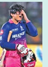
આજે કઈ મેચ? મુંબઈ - કોલકાતા ઈડન ગાર્ડન્સમાં, સાંજે ૭.૩૦

જયપુર: રાજસ્થાન રોયલ્સ (આરઆર)એ અહીં મંગળવારે લખનઉ સુપર જાયન્ટ્સ (એલએસજી)ને મહત્વપૂર્ણ લીગ મેચમાં સાત વિકેટે હરાવીને પ્લે-ઓફની વધુ નજીક પહોંચવામાં સફળતા મેળવી હતી. બેન્ડવૂડ, ગુજરાત અને હૈદરાબાદ પ્લે-ઓફમાં પહોંચી ગયા છે અને છેલ્લા (ચોથા) સ્થાન માટે પ્રજાબ, રાજસ્થાન તેમ જ નર્દાઈલ સંભાવના ધરાવનાર દિલ્હી, ચેન્નઈ, કોલકાતા સહિત જે પાંચ ટીમ વચ્ચે તીવ્ર હરીફાઈ હોવાનું કહેવાનું હતું એમાં રાજસ્થાનની સંભાવના આ વિજયને લીધે વધી ગઈ છે. પાંચ-ટુસમાં પ્રજાબ, રાજસ્થાન તેમ જ નર્દાઈલ સંભાવના ધરાવનાર દિલ્હી, ચેન્નઈ, કોલકાતા સહિત જે પાંચ ટીમ વચ્ચે તીવ્ર હરીફાઈ હોવાનું કહેવાનું હતું એમાં રાજસ્થાનની સંભાવના આ વિજયને લીધે વધી ગઈ છે. પાંચ-ટુસમાં રાજસ્થાને ઓવરટેક કર્યું છે. પ્રજાબ પહેલી વખત ટોપ-ફોરની બહાર આવ્યું છે. લખનઉએ પાંચ વિકેટે ૨૨૦ રન બનાવ્યા પછી રાજસ્થાને ૧૯.૧ ઓવરમાં ત્રણ વિકેટે ૨૨૫ રન કર્યાં હતા. ૧૫ વર્ષના વૈભવ સૂર્યવંશી (૯૩ રન, ૩૮ બોલ, ૬૬ સિક્સર, સાત