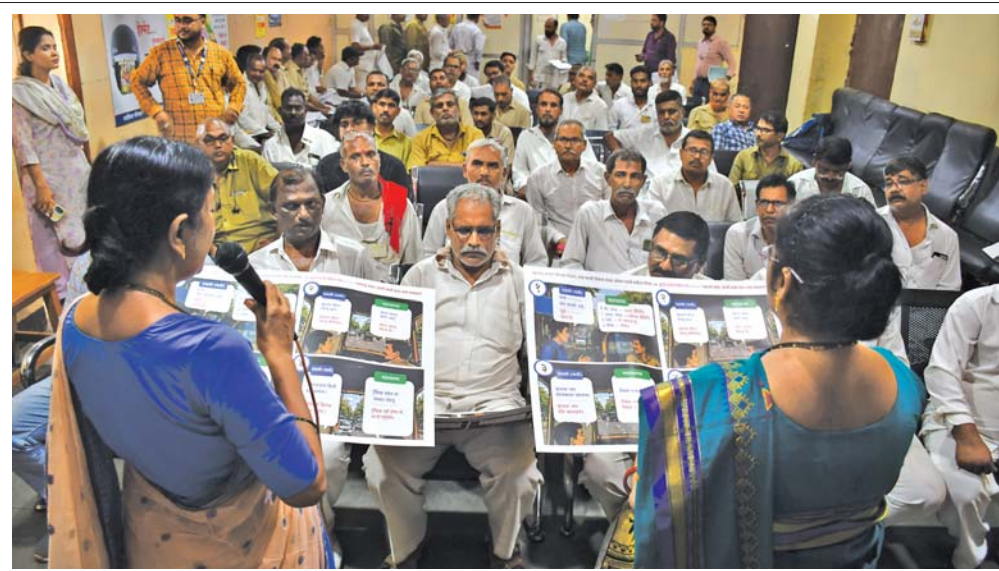
મરાઠી ફરજિયાતઃ રિક્ષા-ટેક્સીચાલકોને મરાઠી બોલવાનું પ્રશાસન દ્વારા ફરજિયાત કરવામાં આવ્યું છે ત્યારે વડાલા આરટીઓમાં રિક્ષા-ટેક્સીચાલકો માટે મરાઠી ભાષા પ્રશિક્ષણ કાર્યશાળા યોજાઈ હતી. (અમય ખરાડે)

વિમાનમાં એસી બંધ, ગરમી-ગૂંગામાણથી પ્રવાસીઓ હેરાન મુંબઈઃ ઈંધણના ભાવમાં વધારાને કારણે આંતરરાષ્ટ્રીય રૂટ પર ફ્લાઈટ્સની સંખ્યા ઓછી થઈ છે. મુસાફરોને વિમાનમાં ટેકનિકલ ખામીનો પણ સામનો કરવો પડી રહ્યો છે. બુધવારે સવારે મુંબઈ એરપોર્ટથી લંડન જતી બ્રિટિશ એરવેઝની ફ્લાઈટમાં ટેકનિકલ ખામી સર્જાઈ હતી. આ ખામીને કારણે ફ્લાઈટ લગભગ ચારથી પાંચ કલાક મોડી પડી હતી. બુધવારે સવારે ૯:૩૦ વાગ્યે બ્રિટિશ એરવેઝની ફ્લાઈટ લંડન જવા મુંબઈથી ઉપડવાની હતી. મુસાફરો વિમાનમાં યથ્વા પછી ખબર પડી કે વિમાનમાં ટેકનિકલ ખામી છે. વિમાનમાં એર કન્ડિશનિંગ સિસ્ટમ કામ કરી રહી ન હતી. વિમાન રનવે પર પાર્ક હોવાથી ગરમીને કારણે મુસાફરો પરસેવાથી રેબઝેબ થઈ ગયા હતા. બપોરે બે વાગ્યાની આસપાસ ખામી દૂર કરવામાં આવી. ત્યારબાદ વિમાન ઉડ્યું હતું. જોકે, આ વિલંબથી ઘણા મુસાફરોની આગળના આયોજનમાં વિક્ષેપ પડતા તેમણે એરલાઇન્સના કામકાજ પ્રત્યે અસંતોષ વ્યક્ત કર્યો.