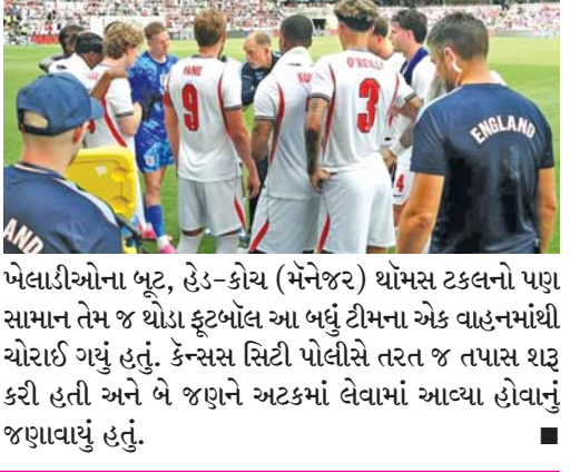
ખેલાડીઓના બૂટ, હેડ-કોચ (મનેજર) થોમસ ટકલનો પણ સામાન તેમ જ થોડા ફૂટબોલ આ બધું ટીમના એક વાહનમાંથી ચોરાઈ ગયું હતું. કેન્સસ સિટી પોલીસે તરત જ તપાસ શરૂ કરી હતી અને બે જણને અટકમાં લેવામાં આવ્યા હોવાનું જણાવાયું હતું.

કેન્સસ સિટી: ૧૯૬૬ના ફિફા વર્લ્ડ ચેમ્પિયન ઇંગ્લેન્ડની ટીમની આ વખતના વર્લ્ડ કપમાં પ્રથમ મેચ ગ્રૂપ-એલમાં છેક બુધવારે (ભારતીય સમય મુજબ મધરાત બાદ ૧.૩૦ વાગ્યાથી) ડલાસમાં કોએશિયા સામે રમાવાની છે એટલે તેઓ અમેરિકા પહોંચી ગયા બાદ બને એટલી વધુ પ્રેક્ટિસ કરવામાં વ્યસ્ત છે, પરંતુ તેમને જંગ પહેલાં જ ચોરીપાટી કરતી ગેન્ગનો કડવો અનુભવ થઈ ગયો. ઇંગ્લેન્ડની એક જાણીતી વેબસાઇટના અહેવાલ મુજબ કેન્સસ સિટીમાં બ્રિટિશ ખેલાડીઓ સ્વોપ સોફ્ટ વિલેજમાં રહે છે જ્યાં તેમણે પ્રેક્ટિસ કર્યા પછી જ સામાન (કિટ)રાખ્યો હતો એમાંથી મોટા ભાગની ચીજવસ્તુઓની ચોરી થઈ ગઈ હોવાનું મનાય છે. કેપ્ટન હેરી કેન અને તેના સાથી