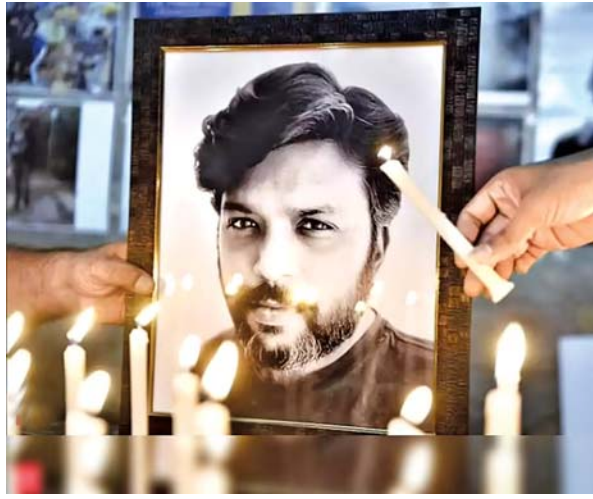
‘પુલિત્ઝર પ્રાઈસ’ વિજેતા ભારતીય ફોટો જર્નાલિસ્ટ : દાનિશ સિદ્દિકી