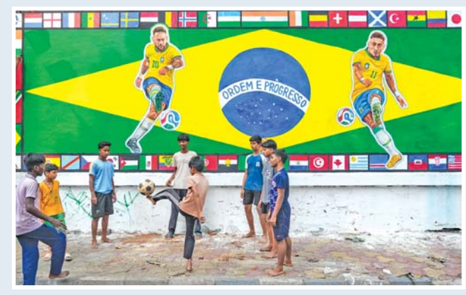
કોલકાતામાં બ્રાઝિલના ફ્લેગ તેમ જ નેમાર અને રાફિન્યાના કટઆઉટવાળી તસવીર પાસે ફૂટબોલ રમી રહેલા બાળકો.

બાંદરામાં મેસીનું તોર્તિંગ મ્યૂરલ જેમાં તેના મોને બારી તરીકે બનાવવામાં આવ્યું છે. આ પ્રચંડ તસવીરના લોન્ચિંગ વખતે ભારતીય ફૂટબોલ લેજન્ડ બાઈચુન્ગ ભૂટિયા પણ ઉપસ્થિત હતા.