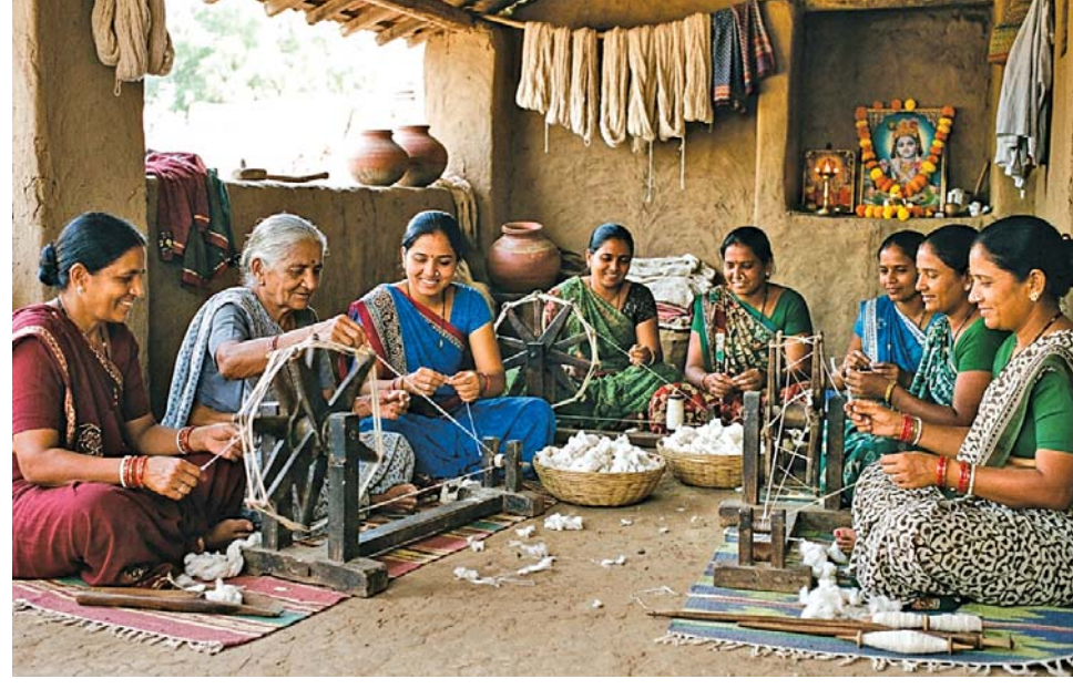
છે: કતણજી કા ન કરીએ, સુતી, સાહીએં હડ, સુભાહ ઈધે ઓંચતી, ઈધ ઉઘાડન ગડ... તું આમો દિવસ આળસમાં સૂતી રહીને હાડકાંને આરામ આપે છે અને કાંતવાનું કંઈ કરતી નથી. યાદ રાખજે, કાલે ઓંચિતી 'ઈદ' (મૃત્યુ અથવા હિસાબનો દિવસ) આવીને ઊભી રહેશે. ત્યારે તારી સખીઓ જ્યારે શણગાર સજીને નીકળશે, ત્યારે તું વસ્ત્રવિહીન (પુણ્ય વગરની) શણગાર માટે તલસતી રહી જઈશ. જુવાનીના, ભક્તિ કરવાના દિવસો તો તે આમનેમ ગુમાવી દીધા. હવે જ્યારે શરીર વૃદ્ધ થશે ત્યારે આ આંખે ભક્તિનો દોરો કેમ પરોવી શકીશ?

ધુકો ધાખલ ન કેઓ. અર્થાત્, જેણે મનની અંદર પૂરી કાળજી રાખીને ઝીણું (શુદ્ધ) સૂતર કાંત્યું છે, તેનું સૂતર તોળવા માટે એ પરમ શારદા (ભગવાને) ત્રાજવામાં કાટલું પણ મૂક્યું નહીં! એ તો એમનેમ જ સ્વીકારી લીધું. એટલું જ નહીં, જો કોઈ ભક્ત ભોળો છે, તેનામાં બહુ જ્ઞાન નથી અને તે 'જાડું-મોટું' સૂતર કાંતે છે, પણ જો તેનામાં સાચી શ્રદ્ધા અને અખૂટ પ્રેમ હોય તો ભગવાન તેનો સ્વીકાર પણ તોલ્યા વગર જ કરી લે છે. અમુક લોકોનાં ભક્તિ વર્તન જોઈને શાહસાહેબનો તીખો કટાક્ષ યાદ આવે છે: પલે પાયો પૂરિણું, ઘર ઘર ફેરા ડે, કા મૂં કતાએ, આંઉ કાપાઅતી આંઈયાં. એટલે કે પૂણીઓને પોતાના છેડામાં (પાલવમાં) લઈને જે સ્ત્રી ઘેર-ઘેર આંટા ફેરા કરે છે અને પૂછે છે કે 'કોઈને સૂતર કંતાવ્યું છે? હું કાપાતી છું!' તે અસલમાં કાંતતી નથી, માત્ર ડોળ કરે છે. સાચો ભક્ત તો યરખાનો અવાજ પોતાના શ્વાસને પણ સાંભળવા નથી દેતો! એ ગુપ્તપણે પ્રભુના પ્રેમમાં કંપતો કંપતો કાંતે છે અને એ ભક્તિનું મૂલ્ય હીરા-માણક કરતાં પણ મોંઘું છે. માનવ જીવન ક્ષણભંગુર છે. આપણને મળેલા આ સોના જેવા હાથોથી જો પ્રભુ સ્મરણ ન કર્યું તો અંતકાળે પસ્તાવાનો વારો આવશે. શાહ લતીફ આપણને ચેતવે છે: