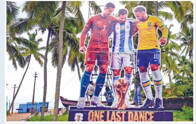
કેરલમના તિરુવનંતપુરમમાં ગઈ કાલે સેન્ટ એન્ડ્રુઝ બીચ નજીક રોનાલ્ડો, મેસી, નેમારના સંયુક્ત કટઆઉટ.