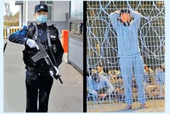
પરદેશની જેલમાં પત્રકારો