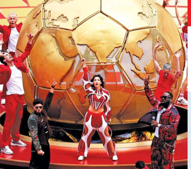
નોરા ફોટોની શાનદાર પરફોર્મન્સ ટોરન્ટોમાં શુક્રવારે ભારતીય અભિનેત્રી અને મૂળ કેનેડાની નોરા ફોટોની તથા અન્ય સાથીઓની રંગારંગ અને રોમાંચક ઓપનિંગ સેરેમની બાદ જોરદાર રસાકસી વચ્ચે મેચ શરૂ થઈ હતી.

ટૂર્નામેન્ટમાં સહ યજમાન છે. શુક્રવારે રાત્રે કેનેડા યુરોપના દેશ બોસ્નિયા એન્ડ હરઝેગોવિના સામેના પરાજયથી માંડ માંડ બચ્યું હતું. બંને દેશ વચ્ચેની મેચ ૧-૧ થી ડ્રોમાં ગઈ હતી. બોસ્નિયાના યોવો લ્યુકિચે ૨૧મી મિનિટમાં મેચનો પ્રથમ ગોલ કર્યો હતો. ત્યાર પછી પણ બોસ્નિયાના ડિફેન્ડરોએ સંરક્ષણ દીવાલ મજબૂત બનાવી રાખી હતી એટલે ફર્સ્ટ હાફના અંત સુધી કેનેડા ગોલ કરીને બરાબરીમાં નહોતું આવી શક્યું. સેકન્ડ હાફમાં બંને દેશ વચ્ચેની રસાકસી વધુ તીવ્ર બની હતી જેમાં