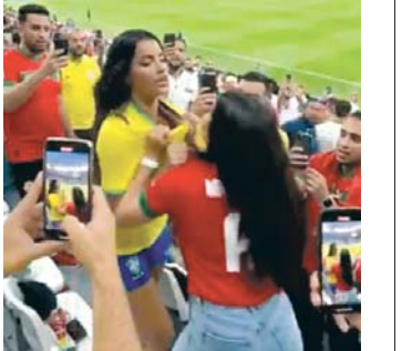
બે છોકરી વચ્ચે મારામારી