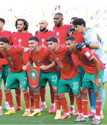
મોરોક્કોમાં ૯૯ ટકા ઉસ્લામ લોકોની વસતી છે. આ દેશના ફૂટબોલ ફેરેશને આ મેચમાં મોરોક્કોમાં ન જન્મેલા હોય એવા તમામ ૧૧ ખેલાડીઓને મેદાન પર ઊતારીને નવો કીર્તિમાન સ્થાપિત કર્યો હતો. મોરોક્કો એવો પ્રથમ દેશ બન્યો છે જેણે ફૂટબોલ વર્લ્ડ કપમાં એવી સ્ટાર્ટિંગ ઇલેવનને રમવા ઊતારી જેના તમામ ખેલાડીઓ મોરોક્કો સિવાયના દેશમાં જન્મેલા છે. ખેલાડીઓની આ લાઇન-અપ બતાવે છે કે ફૂટબોલની ટેલન્ટ વિશ્વભરમાં ફેલાયેલી છે.

ન્યૂ જર્સી: ભારતીય સમય મુજબ રવિવારે વહેલી સવારે બ્રાઝિલના ખેલાડીઓએ અહીં મોરોક્કો સામેની મેચને ટ્રોમાં લઈ જઈને નિરાંતનો શ્વાસ લીધો હતો, કારણકે પોતાનાથી ઊતરતા કમની મોરોક્કોની ટીમ સામે પરાજય ન જોવો મળ્યો એનો બ્રાઝિલિયનોને હાશકારો થયો હતો. જોકે આ મુકાબલો રમનાર ખુદ બ્રાઝિલના તમામ ખેલાડીઓને મોરોક્કોની લડાયક ટીમ વિશેની એક રસપ્રદ હકીકત જાણમાં નહીં હોય. મોરોક્કોની ટીમે આ વખતે એક અનોખો ઇતિહાસ રચ્યો છે. આ મેચ ૧-૧ થી ડ્રોમાં ગઈ હતી. ફિફા રેન્કિંગમાં બ્રાઝિલ છઠ્ઠા અને મોરોક્કો સાતમા નંબરે છે.