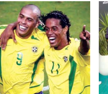
૧૯૯૦ના દાયકામાં (ડાબે) અને ગઈ કાલે રોનાલ્ડો અને રોનાલ્ડિન્યો