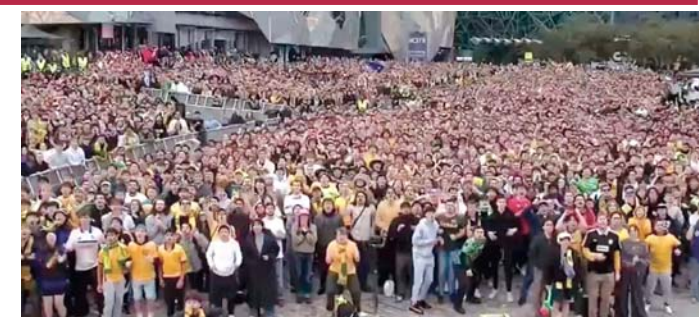
ઓસ્ટ્રેલિયાએ તુર્કીને ૨-૦થી હરાવ્યું. મેલબર્નમાં હજારો લોકોનું સેલિબ્રેશન. આવી ઉજવણી ક્રિકેટના વર્લ્ડ કપ વખતે પણ નથી જોવા મળી.

સેન ફ્રાન્સિસ્કોમાં શનિવારે મધરાત બાદ ૨૦૨૨ વર્લ્ડ કપના યજમાન કતાર અને સ્વિટ્ઝરલેન્ડ વચ્ચેની રોચક મેચ ૧-૧ થી ડ્રોમાં ગઈ હતી. મેચ ડ્રોમાં જતાં કતારને પણ એક પોઈન્ટ મળ્યો હતો અને એના ફિફા ઇતિહાસમાં આ પહેલો જ પોઈન્ટ હતો, કારણ કે અગાઉના વર્લ્ડ કપમાં કતાર એની તમામ મેચો હારી ગયું હતું. શનિવારે રાત્રે બ્રીલ એમ્બોલોએ મેચની ૧૭મી મિનિટમાં પેનલ્ટી કિક દ્વારા સ્વિસ ટીમને ગોલ અપાવવાની સાથે ૧-૦ થી સરસારી પણ અપાવી હતી. મેચની મુખ્ય ૯૦ મિનિટ બાદ ચોથી મિનિટ (કુલ ૯૪મી મિનિટ) સુધી એવું લાગતું હતું કે સ્વિટ્ઝરલેન્ડ આ મેચ ૧-૦ થી જીતી જ લેશે. જોકે ૯૪ મિનિટમાં (સ્ટોપેજ ટાઈમમાં) એશિયન ચેમ્પિયન કતારના ખેલાડી બોલેમ ખોઉકીના હેડરે બાજુ પલટી નાખી હતી.