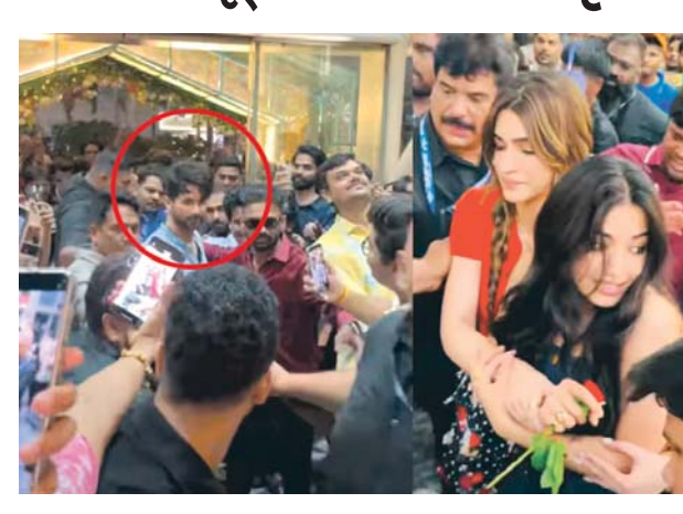
પુણે : પુણેમાં બોલિવૂડના જાણીતા સ્ટાર્સ સાથે ધક્કમુકીની એક ચોકવાનરી ઘટના બનતા, ભારે હોબાળો મચી ગયો હતો. આ ઘટના શાહિદ કપૂર, રશ્મિકા મંદાના અને કૃતિ સેનનની હાજરી વાળા એક કાર્યક્રમ દરમિયાન બની હતી. બોલિવૂડ અભિનેતા શાહિદ કપૂર, રશ્મિકા મંદાના અને કૃતિ સેનન આ ત્રણેય કલાકારો પુણેના વિમાન નગર વિસ્તારમાં આવેલા ફિનિક્સ મોલમાં એક કાર્યક્રમ માટે પહોંચ્યા હતા. આ કાર્યક્રમ માટે કોઈ પાસ કે ટિકિટની રાખવામાં આવ્યા નહોતા અને તે બધા માટે ખુલ્લો હતો. જોકે, પાસ સિસ્ટમના અભાવે તેમના મનપસંદ સ્ટારની એક ઝલક જોવા માટે મોટી ભીડ (જુઓ પાનું ૪) ▶▶