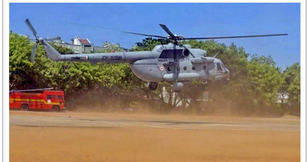
નીટ-યુજી ફેરપરીક્ષા અગાઉ ભારતીય હવાઈ દળના એમઆઈ-૧૭ હેલિકોપ્ટરે મંગળવારે તમિલનાડુના તિરુનેલવેલી ખાતે ટ્રાયલ રનમાં ભાગ લીધો હતો. ૨૧ જૂને યોજનારી નીટ-યુજીની ફેરપરીક્ષા માટે લેવામાં આવેલા સુરક્ષાનાં પગલાં હેઠળ સિલબંધ પ્રહારો અંતરિક્ષિત કરવાના ભાગરૂપ આ કવાયત હાથ ધરવામાં આવી હતી. (એજન્સી)

લોસ એન્જલસ: અમેરિકાનું બી-૫૨ બોમ્બર દક્ષિણ કેલિફોર્નિયાના મોજાવે ડેસ્ટિનિયન યુએસ એરફોર્સના મથકથી ટેક ઓફફ કર્યાના તુરંત બાદ આગના ગોળામાં ફેરવાઈ ગયું હતું અને તૂટી પડ્યું હતું જેને કારણે તેમાં સવાર તમામ આઠ જણનાં મોત થયાં હોવાનું સેનાના અધિકારીઓએ કહ્યું હતું. વિમાનમાં સવાર લોકોમાં સરકારી અધિકારી અને સેનાના ગણવેશધારી અધિકારીઓનો સમાવેશ થતો હતો. ઘટનાના વીડિયો ફૂટેજમાં સંપૂર્ણ વિમાન કાટમાળમાં ફેરવાઈ ગયું હોવાનું અને કશું જ ન બચ્યું હોવાનું જોવા મળ્યું હતું. બી-૫૨ બોમ્બર સોમવારે સવારે લગભગ ૧૧:૨૦ વાગે એડવર્ડ એરફોર્સ બેઝ પરથી રુટિન ટેસ્ટ મિશન માટે ઉપડ્યું હતું. વીડિયો ફૂટેજ નિહાળ્યા બાદ દુર્ઘટનાગ્રસ્ત વિમાનમાં સવાર લોકોમાંથી કોઈ જ બચ્યું ન હોવાનું જણાઈ આવ્યું હતું. (એજન્સી)