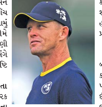
કોચ તરીકે નિયુક્ત કર્યા છે. વિલ્સન ઓગસ્ટમાં કોચ તરીકે તેમનો નવો કાર્યકાળ શરૂ કરશે. ■

ડબ્લીન: આયરલેન્ડની ક્રિકેટ ટીમને મોટો ઝટકો લાગ્યો છે. જેમાં મુખ્ય કોચ હેન્રિક મલાને પોતાના પદ પરથી રાજીનામું આપી દીધું છે. આયરલેન્ડની ટીમે તાજેતરમાં જ ભારત વિરુદ્ધ ટી-૨૦ શ્રેણી વિજયની ઉજવણી કરી હતી. આ અંગે આયરલેન્ડે ક્રિકેટ બોર્ડની સત્તાવાર પુષ્ટિ કરી છે. મલાન ૨૦૨૨ માં મુખ્ય કોચ બન્યા હતા દક્ષિણ આફ્રિકાના ૪૫ વર્ષીય હેન્રિક મલાન ૨૦૨૨ માં આયરલેન્ડ ટીમના મુખ્ય કોચ બન્યા હતા. તેમના કાર્યકાળની અંતિમ મેચ યાદગાર સાબિત થઈ. જેમાં રવિવારે બેલફાસ્ટમાં રમાયેલી મેચમાં આયરલેન્ડે ભારતને એક રનથી હરાવીને ટી-૨૦