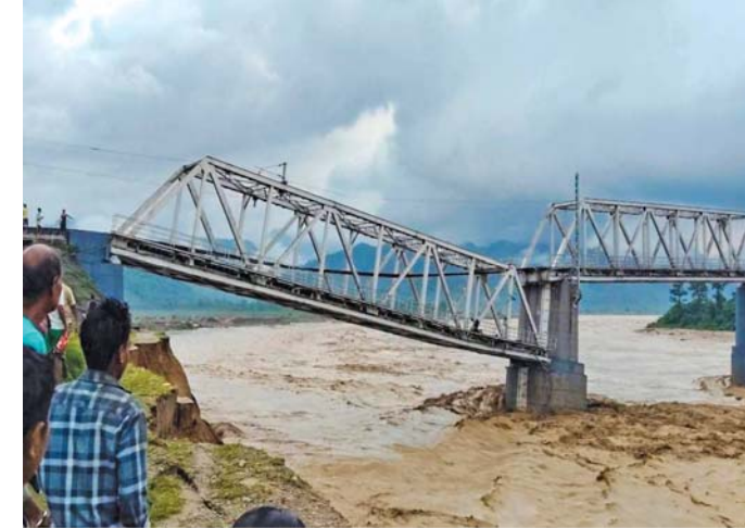
વરસાદ: સતત વરસાદને લીધે થયેલા ઘોવાણને કારણે સોમવારે આસામના ધેમજી જિલ્લામાં સિમેન નદી પરના બ્રિજનો અમુક હિસ્સો તૂટી ગયો હતો જેને કારણે એ ૩૮ પરની ટ્રેનસેવા અચોક્કસ મુદત માટે સસ્પેન્ડ કરવામાં આવી હતી. (એજન્સી)

નવી દિલ્હી: આસામ અને અરુણાચલ પ્રદેશમાં ભારે વરસાદને કારણે પૂરની પરિસ્થિતિ નિર્માણ પામી છે. વરસાદને કારણે અનેક ઘર અને રસ્તાઓને નુકસાન પહોંચ્યું હોવા ઉપરાંત ભેખડો ધસી પડવાની ઘટનાઓ પણ નોંધાઈ છે જેને કારણે આસામના ધેમાજી જિલ્લામાં વર્ષ ૧૯૬૫માં બાંધવામાં આવેલા પુલને પણ ભારે નુકસાન થયું છે. ગૃહ પ્રધાન અમિત શાહે પરિસ્થિતિ અંગેની જાણકારી મેળવવા અને સમીક્ષા કરવા સોમવારે આસામના મુખ્ય પ્રધાન હિંમંતા બિસ્વા શર્મા સાથે ફોન પર વાત કરી હતી. આસામ અને પડોશી અરુણાચલ પ્રદેશમાં છેલ્લા અનેક દિવસથી થઈ રહેલા ભારે વરસાદને પગલે નિર્માણ પામેલી પૂરની પરિસ્થિતિને કારણે છ જિલ્લામાં ૨૨,૦૦૦ કરતાં પણ વધુ લોકો પર માઠી અસર થઈ છે. આસામ સ્ટેટ ડિઝાસ્ટર મેનેજમેન્ટ ઓથોરિટી (એએસડીએમએ) દ્વારા જાહેર કરવામાં આવેલા આંકડાઓ મુજબ ધેમજી, નાલબારી, દિબ્રુગઢ, ચિરાન્ગ, લખીમપુર અને કોકરાઝાર એમ છ જિલ્લાના અંદાજે ૨૨,૧૨૪ લોકો પર પૂરની અસર થઈ છે. ભારે વરસાદને કારણે નિર્માણ પામેલી પૂરની પરિસ્થિતિની સૌથી વધુ અસર ધેમજી જિલ્લામાં વર્તાઈ છે અને અહીંના અંદાજે ૧૫,૪૮૩ કરતાં પણ વધુ લોકો તેનાથી પ્રભાવિત થયા છે. વહીવટીતંત્રના જણાવ્યા અનુસાર પૂરનાં પાણીમાં ૯૬ ગામ ડૂબી ગયાં છે અને ૧,૬૯૦ હેક્ટર કૃષી જમીનને ભારે નુકસાન થયું છે. સતત વરસાદને કારણે બ્રહ્મપુત્રા અને તેની ઉપનદીઓમાં જળસ્તર વધી રહ્યું છે. માનવ ઉપરાંત ૪૮,૧૯૯ જેટલાં પ્રાણીઓ પર પણ ભારે વરસાદની અસર થઈ હોવાનું જણાઈ આવ્યું છે. ધેમજીમાં એક રેલવે બ્રિજનો હિસ્સો તૂટી પડ્યો હતો જેને કારણે આર્યાપથર અને સિમન છાપરી સ્ટેશન વચ્ચેની રેલસેવા અચોક્કસ મુદત માટે સસ્પેન્ડ કરવાની ફરજ પડી હતી. (એજન્સી)