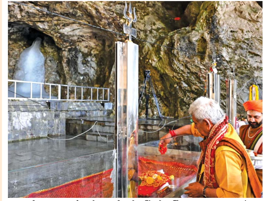
પૂજા-અર્ચના: જમ્મુ-કાશ્મીરના લેફ. ગવર્નર મનોજ સિંહાએ વાર્ષિક અમરનાથ યાત્રાના આરંભના ભાગરૂપ સોમવારે અમરનાથ ગુફામાં વિધિવિધાન સાથે પ્રથમ પૂજા-અર્ચના કરી હતી.

સુરેશ એસ. ડુગ્ગર જમ્મુ: જયેષ્ઠ પૂર્ણિમા પર થતી અમરનાથ યાત્રાની પ્રથમ પૂજા આ વરસે પણ પવિત્ર ગુફામાં કરવામાં આવી હતી. ત્રણ જુલાઈથી શરૂ થતી અમરનાથ યાત્રા અગાઉના પહેલા સોમવારે પવિત્ર ગુફામાં પ્રથમ પૂજા કરવામાં આવી હતી. જમ્મુ-કાશ્મીરના લેફ. ગવર્નર મનોજ સિંહાએ સૌથી પહેલા અમરનાથ ગુફામાં દર્શન કરી વિધિવિધાન અનુસાર પૂજા-અર્ચના કરી હતી. આ વરસની અમરનાથ યાત્રા ત્રણ જુલાઈથી શરૂ થઈ રહી છે, પરંતુ પરંપરા અનુસાર યાત્રા શરૂ થતાં અગાઉ અમરનાથ ગુફામાં એક વિશેષ પૂજા-અર્ચના કરવામાં આવી હતી. આ પૂજામાં જમ્મુ-કાશ્મીરના લેફ. ગવર્નર મનોજ સિંહા અને અમરનાથ શ્રાઈન બોર્ડના તમામ મોટા અધિકારીઓ હાજર રહ્યા હતા અને તેમણે તમામ દેશવાસીઓનાં સારા સ્વાસ્થ્ય, પ્રગતિ અને ખુશી માટે પ્રાર્થના કરી હતી.