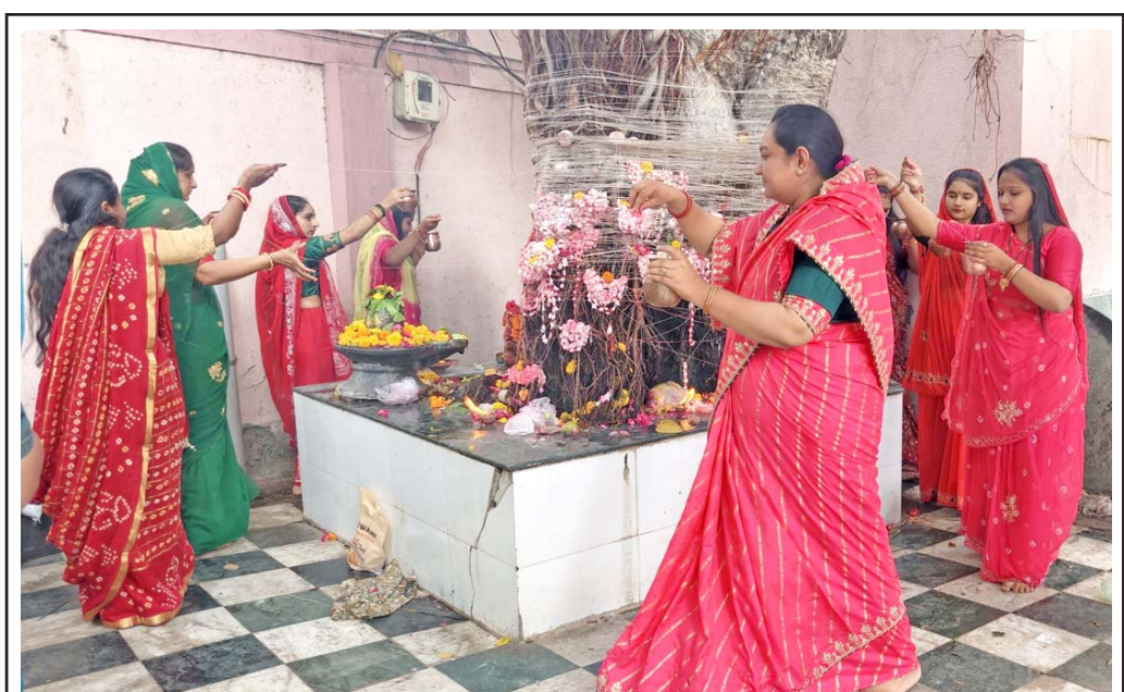
વટ સાવિત્રી વ્રત એ હિન્દુ ધર્મમાં પરિણીતાઓ માટે અતિ પવિત્ર અને અખંડ સૌભાગ્યનું મહાપર્વ છે, રાજકોટમાં પરિણીત મહિલાઓએ પતિના દીર્ઘાયુષ્ય, ઉત્તમ આરોગ્ય અને સુખી દાંપત્યજીવનની કામના સાથે આ વ્રતની શ્રદ્ધાપૂર્વક ઉજવણી કરી હતી...

બે મહિલા દર્દીઓ ફસાઈ ગઈ હતી, પરંતુ હોસ્પિટલના લેફ્ટાઈન સ્ટાફ અને સ્થાનિક યુવાનોએ પોતાની જાન જોખમમાં મૂકીને તાત્કાલિક બંને મહિલા દર્દીઓનું સુરક્ષિત રેસ્ક્યૂ કરી તેમને અન્યત્ર ખસેડી લીધી હતી. ઘટના અંગે જાણ કરતાં ભુજ નગરપાલિકાનો ફાયર ફાઈટર કાફલો ઘટનાસ્થળે ધસી ગયો હતો. ફાયર બ્રિગેડના જવાનોએ ભારે જહેમત ઉઠાવી, ચારેય તરફથી પાણીનો મારો ચલાવીને આગને વધુ ફેલાતી અટકાવી હતી અને ટૂંક સમયમાં જ તેના પર સંપૂર્ણ કાબૂ મેળવ્યો હતો. સદનસીબે આ અકસ્માતમાં કોઈ માનવ જિંદગી હોમાઈ નથી કે કોઈને ઈજા થઈ નથી. જો કે, આગની તીવ્રતા એટલી વધુ હતી કે હોસ્પિટલના કિંમતી તબીબી સાધનો, દવાઓ, વાયરિંગ અને આંતરિક માળખાને મોટું આર્થિક નુકસાન પહોંચ્યું છે. આગ લાગવાના ચોક્કસ ટેકનિકલ કારણો જાણવા માટે સંબંધિત તંત્ર દ્વારા સત્તાવાર તપાસ શરૂ કરવામાં આવી છે.