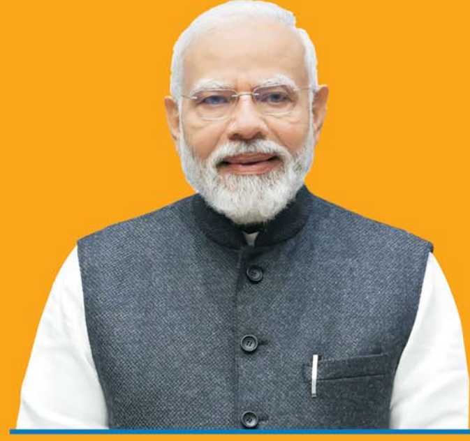
શ્રી નરેન્દ્ર મોદી માનનીય વડા પ્રધાન