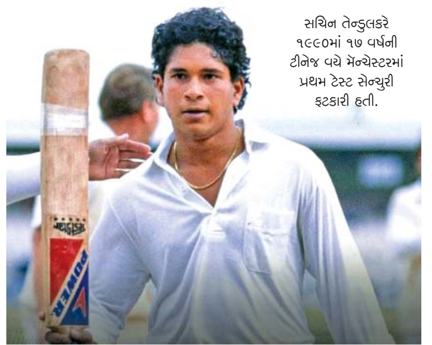
સચિન તેન્ડુલકરે ૧૯૯૦માં ૧૭ વર્ષની ટીનેજ વયે મેન્ચેસ્ટરમાં પ્રથમ ટેસ્ટ સેન્યુરી ફટકારી હતી.

મોકો નથી મળ્યો એ વાત અલગ છે, પણ તેનું નામ 'મેન્ચેસ્ટરના મહારથીઓ' સાથે જરૂર જોડાઈ ગયું છે. મેન્ચેસ્ટરના ઓલ્ડ ટ્રેફર્ડ ક્રિકેટ સ્ટેડિયમની સ્થાપના ૧૮૫૭માં (૧૬૯૯ વર્ષ પૂર્વે) થઈ હતી. લૅન્કેશર કાઉન્ટીની ટીમ આ શહેરની હોમ-ટીમ છે. એમિરેટ્સ ઓલ્ડ ટ્રેફર્ડ તરીકે પણ ઓળખાતા આ સ્ટેડિયમમાં ૧૯,૦૦૦ પ્રેક્ષક બેસી શકે એટલી સીટ છે. ૨૦૧૧માં અહીં ફ્લગલાઇટ્સ બેસાડવામાં આવી હતી.