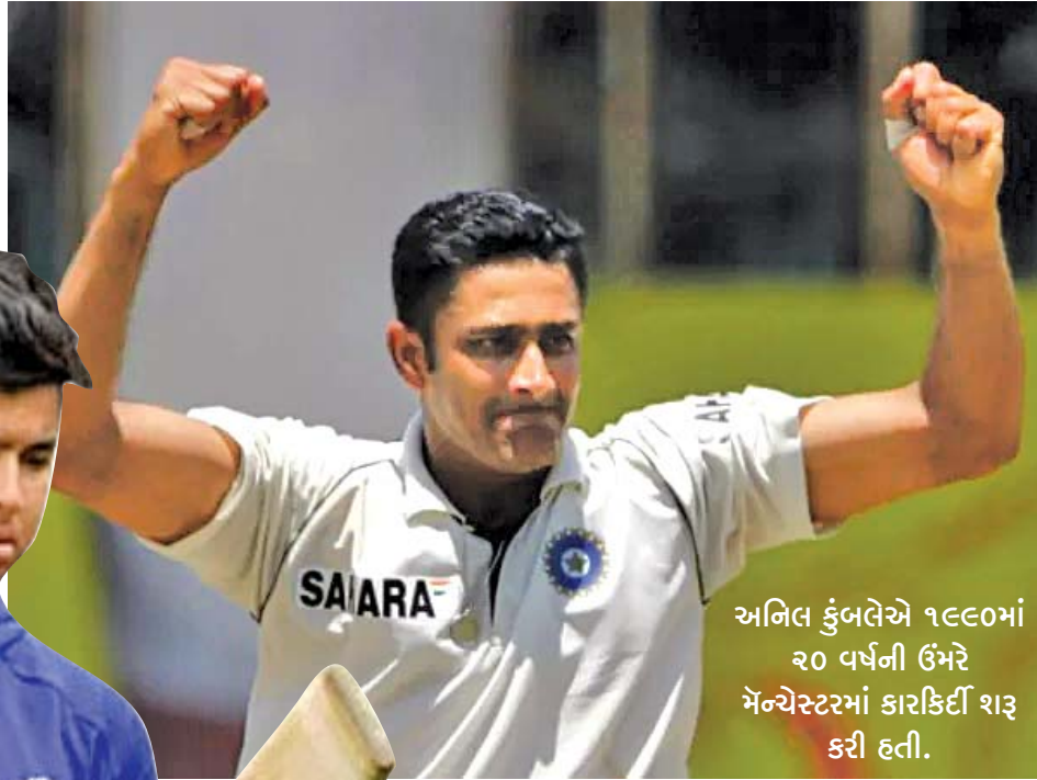
અનિલ કુંબલેએ ૧૯૯૦માં ૨૦ વર્ષની ઉંમરે મેન્ચેસ્ટરમાં કારકિર્દી શરૂ કરી હતી.

બરાબર એક વર્ષ પહેલાં (જુલાઈ, ૨૦૨૫માં) ૨૦૧૩ વર્ષીય વૈભવને ઓલ્ડ ટ્રેફર્ડમાં જ મળ્યો હતો. ત્યાર બાદ ૧૨ મહિનામાં તેને ફરી ટીમ ઇન્ડિયા વતી રમવાનો