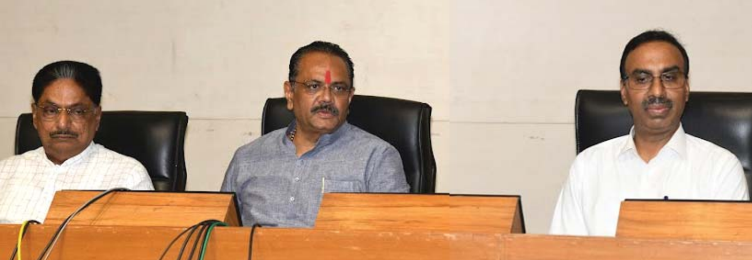
પત્રકાર પરિષદને ગુજરાતના પ્રધાનોએ સંબોધી હતી.

અગાઉ ત્રણ તબક્કામાં ચૂકવણાના બદલે એકી સાથે શરૂઆતમાં જ ૧૦૦ % ચૂકવણું