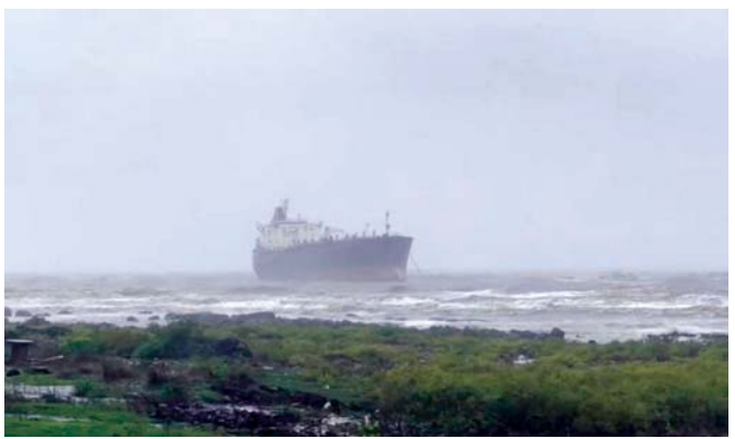
મનોરી બીચથી એક કિ.મી. જેટલા અંતરે એક માનવરહિત જહાજ આવી પહોંચ્યું હતું. પોલીસે માહિતી આપતા તટરક્ષકદળની બોટ સહાય માટે પહોંચી હતી.

મુંબઈ: અનુરાધાર વરસાદ વચ્ચે ઉત્તર મુંબઈના મનોરી નજીક દરિયામાં નદિયાતું જહાજ નજરે પડતાં કોસ્ટ ગાર્ડ પોતાની બોટ મોકલી હતી, જેથી જહાજને કારણે મનોરીના દરિયાકિનારાની આસપાસ નુકસાનનો ક્યાસ કાઢી શકાય. એક નિવેદનમાં ઈન્ડિયન કોસ્ટ ગાર્ડ (આઈસીજી) જણાવ્યું હતું કે ખરાબ હવામાનને કારણે એમટી અસ્ફાલ્ટ સ્ટાર, એમટી સ્ટેલર રુબી અને એમટી અલ જાક્રિયા નામનાં જહાજો તણાઈ જવા બાબતે પાંચમી જુલાઈએ ડિસ્કવરી જનરલ ઓફ શિપિંગ તરફથી તેમને એક મેસેજ મળ્યો હતો. પરિસ્થિતિનો તાગ મેળવવા અને જહાજોને જરૂરી મદદ પૂરી પાડવા માટે આસીજીએ સમ્રાટને તે તરફ વાળવામાં આવ્યું હતું. એ સાથે સહાય પૂરી પાડવા ઈટીવી વોટર લિલી તહેનાત કરવા ડીજી શિપિંગને વિનંતી કરવામાં આવી હતી, એવું કોસ્ટ ગાર્ડ જણાવ્યું હતું. અત્યારે એમટી અસ્ફાલ્ટ સ્ટાર અને એમટી સ્ટેલર રુબી જહાજ લાંગરેલાં છે અને તેના પરના ક્રૂ મેમ્બર્સ સુરક્ષિત છે. એમટી અલ જાક્રિયા માનવરહિત હતું, જે કથિત રીતે મનોરી કિનારે ફસાઈ ગયું છે. આઈસીજીએ સમુદ્ર પ્રહરી અને ઈમર્જન્સી ટોવિંગ વેસલ વોટર લિલી જરૂરી મદદ કરવા તે વિસ્તારમાં હાજર છે. મુંબઈ પોલીસે જણાવ્યું હતું કે ભારે વરસાદને કારણે આ જહાજ મનોરી બીચથી દરિયામાં લગભગ એક કિલોમીટરના અંતરે અટવાયું હતું. ગોરાઈ પોલીસ સ્ટેશનના અધિકારીએ જણાવ્યું હતું કે ફસાયેલા જહાજ અંગેની માહિતી સોમવારની સવારે મળી હતી અને પ્રોટોકોલ અનુસાર