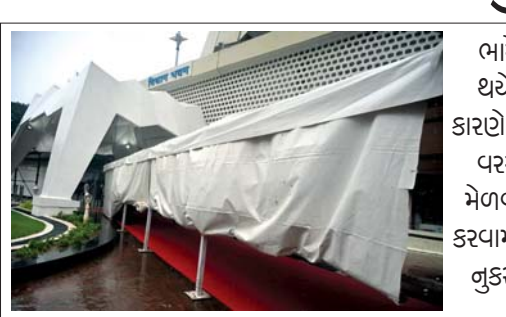
ભારે પવન સાથે થયેલા વરસાદને કારણે વિધાનભવનમાં વરસાદથી રક્ષણ મેળવવા માટે ઊભો કરવામાં આવેલ શેડને ગુડસાન થયું હતું.

(અમારા પ્રતિનિધિ તરફથી) મુંબઈ: મુંબઈ અને આસપાસના વિસ્તારોમાં ભારે વરસાદને ધ્યાનમાં રાખીને સોમવારે મહારાષ્ટ્ર વિધાનસભાની કાર્યવાહી દિવસભર માટે મુલતવી રાખવામાં આવી હતી. ઉપલા ગૃહને મુલતવી રાખવામાં આવે તે પહેલાં ડિઝાસ્ટર મેનેજમેન્ટ મિનિસ્ટર ગિરીશ મહાજને જણાવ્યું હતું કે મુંબઈ અને પડોશી પાલવર અને રાયગઢ જિલ્લામાં રેકોર્ડબ્રેક વરસાદ